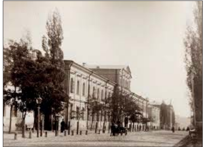
Друга київська гімназія

українського правопису», наступного року видає російською мовою «Керівництво для вивчення української мови в російських школах», натхненно працює над підготовкою «Граматика української мови».