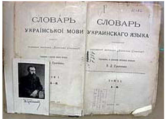
1-а сторінка I-го тому «Словаря української мови» Б. Грінченка, 1907 р.

Робота над «Словарем української мови» привернула увагу й української інтелігенції, і всього світу. Тож 1905 року Російська Імператорська академія наук відзначила словник другою премією Миколи Костомарова. За період від 1902 до 1909 року вийшли всі чотири томи «Словаря української мови», де було зафіксовано і пояснено з перекладом російською мовою близько 68 тисяч слів. Цей словник було укладено з матеріалу, збирання якого почав П. Куліш 1861 року і продовжувала «Київська громада». Матеріал словника охоплює етнографічні записи і літера-