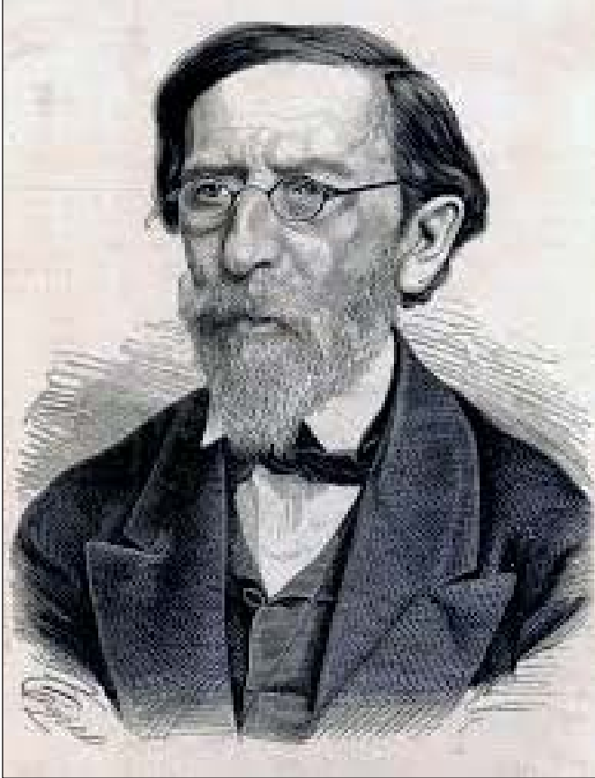
Видатний український науковець, енциклопедист, фольклорист, історик Михайло Максимович (15.09.1804–22.11.1873)