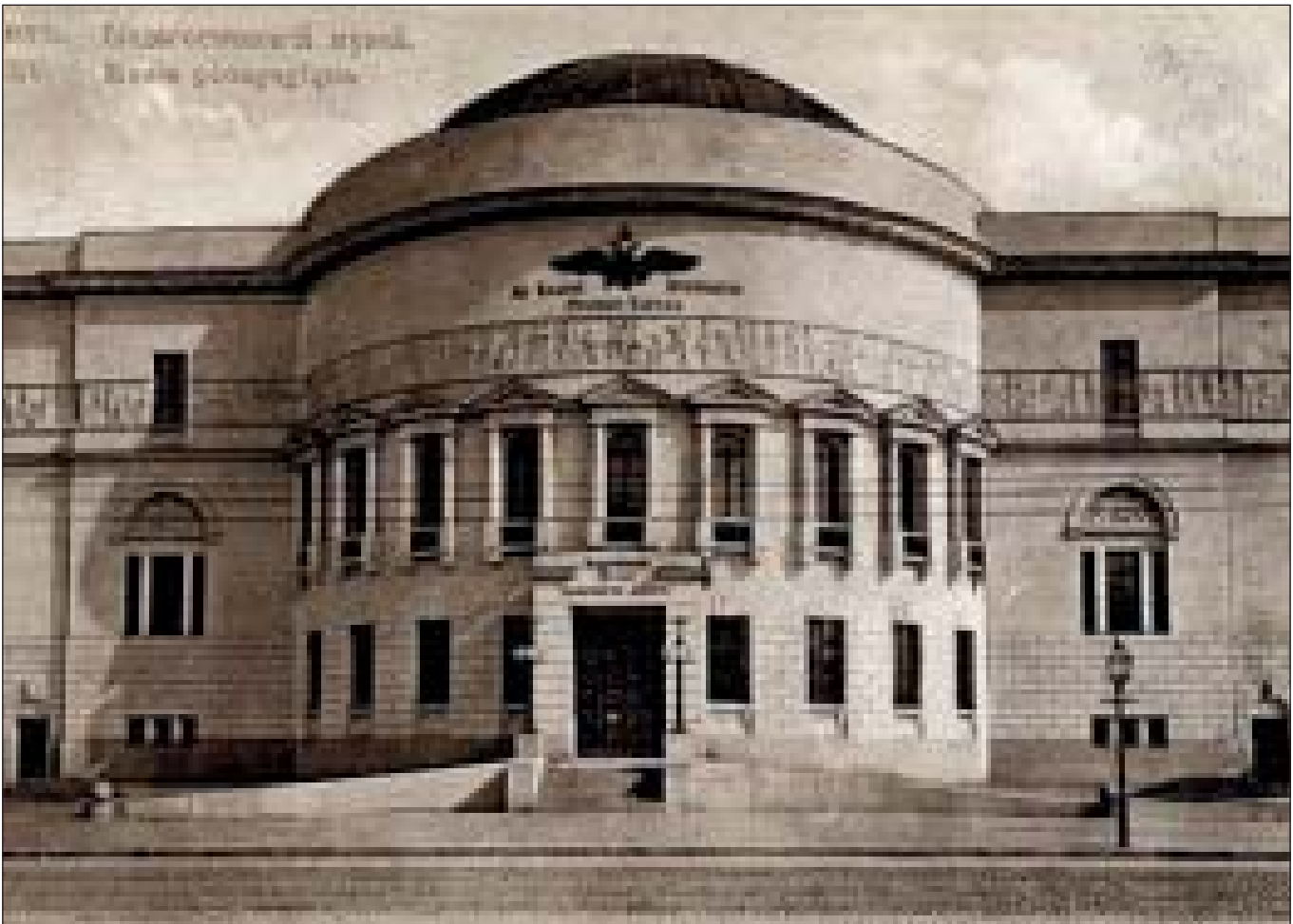
Педагогічний музей, м. Київ

Вченого посмертно реабілітували 13 грудня 1991 року ■