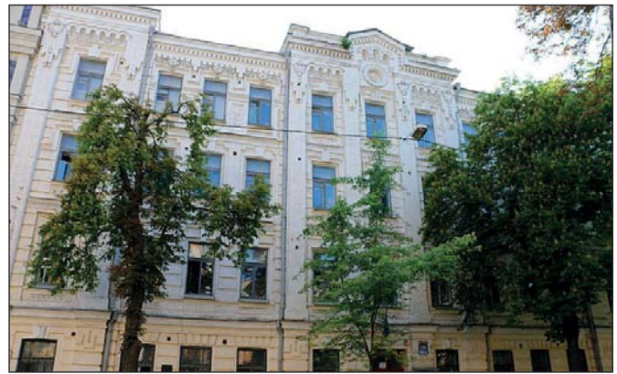
Будинок, у якому містилася гімназія Володимира Науменка

«Хіба що новий міністр освіти був особливо видатною людиною, – зазначав гетьман Скоропадський. – Людина дуже культурна, відомий педагог поміркованих поглядів і любив Україну. Тільки шовінізм наших українців змусив не розпізнати Науменка належним чином і нехтувати такою людиною, діяльності якої так потребувала Україна, бо ж педагогів узагалі і в Росії хороших не було. А Науменко справді видатна людина у своїй спеціальності. Він з великою енергією взявся за деякі реформи, які оздоровлювали нашу навчальну діяльність. Крім того, він хотів створити зразкову українську гімназію. Я завжди дуже любив його доповіді, оскільки бачив у ньому світлу ідейну особистість, що так рідко зустрічаються у наш час».