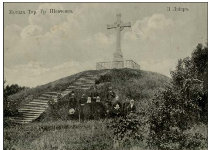
Могила Тараса Шевченка у Каневі