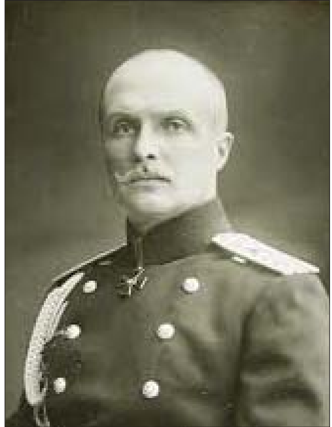
Гетьман України, український державний і громадський діяч Павло Скоропадський (15.05.1873–26.04.1945)

Не можна не згадати, що чи не найважливішою для себе працею впродовж чотирьох десятиліть Володимир Науменко вважав опіку і оберігання «святині українського народу» – Шевченкової могили.