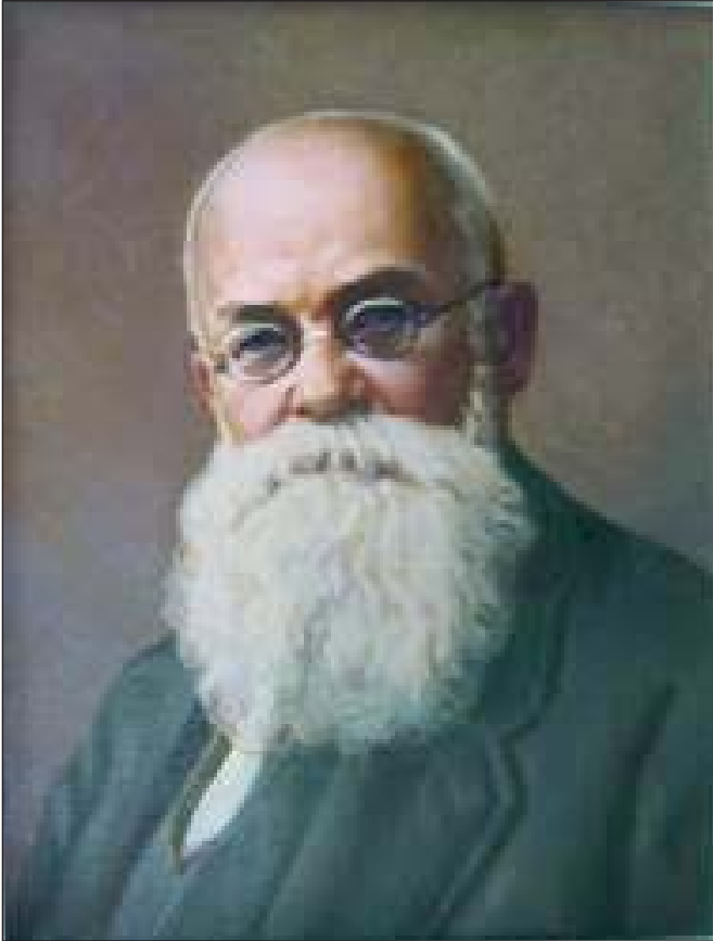
Український історик, громадський і політичний діяч Михайло Грушевський (29.09.1866 – 26.11.1934)

турні твори 1798–1870 років, майже весь документований, так що на середину ХХ століття словник Грінченка залишався найповнішим словником такого типу для української мови і одним із найкращих в українській лексикографії.