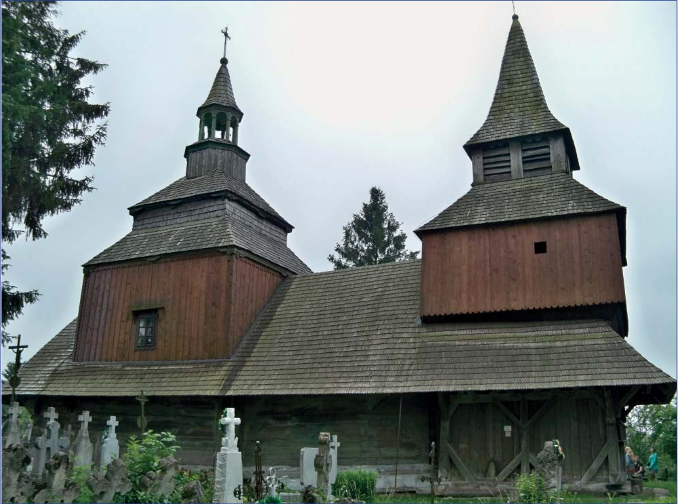
Храм Св. Духа в Рогатині, 1481 рік

Внутрішній простір церкви відповідає суті богослужіння, отже має три частини: вівтар, наву і бабинець. У вівтарі священники вершать літургію з таїнством Євхаристії – принесення безкровної жертви, Агнца Божого за гріхи людства. У наві моляться вірні християни, а у бабинці (притворі) моляться оголошені – тобто ті, хто готується до таїнства хрещення. Приміщення вівтаря традиційно вище від нави на кілька сходиночок та відгороджене іконостасом. За царськими вратами розташований освячений із закладенням частинок святих мощей престол, на якому здійснюється Євхаристія. Розміщення образів на іконостасі має певну систему, що стала канонічною. На намісному ряді, праворуч та ліворуч від царських врат, зазвичай знаходяться ікони Христа Пантократора і Богородиці з немовлям Христом, за ними – ікони Архангела Гавриїла (праворуч) та Архангела Михаїла (ліворуч), потім ікона Святого (або християнського свята), на честь якого освячений храм. Над царськими вратами – ікона «Спас Нерукотворний», ще вище – зображення «Таємної вечері», нагорі «Деїсус» (образи Христа та Богородиці з Іоанном Хрестителем, які моляться до Спасителя). Увінчує іконостас великий дерев'яний хрест із Розп'яттям.