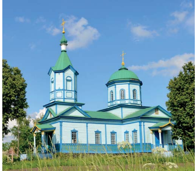
Церква Вознесіння Господнього 1879