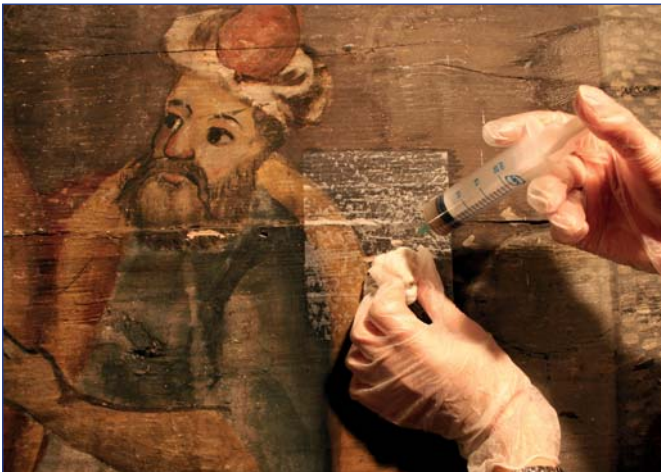
Підведення клею при реставрації.

Все це спотворює вигляд українських дерев'яних церков. Варто враховувати і той факт, що держава фінансує реставрацію переважно тих об'єктів, які не втратили свого автентичного стану. Журналісти пишуть, що професійна реставрація однієї дерев'яної церкви коштує в середньому близько пів мільйона гривень: у багатьох селах громада роками збирає кошти для збереження столітньої церкви, шукає благодійників-меценатів заради того, щоби розпочати необхідні роботи.