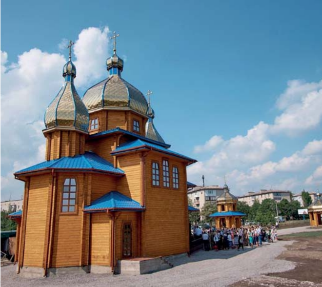
Церква Св. Миколая Чудотворця у Волновасі Донецької області