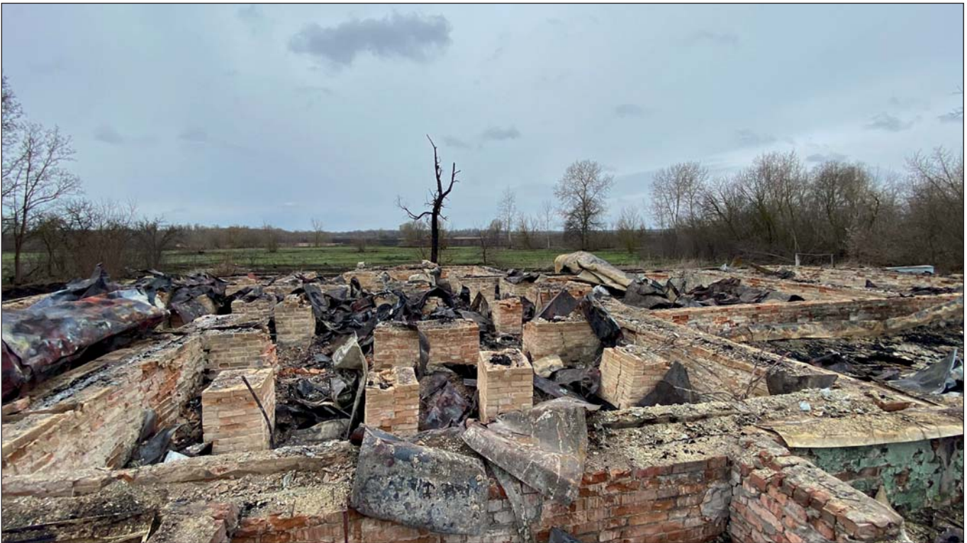
Руїни церкви Вознесіння Господнього

го, зведений у 1879 р. в селі Лук'янівка Броварського району Київської області. Село опинилося в зоні бойових дій, і вже в останні дні окупації, коли село звільняли Збройні сили України, російський танк чотирма пострілами вщент зруйнував храм – сьогодні там залишився лише кам'яний фундамент.