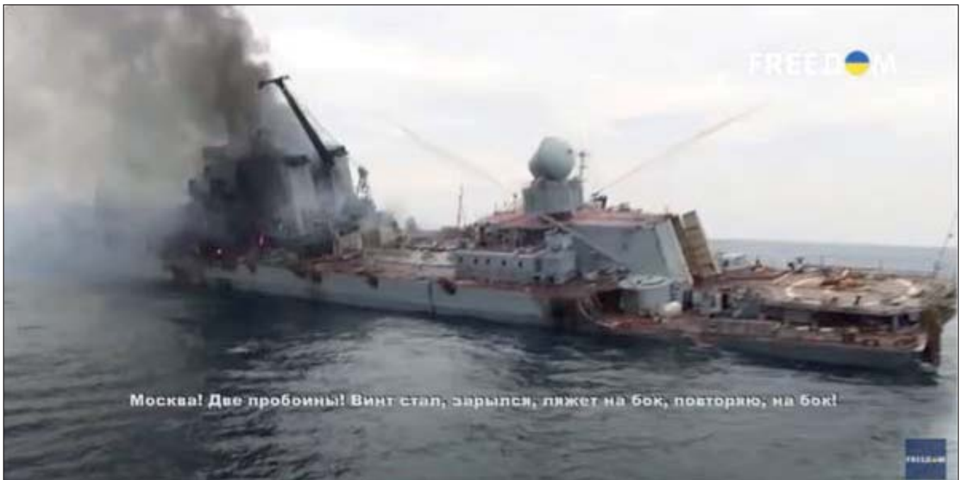
Кадр із відео затоплення крейсера «Москва», флагмана Чорноморського флоту РФ, який брав участь у військових конфліктах у Грузії (2008) та Сирії (2015), а також у блокаді українського флоту в Криму (2014) та повномасштабному вторгненні в Україну (2022). Був уражений двома українськими крилатими протикорабельними ракетами Р-360 «Нептун» 13 квітня 2022 р. https://www.youtube.com/watch?v=gTuz8puk8mM