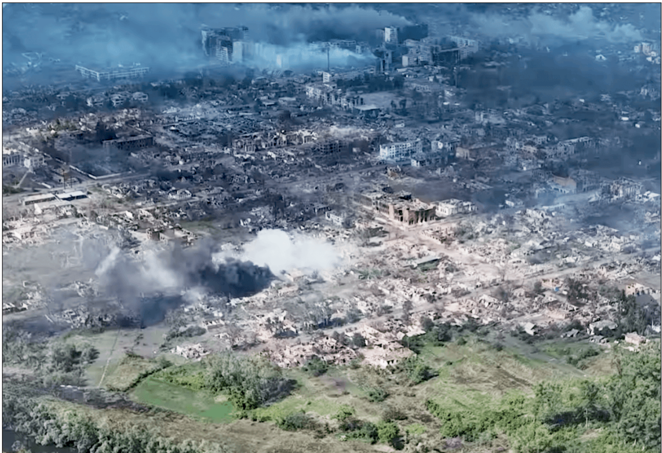
Місто Вовчанськ, яке російські загарбницькі війська нещадно знищують під час свого наступу на Харківському напрямку. Відео опублікувала Об'єднана штурмова бригада Національної поліції України "Лють" на своїй офіційній сторінці у фейсбуці. Дрон зняв знищені та зруйновані російськими обстрілами житлові та інші будинки. 2 серпня 2024 р.