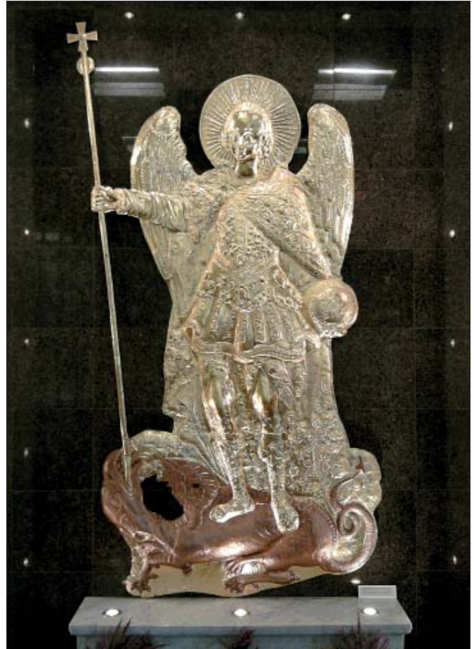
Барельєф Святий Архистратиг Михаїл з башти з годинником в експозиції Музею історії Києва (фото з архіву музею)

Велична постать Небесного Покровителя Києва при-крашала башту ратуші аж до 1811 р., коли постраждала від пожежі на Подолі. За більше ніж 300 років своєї історії барельєф неодноразово перевозили з місця на місце. У 1876 р. цей шедевр безглуздо визнали «нецінним» і навіть хотіли здати «на лом». Слава Богу, він зберігся цілим: тепер Архистратиг Михаїл зустрічає відвідувачів на першому по-версі музею історії міста Києва.