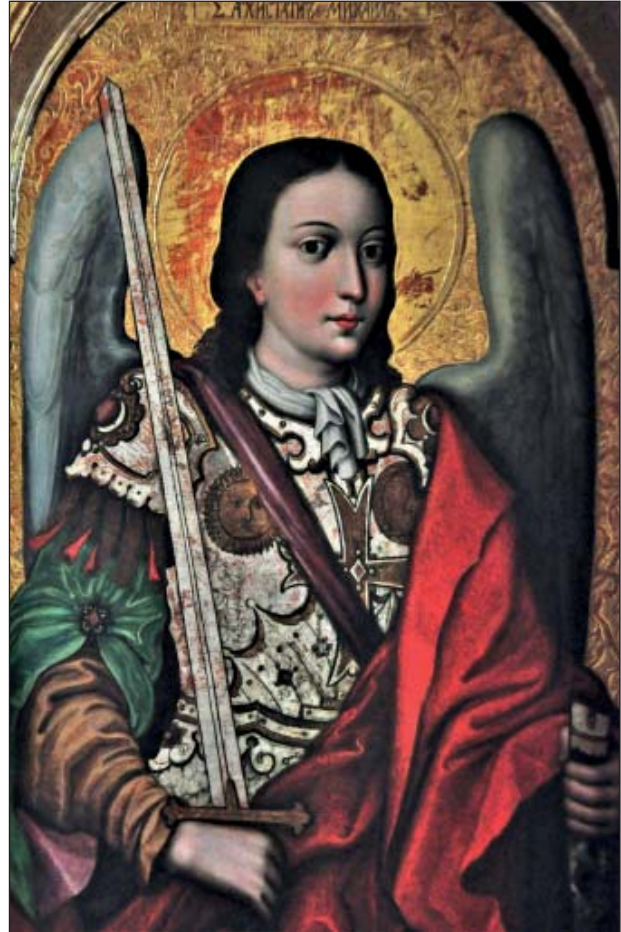
Йов Кондзелевич Архистратиг Михаїл з Богородчанського іконостасу (Нац.музей у Львові ім.А.Шептицького)

До кращих взірців сакрального малярства належить образ Архистратига Михаїла, створений Йовом Кондзелевичем для іконостасу церкви Воздвиження Чесного Хреста в монастирі Великий Скит у с. Маняві (відомий під назвою «Богородчанський іконостас» [21], та аналогічний образ для іконостасу церкви Святої Трійці у м. Жовкві [22], намальований Іваном Рутковичем (обидва зберігаються в Національному музеї у Львові ім. Андрея Шептицького).