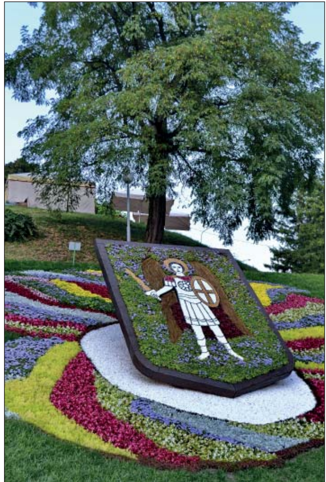
Клумба з гербом Києва

черській лаврі, де написав «Життя святих» («Четьї-Мінеї»), що до сьогодні користуються широкою популярністю.