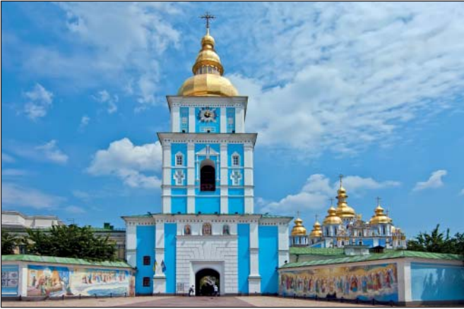
Михайлівський Золотоверхий собор та монастир

Після відродження собору, сучасні християни отримали можливість молитися в обітелі Небесного захисника Києва. На фасаді та в інтер'єрі храму, відбудовано архітектором Юрієм Лосицьким у 1997–1998 р., можна побачити близько 20 різноманітних зображень Архистратига Михаїла. Над входом до храму ми бачимо позолочений барельєф «Шестокрилатого Першого князя, воеводи Небесних Сил, херувимів і серафимів». Це точна копія [17] оригінального барельєфу XVIII ст., що тепер став експонатом музею історії Михайлівського Золотоверхого монастиря, але з однією неточністю: на сучасному барельєфі в лівій руці Архистратига немає щита.