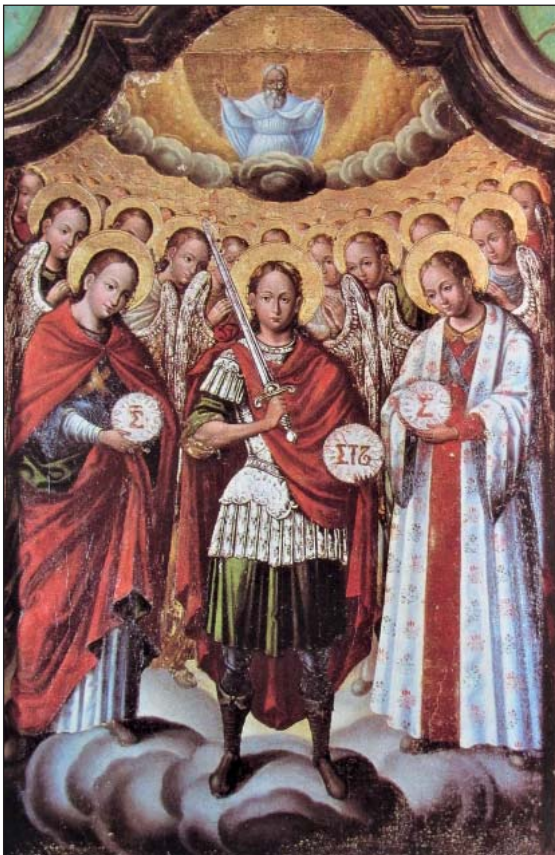
Собор Архистратига Михаїла (поч. XVIII ст.)

У храмах, присвячених Архистратигу Михаїлу, є багато ікон, що призначені прославити Небесного Воеводу. У першу чергу – це «храмовий образ» в намісному ряді іконостасу, праворуч від ікони Христа-Вседержителя. Ікони із «клеймами» оспівують відомі із Святого Писання діяння Архистратига Михаїла. Серед цих композицій можна побачити: «Вигнання з Раю», «Знищення Содому», «Поєдинок із Яковом», «Явління Ісусу Навину перед Єрихоном», «Порятунок трьох отроків», «Архангел Михаїл приносить із Авакумом їжу Даниїлу у рові з левами», «Чудо в Хонах» та інші. У храмах також присутні ікони Небесних Сил Безтілесних, зокрема композиції «Собор Архистратига Михаїла» та «Архангели Михаїл і Гавриїл».