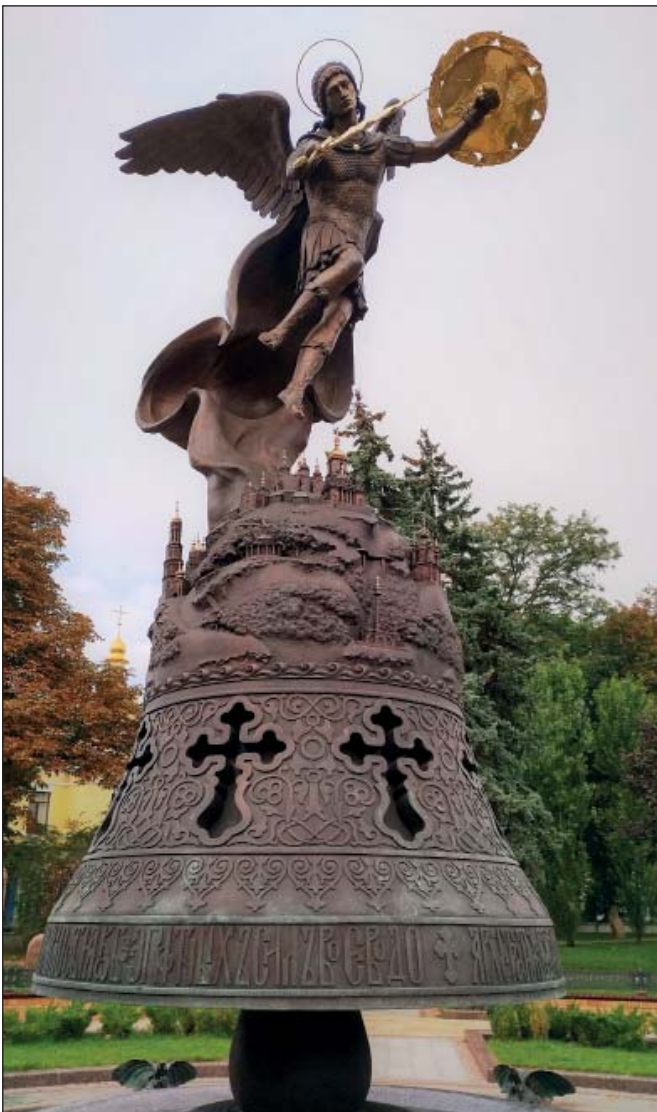
Скульптура Архистратига Михаїла на фонтані. Володимирська гірка, м Київ

А поруч із найзначнішим київським храмом – Михайлівським Золотоверхим собором, збудованим на честь Небесного Воеводи – можна побачити скульптуру Архистратига Михаїла, що створена в єдиному ансамблі з фонтаном в парку на Володимирській гірці. Небесний Посланець зображений в польоті: він як блискавка, освітлює нашу землю на коротку мить. Архистратиг Михаїл вдягнений в давньоруську кольчугу, на плечах – довгий плащ, що ефектно розвивається по вітру. В руках він тримає палаючий вогняний меч та золотий щит, оточений по колу крилами серафимів. Його прекрасне молоде обличчя – безпристрасне, сповнене великою силою виконання волі Божої. Постановка фігури викликає у глядачів враження, що Архистратиг Михаїл дійсно належить тільки небу. Вся скульптура цілком знаходиться у повітряному просторі, її вага тримається тільки на плащі, що звисає долу і торкається постаменту. Основою всієї композиції став великий дзвін, що символізує київську землю, освячену прадавніми обітелями. На дзвоні – барельєфні силуети Києво-Печерської лаври, Михайлівського Золотоверхого монастиря, Софіївського собору, Андріївської церкви та інших святинь. Нижче на дзвоні є підпис церковнослов'янською мовою: «Архистратиже Божий, служителю Божественної слави, Ангелов начальниче і человек наставниче, полезное нам испроси і великую милость Господню, яко Небесних Сил Архистратиже».