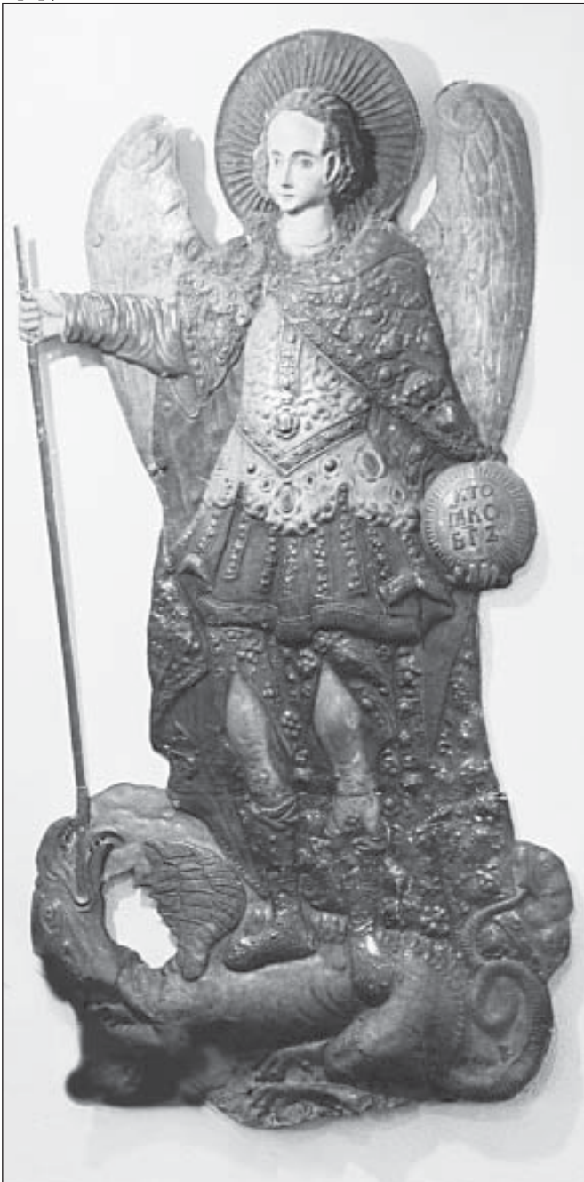
Барельєф Архистратиг Михаїл з башти з годинником – до реставрації та покриття позолотою

Композиція з Архистратигом Михаїлом, який прони-зав списом пащу червоного дракона (змія), була створена у 1697 році. Вона має 2,6 м заввишки і зроблена із двох скле-паних разом мідних щитів, позолочених зверху. [ІЛЮСТР №18] Майстер зробив шедевральний витвір, що заслуговує на щире захоплення: Архистратиг одягнутий у розкішні шати із вишуканим візерунком з квітами, що характерно для українського бароко XVII–XVIII ст. У правій руці він тримає довгий спис, яким приборкав нечистого, у лівій – сферу із написом «хто яко Богъ».