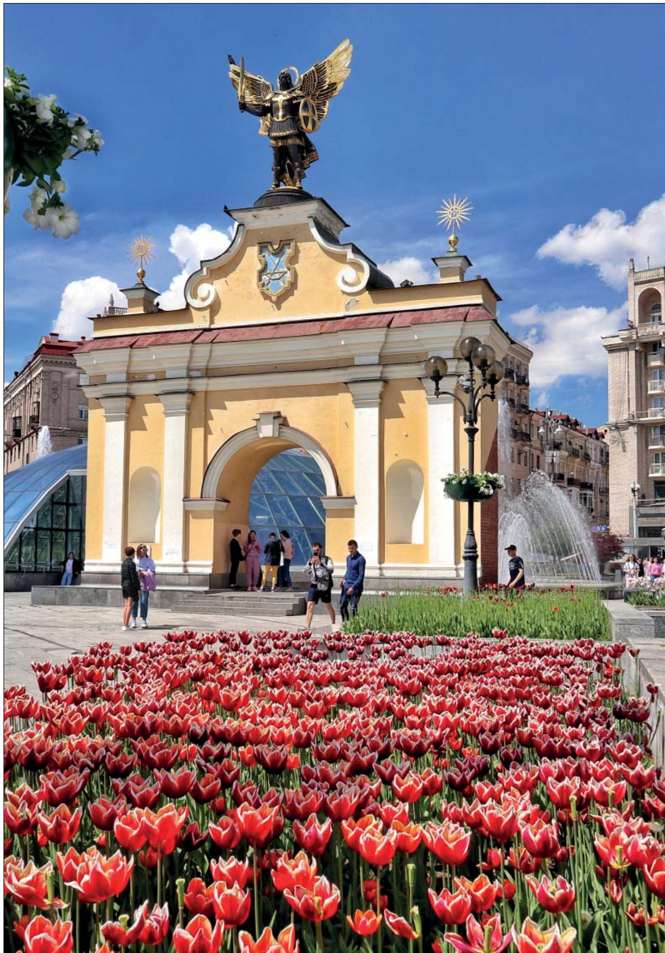
Лядські ворота з Архистратигом Михаїлом на Майдані Незалежності