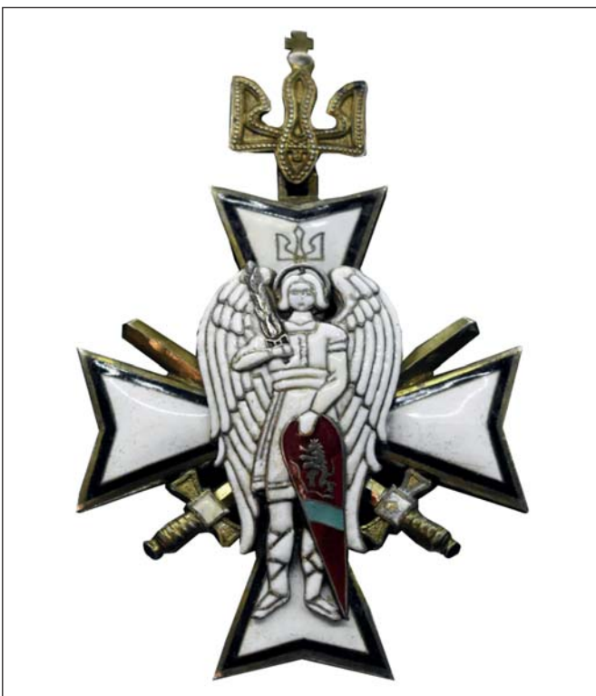
Орден Архангела Михаїла (орден Базар)