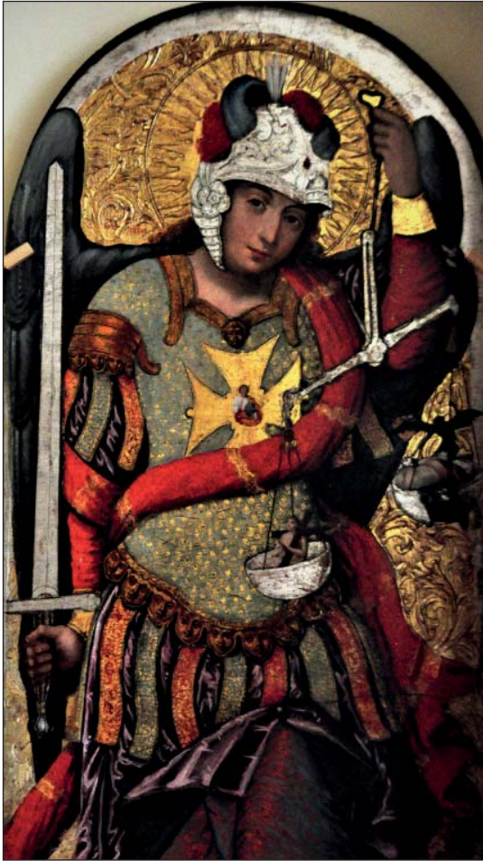
Іван Руткович Архистратиг Михаїл з Жовківського іконостасу (Нац.музей у Львові ім. А.Шептицького)