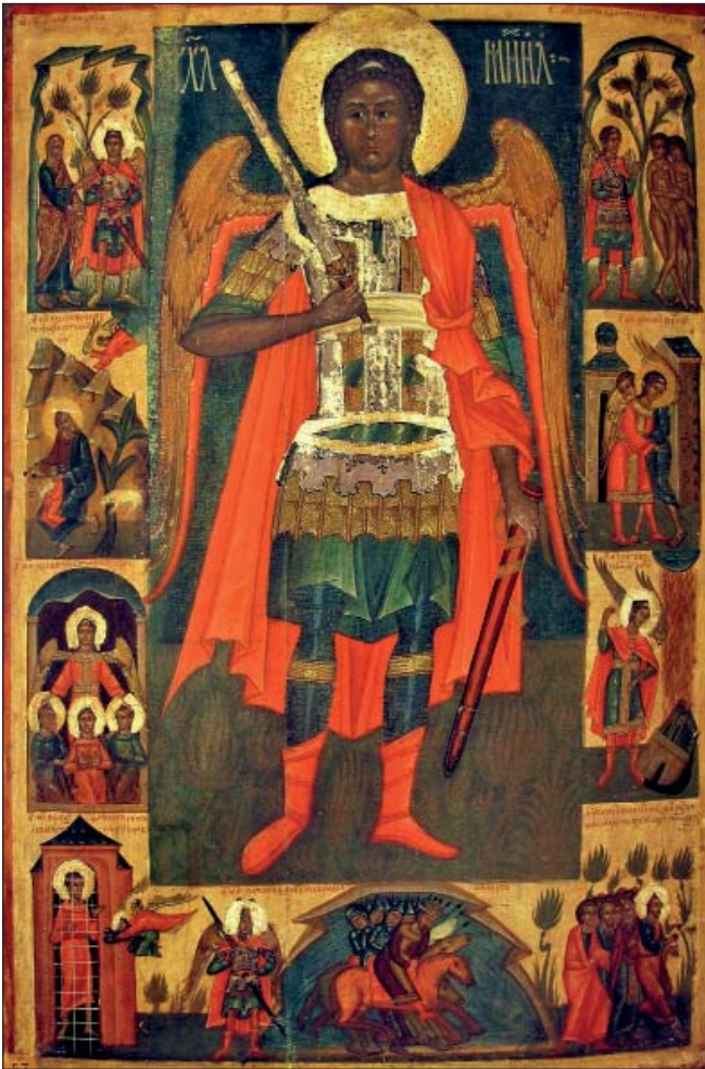
Ікона Архистратиг Михаїл з діяннями поч. XVI ст. с. Дальова (з Нац. музею у Львові ім. А. Шептицького)

Архистратиг Михаїл підтримує всіх, хто шукає свій шлях до Бога, захищає від надмірних спокус, видимих та невидимих ворогів і різноманітних небезпек. З давніх-давен наші пращури поклонялися йому як сильному захиснику воїнів у битвах. Втім слов'янське вшанування Небесного Воеводи продовжує східну традицію, адже він був покровителем візантійських імператорів-полководців. Після хрещення Русі Архистратиг Михаїл став патроном князів та дружинників. Археологи знаходять його зображення на персях, печатках, оберегах та емалевих пластинах, що прикрашали княжі шоломи. Звісно, ці зображення ще не були гербами, але «поширення культу Архистратига Михаїла в Київській Русі до монгольського нашестя й отісля вплинуло згодом на появу цього образу в українській геральдичній традиції» [9].