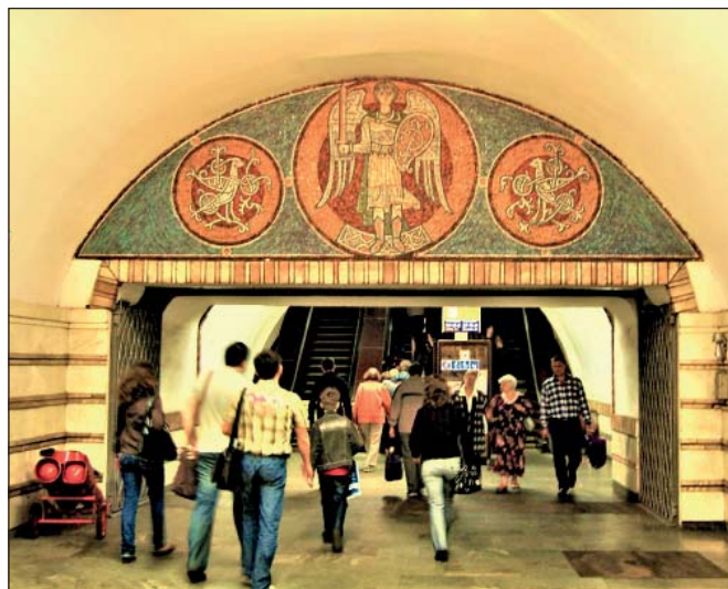
Мозаїка Архистратиг Михаїл, ст. метро Золоті Ворота