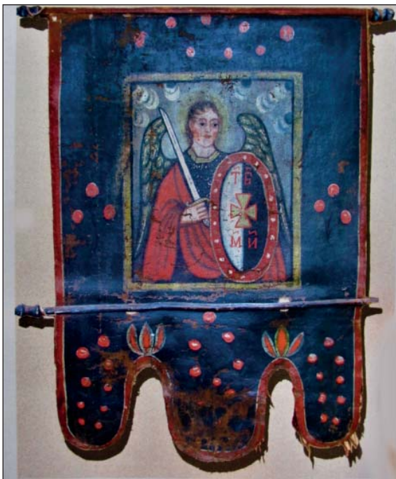
Архистратиг Михаїл – хоругва XVIII ст.

Під час хресної ходи зображення Архистратига Михаїла можна зустріти не тільки на процесійних іконах, але й на хоругвах – знаменах із вишитими іконами. Хоругва кріпиться на держаку, має прямокутну форму, по краях прикрашена бахромою, а нагорі увінчана хрестом. Традиційний матеріал – тканина, але інколи майстри використовували метал чи дерево. У XVII–XVIII ст. існували церковні, військові, магістратські, цехові хоругви. Найчастіше на них зображали Ісуса Христа і Богородицю, а також Архистратига Михаїла, Св. Миколая, Св. Юрія (Георгія), Св. Дмитра. Як зазначає дослідниця Роксолана Косів , «на відміну від ікони, хоругва відзначається ансамблевістю та поєднанням різних за характером елементів композиції, що за структурою знаходить аналогії з храмовими тканинами: покрывами або пеленами» [24]. Священники виносили хоругви із урочистими співами під час хресного ходу, в інший час вони зберігалися біля вівтаря у храмі.