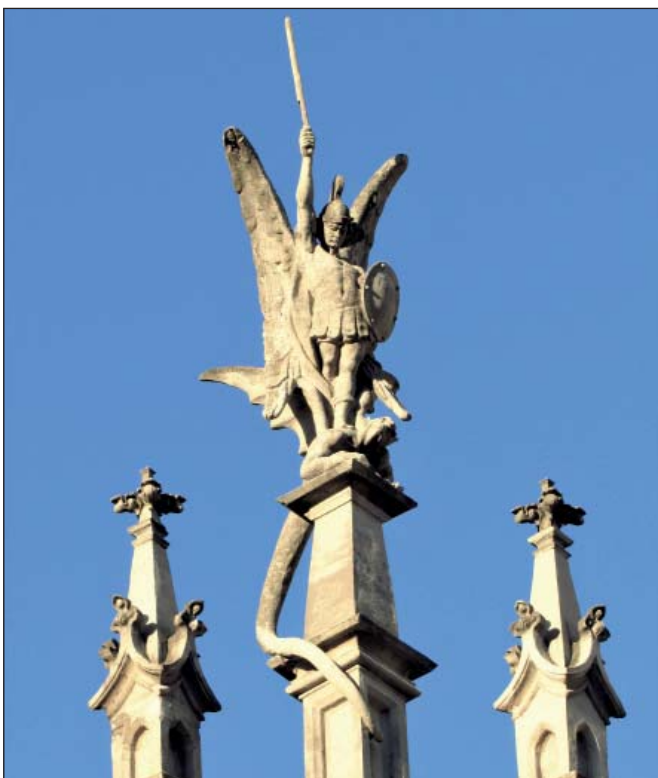
Архистратиг Михаїл над костелом Св.Миколая

Святий Переможець темних і лукавих духів увінчав католицький костел Св. Миколая на вул. Великій Васильківській. Будівля костелу була збудована протягом 1899–1909 років у неоготичному стилі архітектором Владиславом Городецьким [41] за проектом Сергія Валовського та меценатської підтримки графа Владислава Браницького . Архистратиг Михаїл зображений з розкритими крилами та шоломом на голові; в руці він тримає переможно піднятий догори довгий меч, а ногами топче поверженого диявола з крилами дракона та хвостом, що звисає донизу.