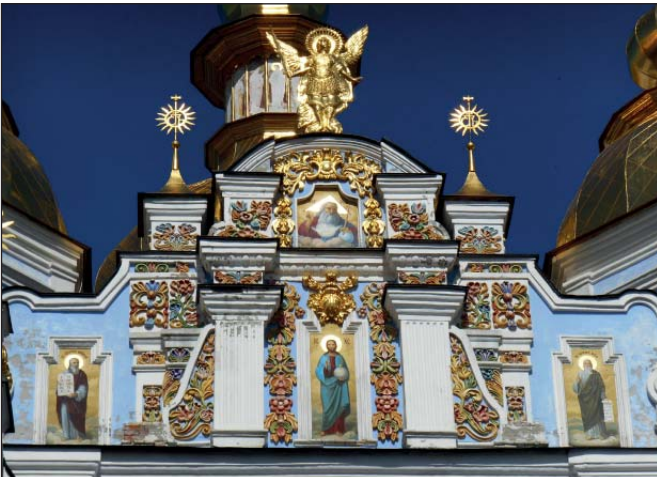
Барельєф Архистратиг Михаїл на фасаді Михайлівського собору

Після відродження собору, сучасні християни отримали можливість молитися в обітелі Небесного захисника Києва. На фасаді та в інтер'єрі храму, відбудовано архітектором Юрієм Лосицьким у 1997–1998 р., можна побачити близько 20 різноманітних зображень Архистратига Михаїла. Над входом до храму ми бачимо позолочений барельєф «Шестокрилатого Першого князя, воеводи Небесних Сил, херувимів і серафимів». Це точна копія [17] оригінального барельєфу XVIII ст., що тепер став експонатом музею історії Михайлівського Золотоверхого монастиря, але з однією неточністю: на сучасному барельєфі в лівій руці Архистратига немає щита.