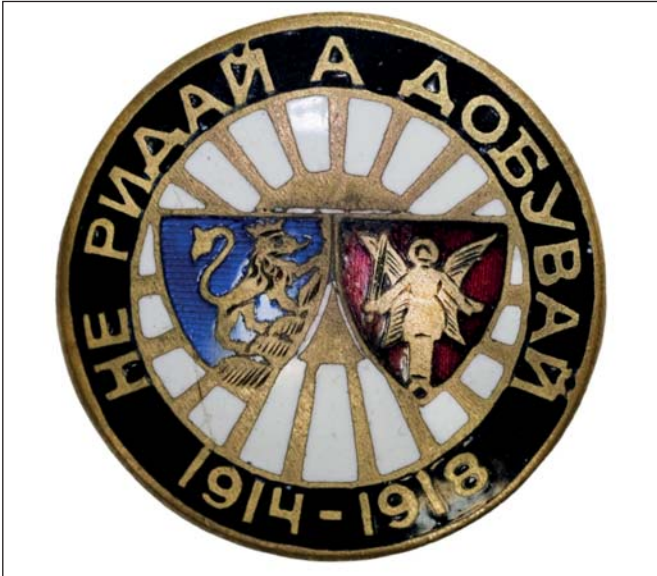
Пам'ятна відзнака Українських січових стрільців (Не ридай, а здобувай)

Воевода Небесного Воїнства прикрасив військовою нагороду, відому серед колекціонерів під назвою «орден Базар». Він належить до нелегітимних нагород УНР в еміграції, був заснований у листопаді 1941 р. Ця відзнака призначена вшануванню героїв Другого Зимового походу («Листопадового рейду») і вояків армії УНР, які були взяті в полон та розстріляні чекістами біля містечка Базар на Волині. Орден виготовила фірма «Karnet&Kyselі» у м. Празі в період від 1941 до 1945 р. [29].