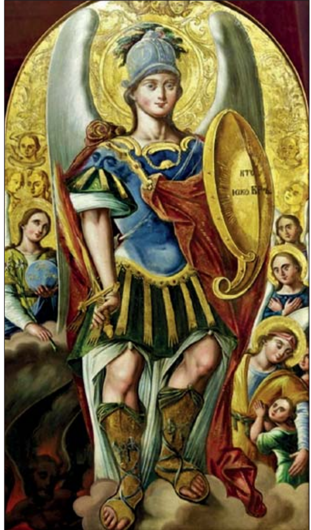
Храмова ікона Михайлівського Златоверхого Собору

хаїла, який перемагає та заковує у важкий ланцюг сатану. На іншій іконі він очолює Собор Небесних Сил, а зверху всіх благословляє Бог Саваоф. Окремо від головного іконостаса стоїть велика храмова ікона з Архистратигом Михаїлом, попираючим диявола у пеклі, а поруч з ним бачимо Архангела Гавриїла з лілією в руці, та Ангела-Охоронця з маленькою фігуркою людини, яку він опікає. Цей шедевр в стилі бароко, що вірогідно був намальований у XVIII ст., собор отримав в дар від родини Грициняків зі Львівщини у 2012 році.