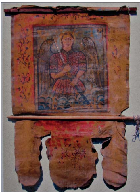
Архистратиг Михаїл – хоругва, друга частина XVIII ст.

Цікаво, що на військових хоругвах найчастіше зустрічаються образи Святих воїнів, в першу чергу – Архистратига Небесних Сил. Його зображували у військових обладунках з палаючим мечем, найпоширенішим був сюжет Перемоги над дияволом. Вражаючий приклад української військової хоругви – морський прапор Війська Запорізького. У центрі на червоному тлі бачимо корабель із запорожцями; нагорі ліворуч – Архистратига Михаїла з мечем, а нагорі праворуч – Бога, Який благословляє сміливих вояк [25]. Хоругва має на полотні такий напис: «Сіє Знамя Ввойско Єа Императорскаго Іелиества Запорожское Низовое здѣлано кошто пѣхоти воюющеи тогожъ Войска по ЧерноМорю такожъ по рѣкѣ Днѣпру ѣ Дунаю» («Цей прапор Війська Її Імператорської Величності Запорозького Низового зроблено коштом піхоти того ж Війська, що воює по Чорному морю, а також по річках Дніпру й Дунаю»).