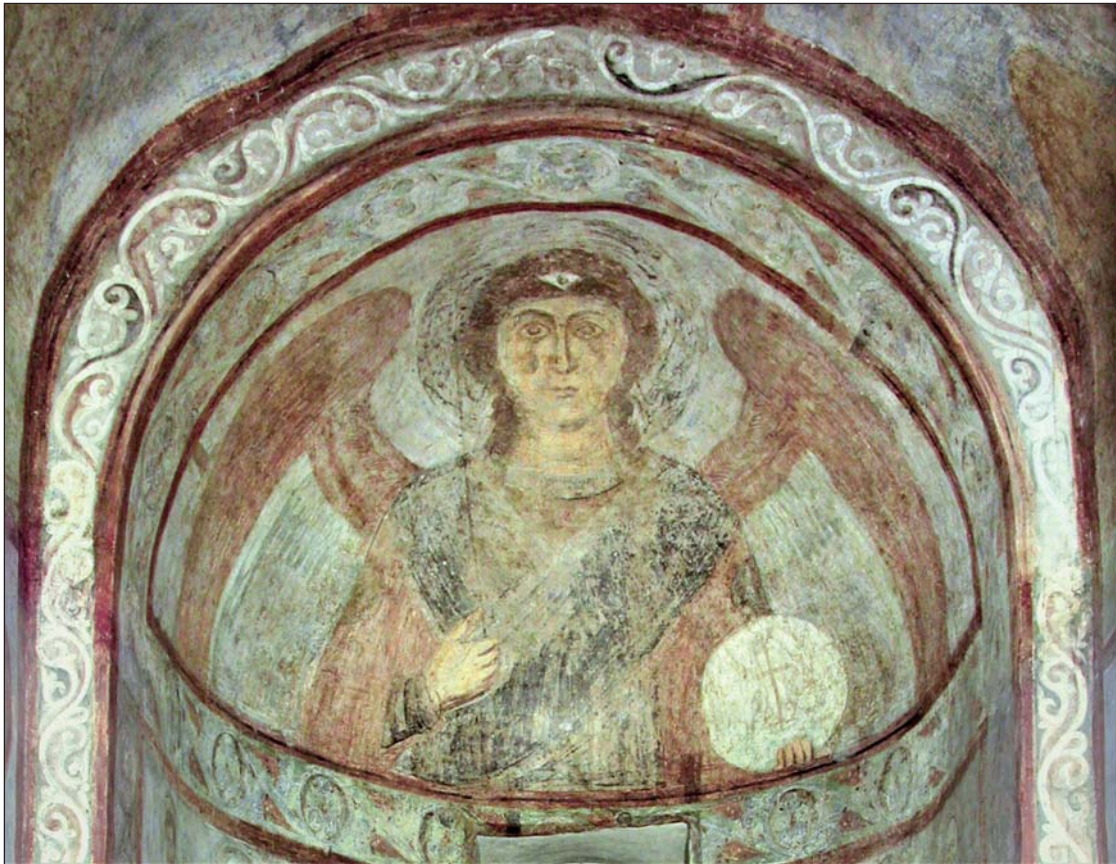
Архистратиг Михаїл, фреска у Михайлівському вітарі Софійського собору (XI ст.)