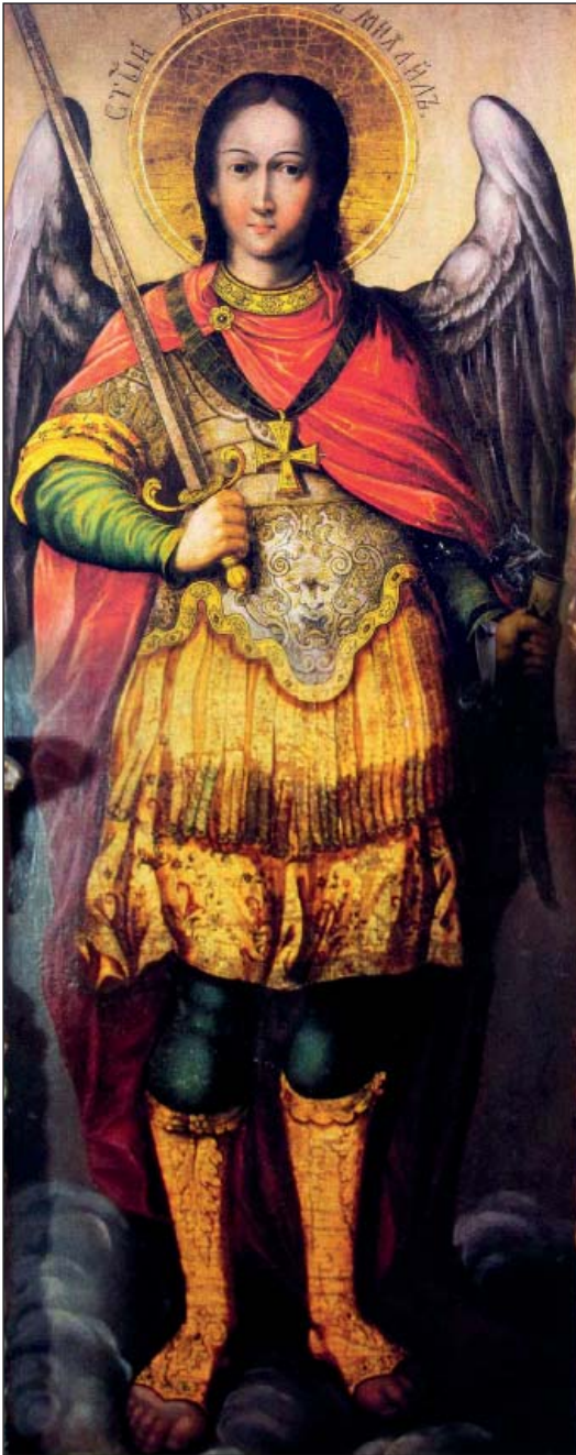
Архистратиг Михаїл з іконостасу Трійської Надбрамної церкви 1701–1731 р.

На іконостасах постать Архангела Михаїла традиційно малюється ліворуч від Царських врат – на дияконських дверях, а праворуч зазвичай зображується Архангел Гавриїл. Згадаймо широко відомий образ на дияконських дверях іконостасу Надбрамної церкви Святої Трійці Києво-Печерської Лаври, намальований майстрами київської іконописної школи в стилі бароко.