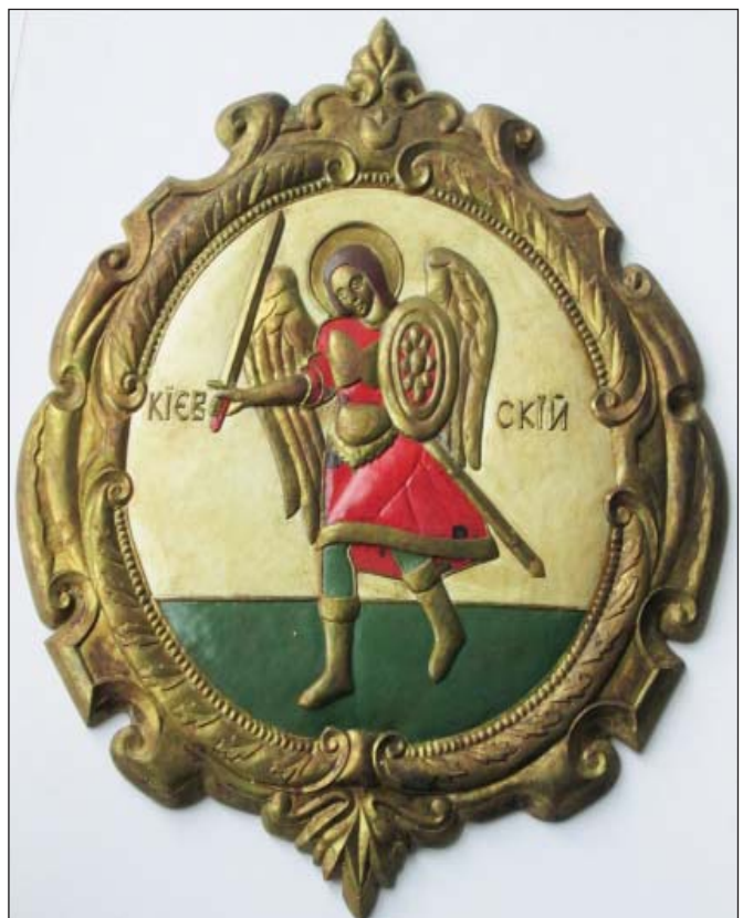
Герб Київської землі з Царського титулярника 1672 р.

Втім саме історія столичного герба заслуговує на першочергову увагу, тому що від давньоруських часів до сьогодні дуже тісно пов'язана з нашою історією. Дослідники Києва пишуть, що першу згадку про герб Києва з Архистратигом Михаїлом було знайдено у гербовнику Конрада Грюненберга , виданого в 1480 році. Київське князівство (в складі Польсько-Литовського) мало герб із Архистратигом Михаїлом, але починаючи від 1500 р. існував ще один варіант, так званий «куша», із зображенням руки, котра натягує тятиву на арбалеті. Як свідчать джерела, герб Києва із Архистратигом Михаїлом «в срібному одязі та з вогненным мечем на блакитному тлі» був затверджений за наказом імператриці Катерини II в 1782 р. За часів Речі Посполитої герб Київського воєводства мав вигляд «червоного щита із зображенням срібного ангела з опущеним мечем і піхвами», його зображували поряд з польським орлом та литовським вершником. За часів козацької держави герб із Архистратигом Михаїлом завжди зображували поряд із родовим гербом кожного гетьмана.