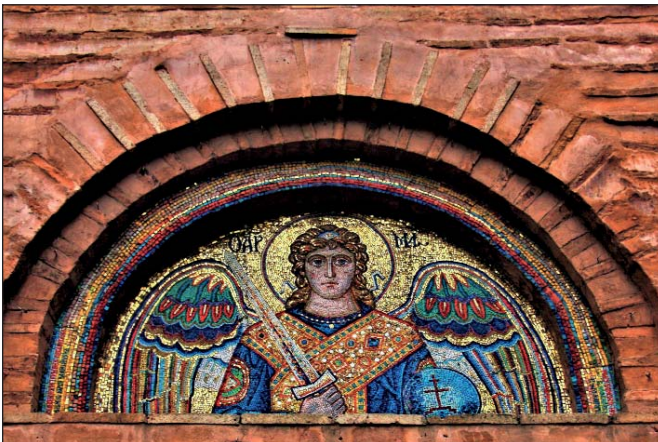
Мозаїка на фасаді Михайлівського собору Видубицького монастиря

Сучасний Михайлівський храм Видубицького монастиря – це кубоподібна споруда, увінчана одним куполом барокової форми. На фасаді та західній частині можна побачити спеціально відкриту для огляду давньоруську кладку з каміння і плінфи, а вся східна частина храму – отинькована. Фасад прикрашений великою мозаїчною іконою над центральним входом, де зображений одягнений в далматик та лор Архистратиг Михаїл, який тримає в руках меч та сферу з хрестом. Вражаюча різнокольорова мозаїка справляє враження, що Архистратиг Михаїл особисто зустрічає всіх відвідувачів собору, щоби спрямувати на вірний шлях.