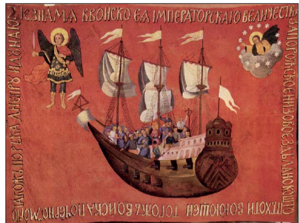
Козацький морський стяг

Цікаво, що на військових хоругвах найчастіше зустрічаються образи Святих воїнів, в першу чергу – Архистратига Небесних Сил. Його зображували у військових обладунках з палаючим мечем, найпоширенішим був сюжет Перемоги над дияволом. Вражаючий приклад української військової хоругви – морський прапор Війська Запорізького. У центрі на червоному тлі бачимо корабель із запорожцями; нагорі ліворуч – Архистратига Михаїла з мечем, а нагорі праворуч – Бога, Який благословляє сміливих вояк [25]. Хоругва має на полотні такий напис: «Сіє Знамя Ввойско Єа Императорскаго Іелиества Запорожское Низовое здѣлано кошто пѣхоти воюющеи тогожъ Войска по ЧерноМорю такожъ по рѣкѣ Днѣпру ѣ Дунаю» («Цей прапор Війська Її Імператорської Величності Запорозького Низового зроблено коштом піхоти того ж Війська, що воює по Чорному морю, а також по річках Дніпру й Дунаю»).