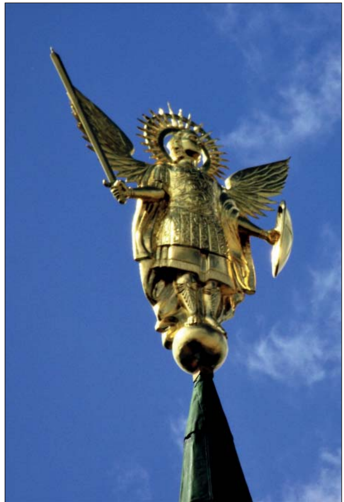
Архистратиг Михаїл. Барельєф на Економічній брамі Софійського заповідника

З давніх-давен місто Київ прикрашалося різноманітними зображеннями свого Небесного Покровителя. Наше прагнення відновити давні традиції призвело до повернення багатьох релігійних символів, що освящали столицю у дорадянський період. До них належить і барельєф Архистратига Михаїла, який раніше прикрашав шпиль Економічної (Південної) брами Софійського монастиря, але за часи безбожної влади у 1930-х рр. був скинутий зі шпиль та розтрощений. На своє місце Покровитель Києва повернувся лише у 2010 році. Відтоді сяюча золотом крилата постать Архистратига Михаїла з мечем та щитом захищає нас з висоти брами над проїздом до Софійського заповідника з боку вул. Володимирської. Цей барельєф у 1,7 м заввишки зроблений з міді та позолочений. Небесний Захисник із широко розкинутими крилами одягнутий у розкішні шати з вишуканим бароковим візерунком, на грудях зображений знак хреста. У руках він тримає меч та щит; німб над головою має подвійне коло, з середини якого виходять промені світла.