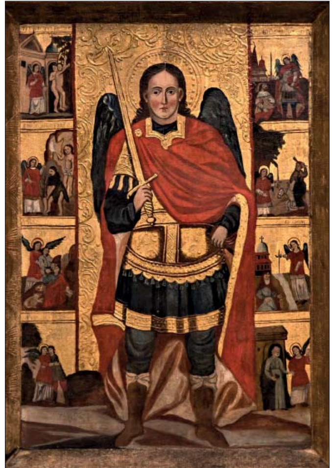
Собор Архистратига Михаїла (поч. XVIII ст.)

У храмах, присвячених Архистратигу Михаїлу, є багато ікон, що призначені прославити Небесного Воеводу. У першу чергу – це «храмовий образ» в намісному ряді іконостасу, праворуч від ікони Христа-Вседержителя. Ікони із «клеймами» оспівують відомі із Святого Писання діяння Архистратига Михаїла. Серед цих композицій можна побачити: «Вигнання з Раю», «Знищення Содому», «Поєдинок із Яковом», «Явління Ісусу Навину перед Єрихоном», «Порятунок трьох отроків», «Архангел Михаїл приносить із Авакумом їжу Даниїлу у рові з левами», «Чудо в Хонах» та інші. У храмах також присутні ікони Небесних Сил Безтілесних, зокрема композиції «Собор Архистратига Михаїла» та «Архангели Михаїл і Гавриїл».