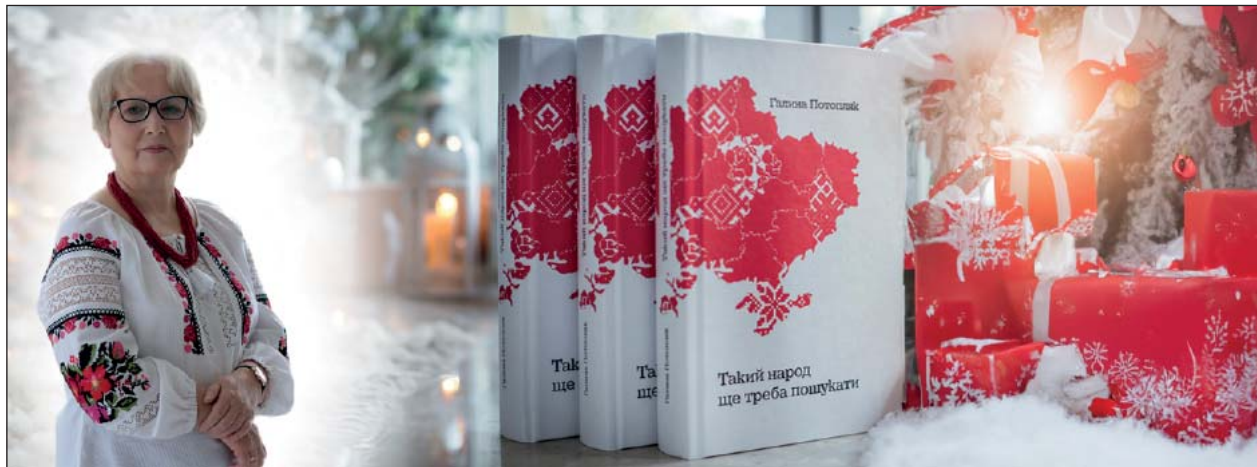
Галина Потопляк, українська поетеса