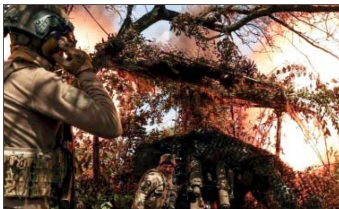
Авдіївка. 23 жовтня 2023 р.

Коли закінчиться війна, Я розцілюю всі ікони. Присяду в хаті край вікна І буду чути церковні дзвони. І буду гладити лице. Сльоза покотиться — піймаю. І кожен клаптик чебрецем В душі своїй повистеляю. І я наплачусь досхочу. Сльозами вмию всі могили. Зварю відвар із перстачу І вип'ю келишок для сили. І вип'ю другий, щоб від ран Не залишилося і сліду. Наллю наливки повний збан І понесу її сусіду Ми будемо удвох мовчати. Хміліти разом й тверезити. Ми будем пошепки кричати І в небо кидать жовті квіти. І сині айстри розцвітуть На полі битви під Херсоном. Червоні маки проростуть Під Києвом над збитим дроном. Коли закінчиться... Коли... Усі говорять, що нескоро. Але готую я столи І промовляю — скоро, скоро. Ще день, ще ніч. Та й ще зима. А там весна і перші грози. Коли закінчиться війна Я вам нарву букет мімози!!! ■