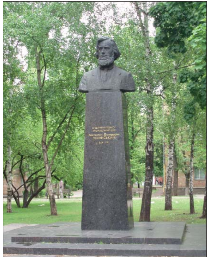
Пам'ятник Костянтину Ушинському в сквері Ушинського на Солом'янці в Києві. Відкрито в 1974 р. Скульптор О. Скобліков, архітектор А. Ігнащенко.

Настав час повернути ім'я, продуктивні ідеї, оригінальні праці Костянтина Дмитровича Ушинського – великого українського педагога. Його унікальна педагогічна спадщина, яка увійшла до золотого фонду європейської та світової педагогічної літератури, є національною гордістю України. ■