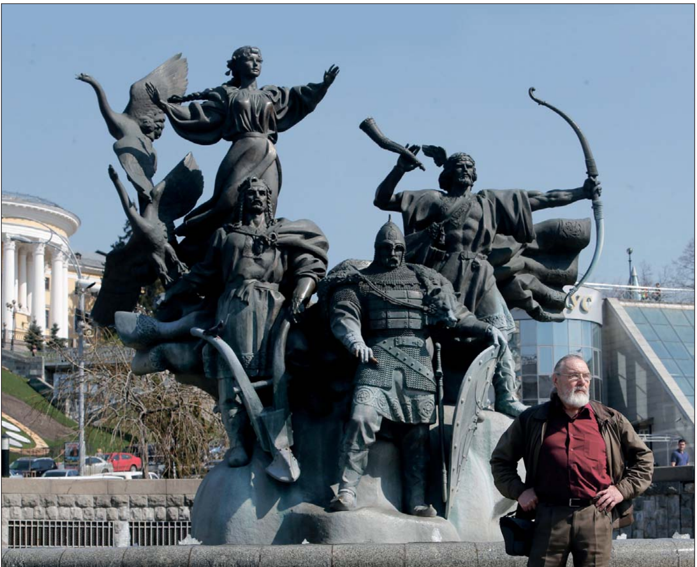
Скульптурна група «Засновники Києва» на Майдані Незалежності та її автор – Анатолій Кущ

Пам'ятники та пам'ятні знаки Тарасу Шевченку , що стало втіленням скульптурної Шевченкіани А. Куща, над якою він працює все життя і це представлено на світлинах в альбомі, як існуючих монументів, так і, на жаль, не втілених.