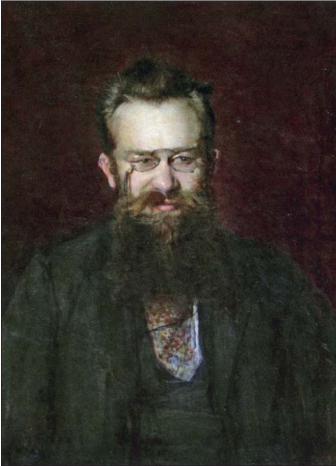
Портрет професора М. Грушевського. Художник І. Труш. 1900 р.

Інша риса М. Грушевського як історика виявилася у дивовижному універсалізмі на полі соціогуманітаристики. Його студії охоплювали терени національної історії, етнології, культури, соціології й історії літератури. Тож в особах М. Грушевського й І. Франка постав дуже цікавий різновид українського інтелектуала на зламі століть – тип гуманітарія-енциклопедиста.