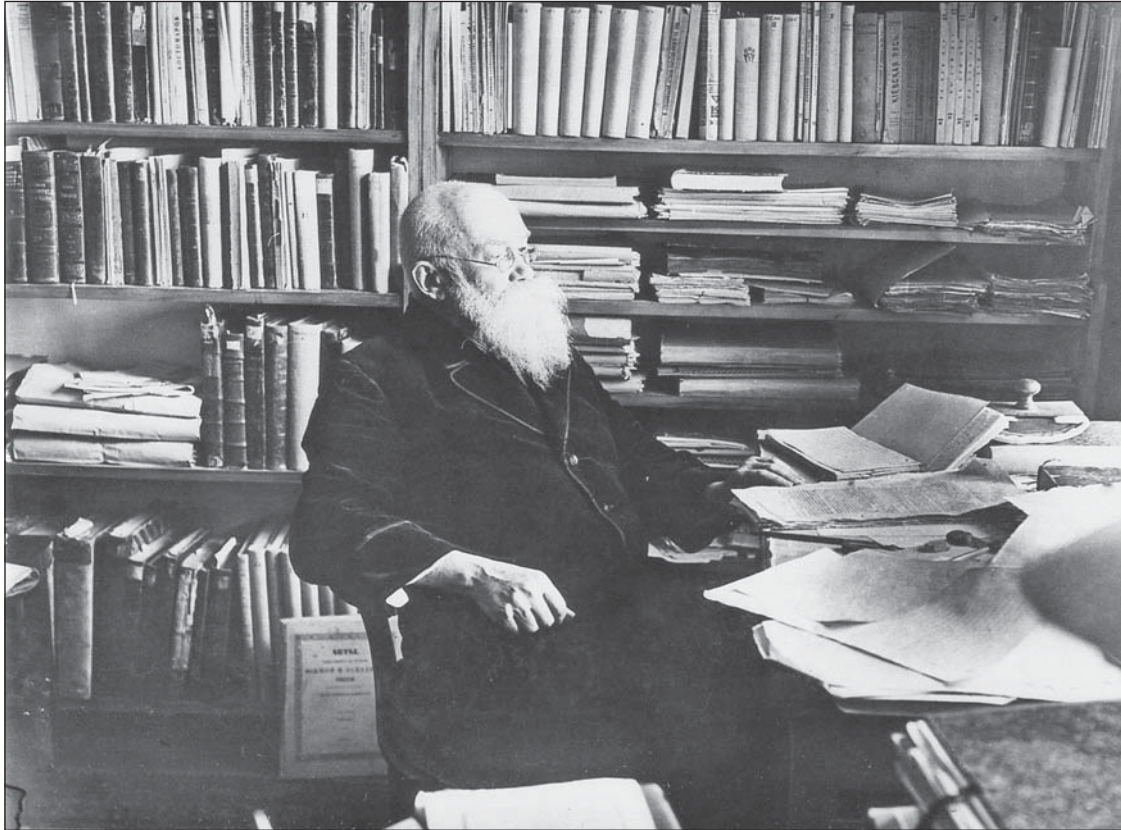
М. Грушевський у домашньому кабінеті в будинку на Паньківській, 9. Київ. Кінець 1929 р.

Михайло Грушевський хоч-не-хоч мусив дошукувати-ся нетипових відповідей.