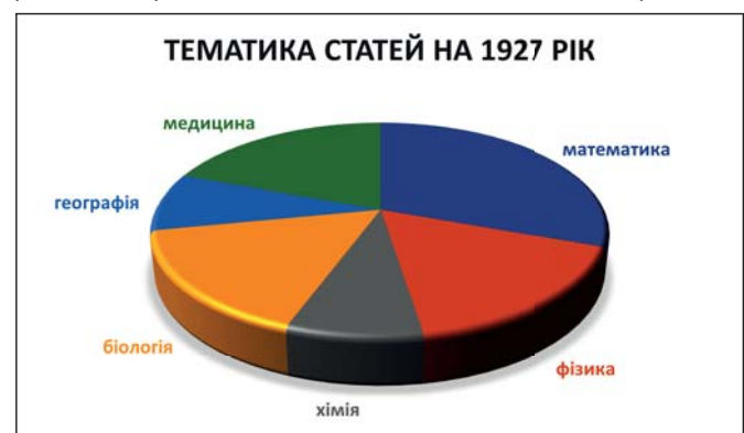
Тематика статей, опублікованих в «Збірнику Математично-природописно-лікарської секції НТШ» до 1927 року

Приблизно третину від загальної кількості складали іноземні члени МПЛ-секції, серед яких були й дуже відомі науковці. Це, зокрема, математики Фелікс Кляйн і Давид Гільберт , які фактично на той час формували фундамент розвитку всієї математичної науки в Європі. А також двоє ключових представників фізичної науки: Макс Планк і Альберт Айнштейн . Майже всіх закордонних членів було прийнято до МПЛ-секції в період від 1920 до 1930 років. Основними галузями знань, які були представлені у секції науковцями-дійсними членами НТШ, були гео-