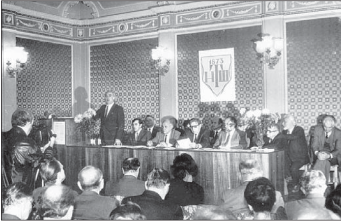
Збори з нагоди відновлення діяльності НТШ в Україні. Львів, 21 жовтня 1989 р.

цьому – статистика, згідно з якою серед директорів 144 комерційних банків, які були зареєстровані в березні 1993 р., 136 – неукраїнці. Ті ж банки, які вчений назвав «монстрами інфляції», отримали за півріччя «прибуток» у розмірі 56 відсотків від прибутку всієї промисловості України [11].