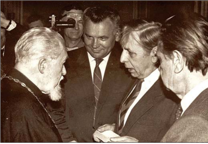
Візит кардинала М. Любачівського до відновленого НТШ у Львові. 2 травня 1991 р. Справа від кардинала науковий секретар НТШ О. Купчинський, голова НТШ О. Романів та голова Комісії шевченкознавства Т. Комаринець.