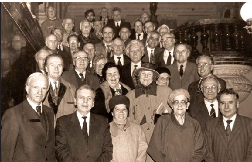
Корпус дійсних членів НТШ в Україні, 1995 р.

у Варшаві [17]. Операцію «Вісла» О. Романів розглядав як фінальний акт трагедії насильного виселення решти українців із етнічних закарпатських територій, який був реалізований за попередньо відпрацьованими сценаріями. Зазначимо, що в численних пропагандистських матеріалах ця акція представлена як вимушена відповідь на вбивство загоном УПА генерала К. Сверчевського , що сталося 27 березня 1947 року [18]. Насправді акція «Вісла» проводилася за згодою і підтримкою органів СРСР та Чехословаччини.