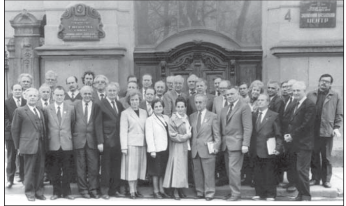
Зустріч представників НТШ в Україні з діячами діаспори під час Першої наукової сесії НТШ. Львів, 1990 р.