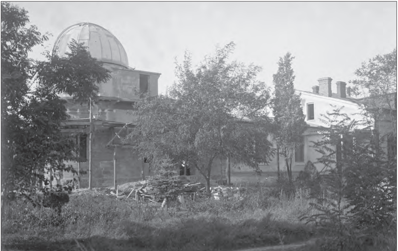
Астрономічна обсерваторія Одеського університету. З колекції історичних фотографій ( http://astro-observ-odessa0.1gb.ua/index.php?go=Smallery&id=14 )

Володимир Смирнов канд. фіз.-мат. наук, м. Одеса