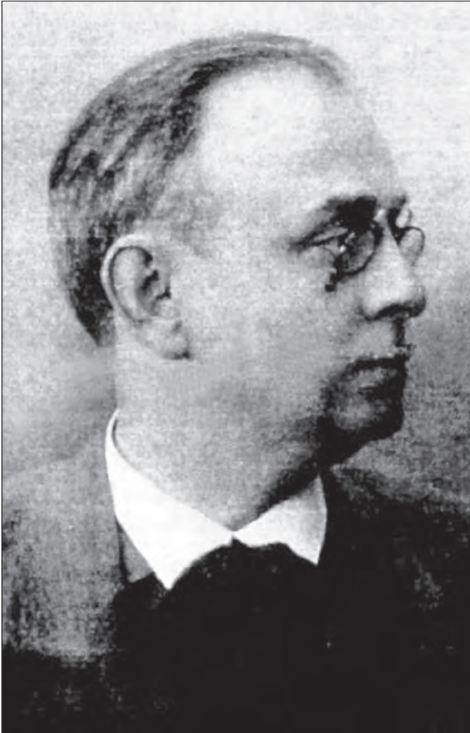
Борис Васильович Варнеке (1874 – 1944)

на порозі, не встигнувши дійти до кафедри». Або ось запис В.О. Швеця від 22 лютого 1941 р.: «Варнеке сьогодні давав цінні та рідкісні відомості, чудово характеризував епоху та творчість Островського , гру сімейства Садовських . Проте сприймати Варнеке не так легко. Це не звична водичка, яку нам пропонує марксист та інші «педагоги» Тут кожне слово – дорогоцінний камінь. І їх так багато, що відразу не вибереш найпрекрасніший з них». В.О. Швець відзначав також лекцію Б.В. Варнеке про Комісаржевську .