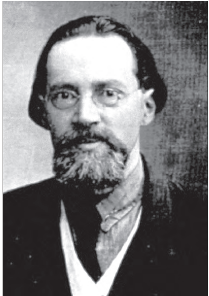
Микола Опанасович Соколов (1886 – 1953)

Під час окупації з 1 грудня 1942 року Соколова призначають директором Академії образотворчих мистецтв. Як впливає із щоденників В.О. Швеця, у приміщенні Академії влаштувалися на той час дуже змістовні виставки місцевих художників і скульпторів і там же проводився розпродаж творів мистецтва. Соколов викладав також у