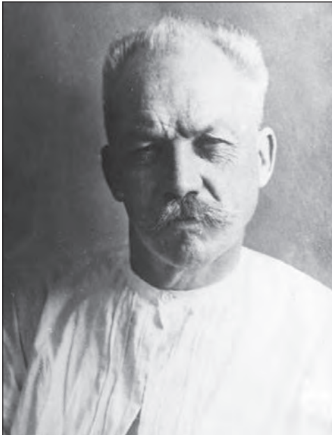
Микола Омелянович Макаренко

Розкопки Маріупольського могильника. 1930 року в Маріуполі розпочався амбітний проект — будівництво сталеливарного комплексу, який пізніше дістав назву «Азовсталь». На півострові між Азовським морем і річкою Кальміус на місці будівництва доменної печі заводський службовець археолог-аматор Г.Ф. Кравець помітив червону пляму, під якою виявилися людські кістки з незвичайним інвентарем. Він розповів про знахідку працівникам краєзнавчого музею, а ті звернулись до знаного археолога М.О. Макаренка.