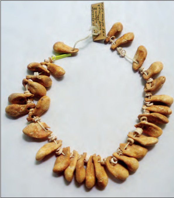
Рис. 4. Намисто з недорозвинутих ікл оленя і вапнякових намистин з могильника Вовниги, що належить до маріупольського типу

Матеріалами слугували зуби тварин, перли, мушлі, кістки, різні породи каменю. Форми намистин та привісок були вигадливими, небаченими на інших пам'ятках Європи того часу (рис. 4). Найбільш вражали прикраси, виготовлені з відшліфованих та просвердлених іклів кабана – вони декорували як дорослих, так і дітей – це, можливо, є свідченням того, що ці вироби були маркером роду. Особливий інтерес викликала статуетка тварини (напевне, бика або кабана), яку знайшли на скелеті дитини. Ймовірно, зооморфна фігурка відіграла роль «знака тварини», що вказував на персональний віртуальний зв'язок похованої дитини з означеною твариною (рис. 5) [5].