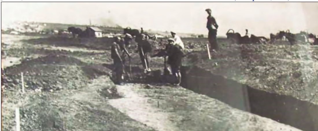
Рис. 1. Фото з розкопок Маріупольського могильника. Чітко видно темну смугу «червоної землі» — потужний шар вохри (Макаренко, 1933)

Надамо слово М. Макаренку: «Ми працювали до виснаги. Досить сказати, що роботу починали о 7 годині ранку. Робітники працювали до 3-х годин дня. Далі, як вони закінчували, весь персонал залишався на могильнику і працював до 7–8 вечора, розчищаючи кістяки. Вихідних днів не знали. Нарешті дійшло до того, що дехто з працівників буквально не витримував — падали з ніг. А прохання з адміністрації йшло за проханням — "якнайшвидше кінчайте роботу"».