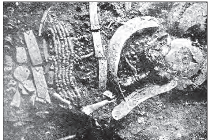
Рис. 2. Дитяче поховання, прикрашене «занадто рясно» (на думку М. Макаренка) (Макаренко, 1933)

Намисто розповідають. Результати розкопок перевершили найсміливіші мрії дослідників. Неолітичний могильник являв собою унікальне явище — небіжчики були опоряджені небаченими для свого часу кількістю і різноманіттям прикрас (рис. 2). Тому пам'ятка одразу стала сенсацією у науковому світі. За етнографічними даними прикраси є невербальним засобом передавання інформації як між членами соціуму, так і «між світами». Оздоблення поховань може бути свідченням родової та гендерної ідентифікації небіжчиків, їхнього соціального та/або сакрального статусу (рис. 3) (Михайлова, 2019).