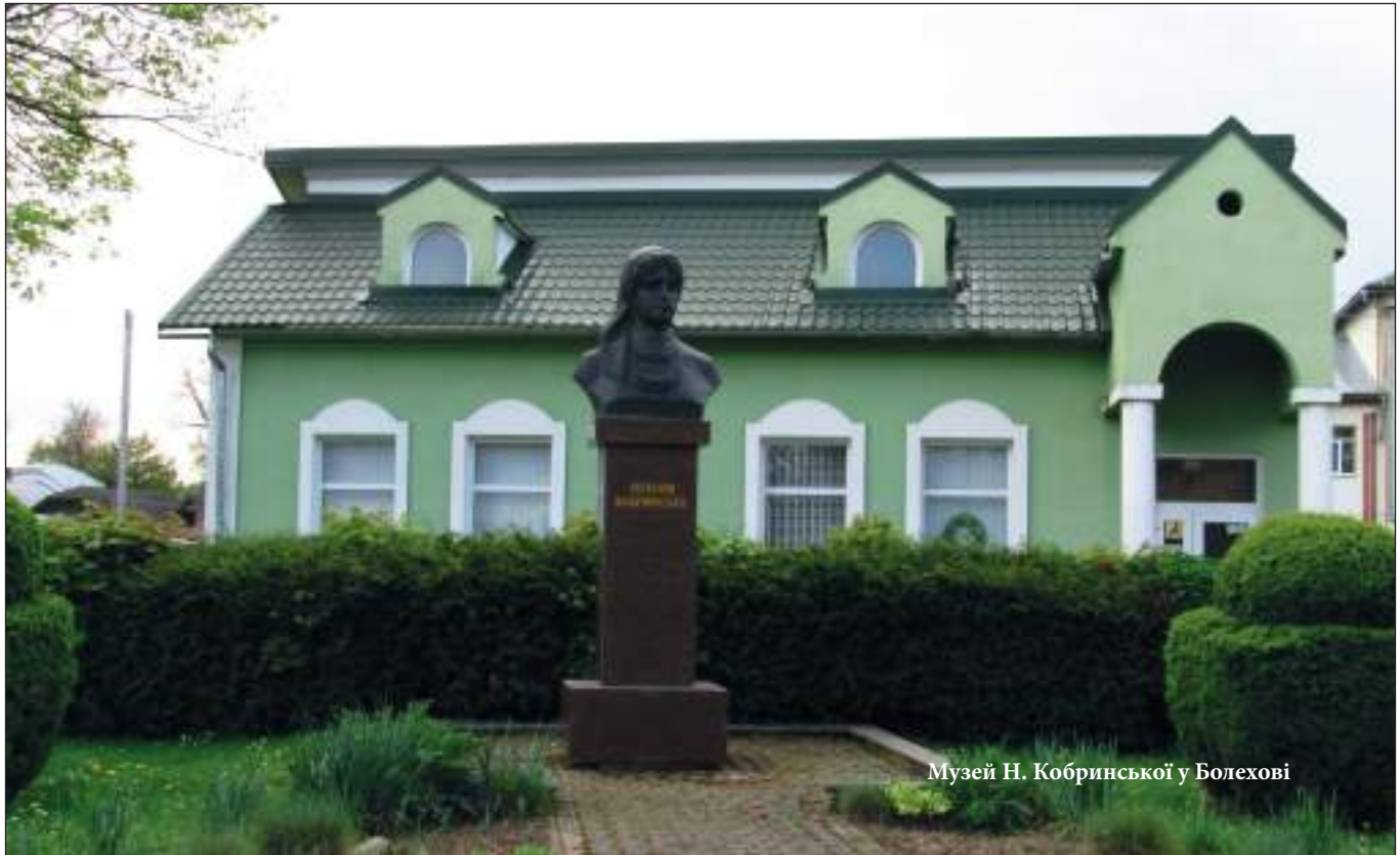
Музей Н. Кобринської у Болехові