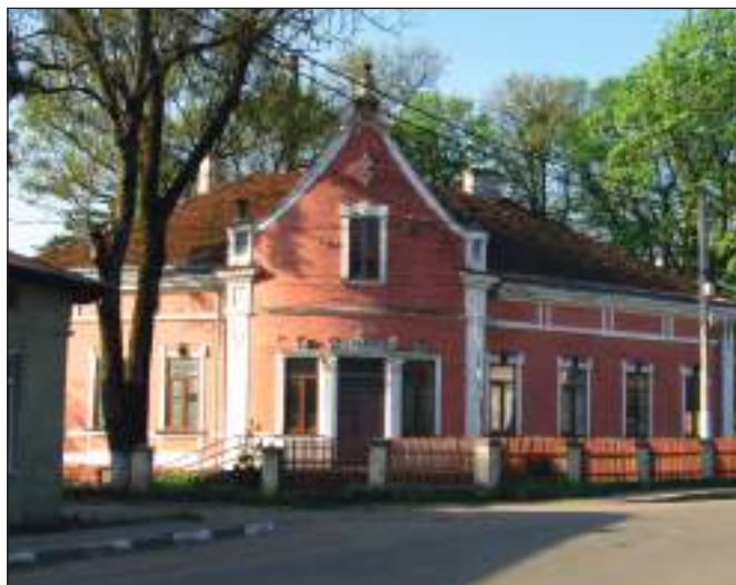
Колишня вілла Кляйнберга