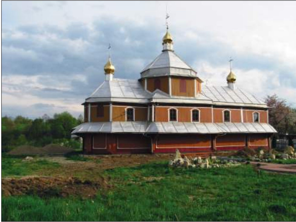
Церква святої Анни

Повертаємося на центральну вулицю Болехова. Більшість старих кам'яниць, розташованих на ній, теж офіційно пам'ятками не вважаються, хоча й цілком заслуговують ними бути. Ось, наприклад, оздоблена дерев'яним квітковим орнаментом будівля дитячої бібліотеки (Січових стрільців, 10), або ажурний дім у стилі модерн (Січових стрільців, 18). Будь-яке місто пишалось б такою красою, але чиновники від культури поки воліють їх не помічати!