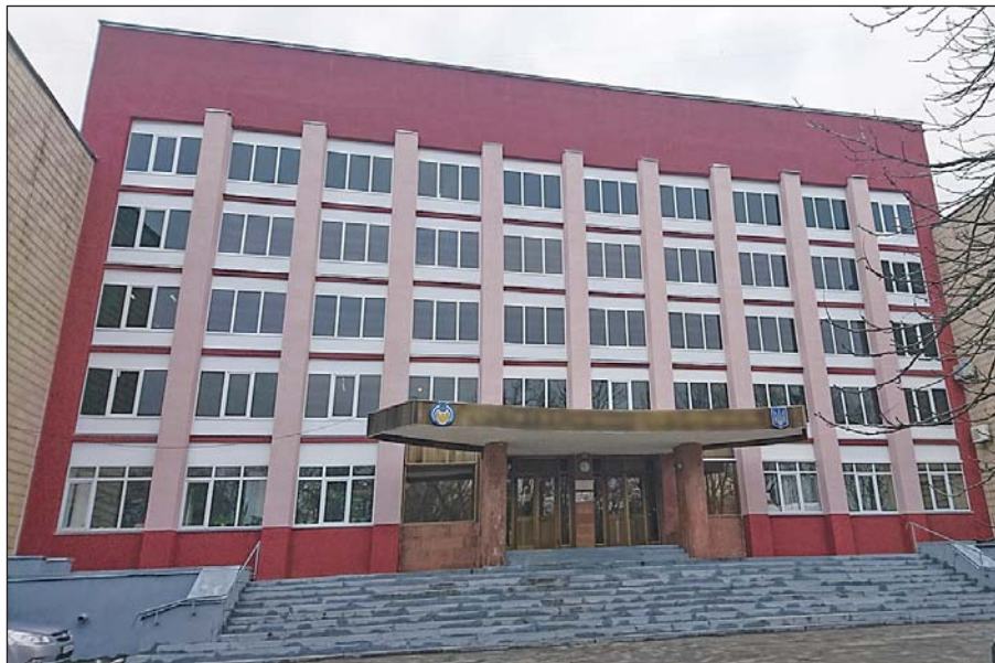
Національна наукова сільськогосподарська бібліотека Національної академії аграрних наук України

Вдалося відстояти такий собі геноцид проти українських спеціальних бібліотек. Досить детально даю картину дійства у 2009 р. не випадково. Знову десь наступаємо на ті ж «граблі», і, що ще більш образливо, незважаючи навіть на повномасштабну війну, знищуючи не те, що жевріє, а те, яке, точно знаю, здатне продукувати!!! Як на мене, ситуація взагалі виглядає жахливо. Створюється якась «ініціативна група» з трьох осіб із залученням знову чомусь представників виключно від «клубної культури». Щось «імітують», посилаючись на демократизм обговорення, але врешті-решт видають у більшості до першого читання те, заради чого все й задумувалося першочергово. Не маю бажання зупинятися на всіх недоречностях. За таких обставин взагалі навіть і не уявляю, як працює бібліотечна система європейських країн із беззмінними законами стосовно бібліотек понад сотню років, як наприклад, у Фінляндії? При цьому й престиж професії не втрачається і кількість бібліотек постійно збільшується, не як у нас, відповідно до геометричної прогресії зникаючих на фоні всіх