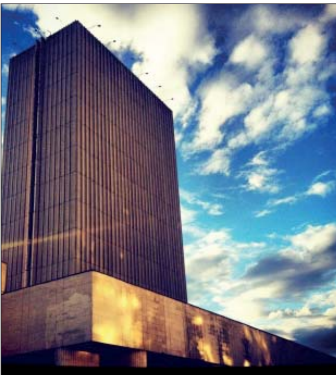
Національна бібліотека України імені В. І. Вернадського

Тому пропоную залишити в силі існуючу редакцію закону України «Про бібліотеки і бібліотечну справу» відносно поділу бібліотек щодо призначення, а саме: публічні (загальнодоступні); спеціальні (академії наук, науково-дослідних установ, навчальних закладів, підприємств, установ, організацій); спеціалізовані (для дітей, юнацтва, осіб з фізичними вадами). Крім того, потрібно додати статтю про гарантії стосовно закріплених на даний час за діючими бібліотеками в Україні будівель незалежно від поділу за значенням. Крім того, узаконити право бібліотекам, віднесеним до категорії спеціальних, займатися будь-якою передбаченою чинним законодавством науковою діяльністю на договірних умовах з відповідною реєстрацією, тим самим максимально відповідаючи документу, який регламентує права людини «Біль про права» (англ. Bill of Rights) ратифікованим Україною у 1973 році. Що ж до нової редакції закону України «Про бібліотеки і бібліотечну справу», вважаю необхідним розширити можливості його обговорення для внесення узгоджених постатейних змін або взагалі відправити його на доопрацювання. ■