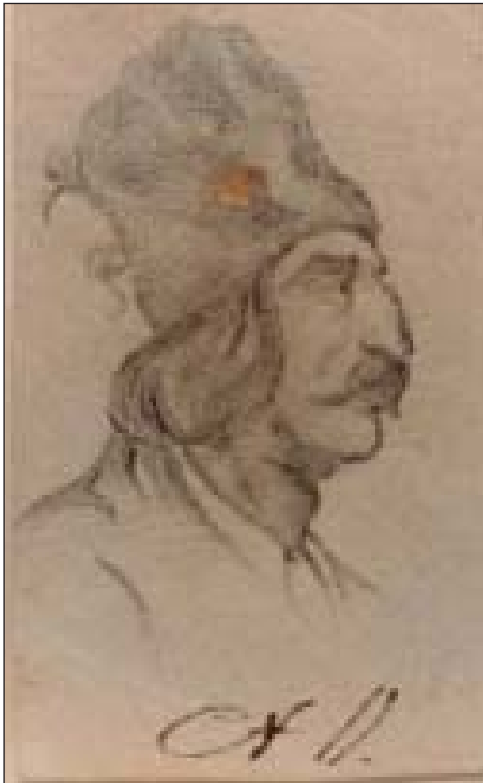
Портрет чоловіка з вусами у високій шапці

Рисунок №11 із Ткаченкової колекції – це погрудний портрет чоловіка, зверненого у профіль праворуч. Зовні зображений схожий на чоловіка, портретованого на попередньому аркуші №10 у колекції малюнків Ф. Ткаченка. Портретований на аркуші №11 темноокий, має довгий ніс із горбинкою, у високій угорській шапці, з жовнірськими чорними вусами середньої довжини, що звисають донизу, з поголеною бородою. Розкішне чорняве волосся, складене удвоє, підгорнуте попід низ, справляє враження подовженої шапки. Унизу посередині чорною тушшю – «СН 11».