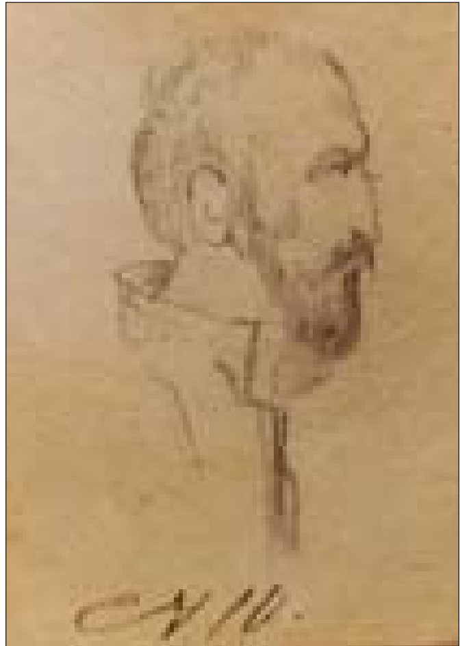
Портрет чоловіка із вусами і бородою у профіль (кавказця)

Тарас Шевченко під час другого приїзду в Україну, малюючи Києво-Печерську лавру влітку 1846, «познайомився з приїжджим сімейством богомольців, у якому була дуже гарненька молода дівчина [...]. На мальовничій дикій стежці, що вела з Царського саду на Поділ прямо через кручі, я раз побачив Тараса Григоровича у незнайомому оточенні, що складалося з двох бабусь, кількох дітей і гарненької дівчини. Остання відкинула вуаль. Розчервоніле личко її, обрамлене світлим волоссям, було чудове. [...] Дівчина ця була за когось висватана, і у вересні призначене весілля». Шевченко сказав товаришу, що проводить знайомих у Братський монастир і три дні після цього був зажурений.