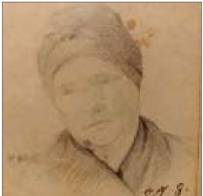
Портрет старенької (бабці)

На паперовій обгортці фіолетовим чорнилом – написи: угорі – «№8. Старушка. Рис. Т.Г. Шевченко (карандаш)». Розміри малюнка: 6,8x5,6(см); розміри обгортки: 9,9x13(см).