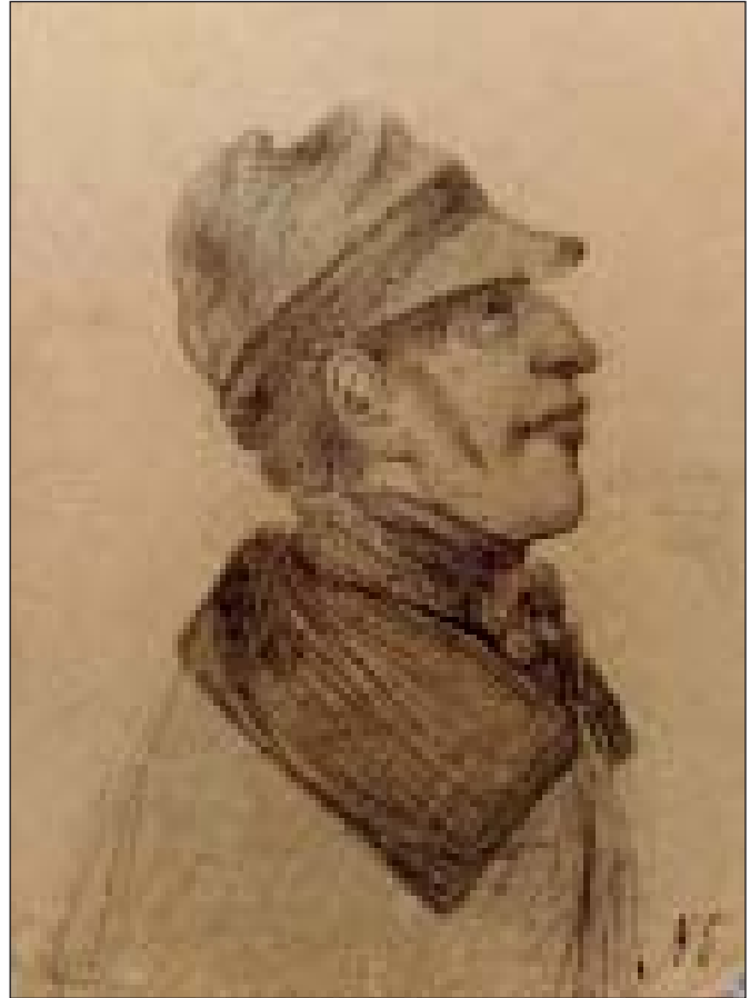
Портрет Возного. Ілюстрація до п'єси І. Котляревського «Наталка Полтавка»

Рисунок №6 із колекції Ф.Л. Ткаченка – це погрудний портрет худорлявого довгообразого юнака. Волосся коротко стрижене. Погляд спрямований вгору. Обличчя