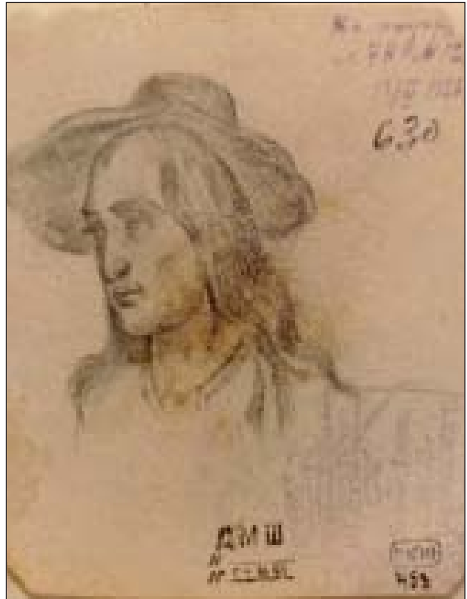
Портрет юнака в капелюсі