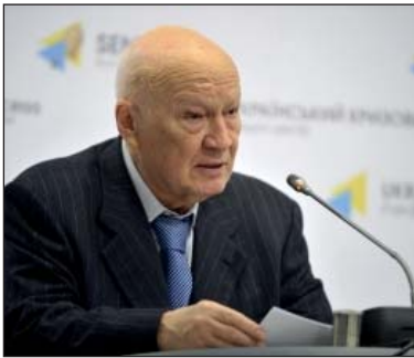
Володимир Горбулін, доктор технічних наук, академік НАН України, перший віце-президент НАН України, м. Київ