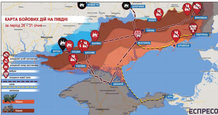
Карта бойових дій за період 26–31 січня 2023 року.

Передумови для цього є, хоча в січні 2023-го року лідерам Заходу досі бракувало політичної волі, що дозволяло Путіну грати в небезпечну гру на підвищення ставок. Хоча саме у січні 2023-го року Європарламент проголосував за резолюцію, яка закликає до створення спеціального міжнародного суду не лише щодо Путіна та російського керівництва, а й Лукашенка та керівництва Білорусі.