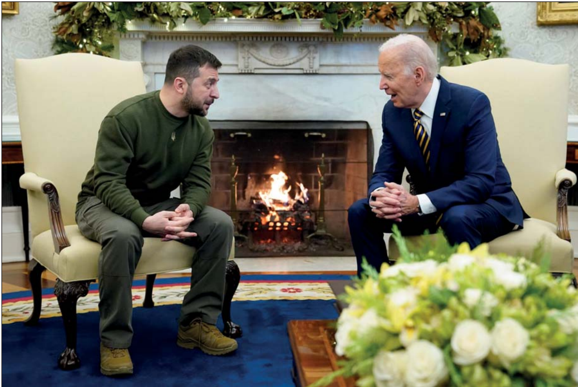
Президент України Володимир Зеленський і Президент США Джо Байден під час перемовин 21 грудня 2022 року у Білому домі. Вашингтон, США.

для подальшого виснаження Росії? І чи не є це паліативним рішенням для сучасної ситуації?