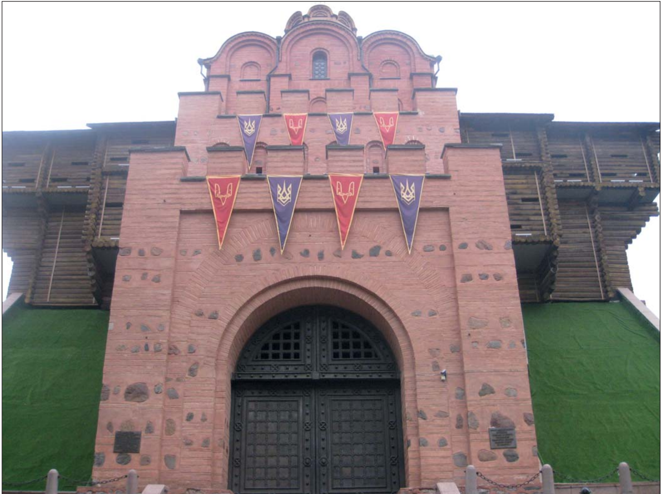
Золоті ворота – пам'ятка оборонної архітектури Київської Русі

У 20-х роках XIX ст. розпочалося археологічне дослідження руїн, а ще через 10 років у зв'язку з реконструкцією вулиць було прийнято рішення знести земляні вали, що оточували «місто Ярослава». Залишки руїн Золотих воріт відкопали та добудували до них укріплення – контрфорси. Всю територію навколо воріт відгородили чавунними ґратами за малюнками архітектора Вікентія Беретті . У 1880-х роках руїни Золотих воріт були обкладені цеглою та покриті металевим дахом.