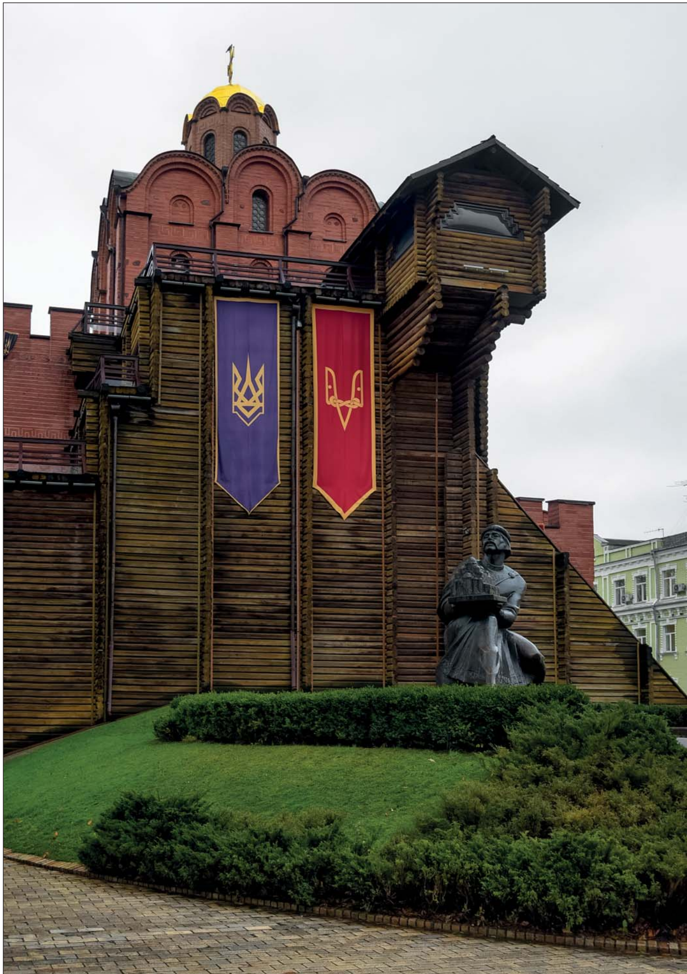
Золоті ворота (вигляд збоку) із Тризубом – знаком роду Рюриковичів (князя Володимира та князя Ярослава).