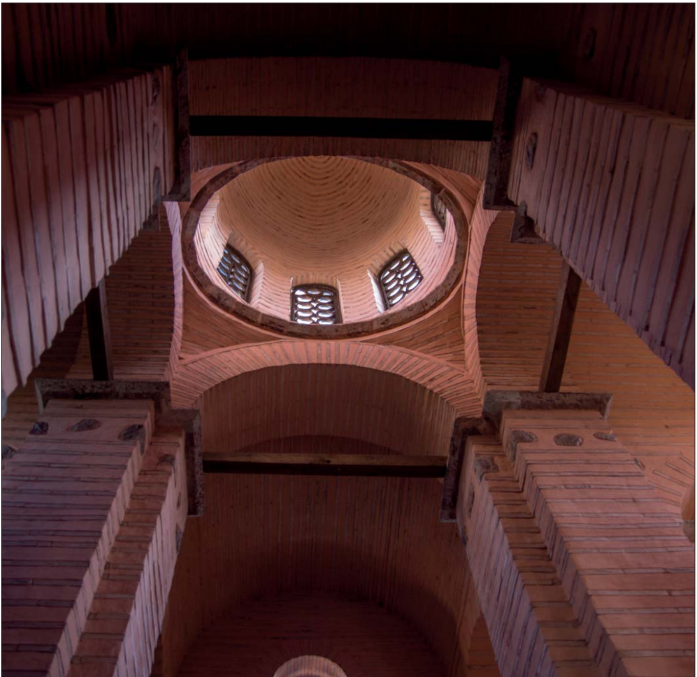
Золоті ворота. Інтер'єр церкви Благовіщення

Отже, і в майбутньому майданчик перед Золотими воротами буде місцем урочистих, важливих для української держави подій. ■