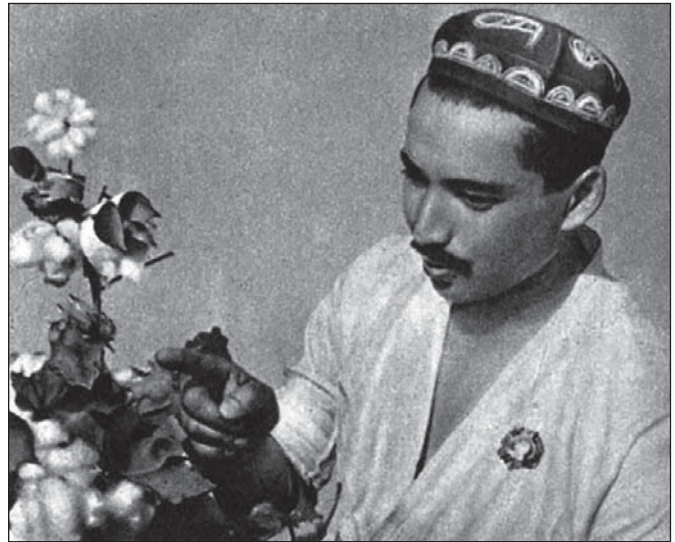
Кадр з фільму «Азамат» (1939)