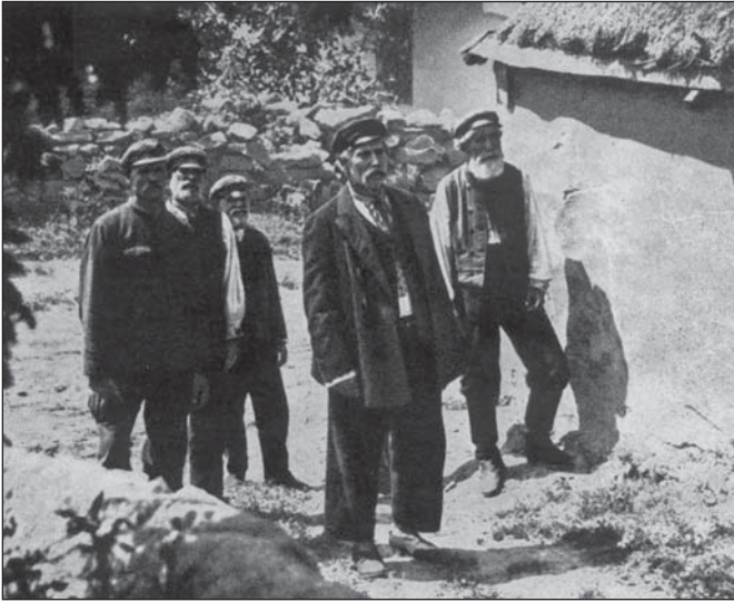
Кадр з фільму «Вітер з порогів». На передньому плані Микола Садовський

І виникла оригінальна думка. Щоб її здійснити, потрібне було скло розміром у три квадратні метри. Його тоді не легше було дістати, ніж ескадру. Почалися шукання. Довгі й, здавалось, безнадійні. І все-таки скло знайшли, і майже такого розміру, як хотіли. Воно чудом збереглося в колишньому універмазі.