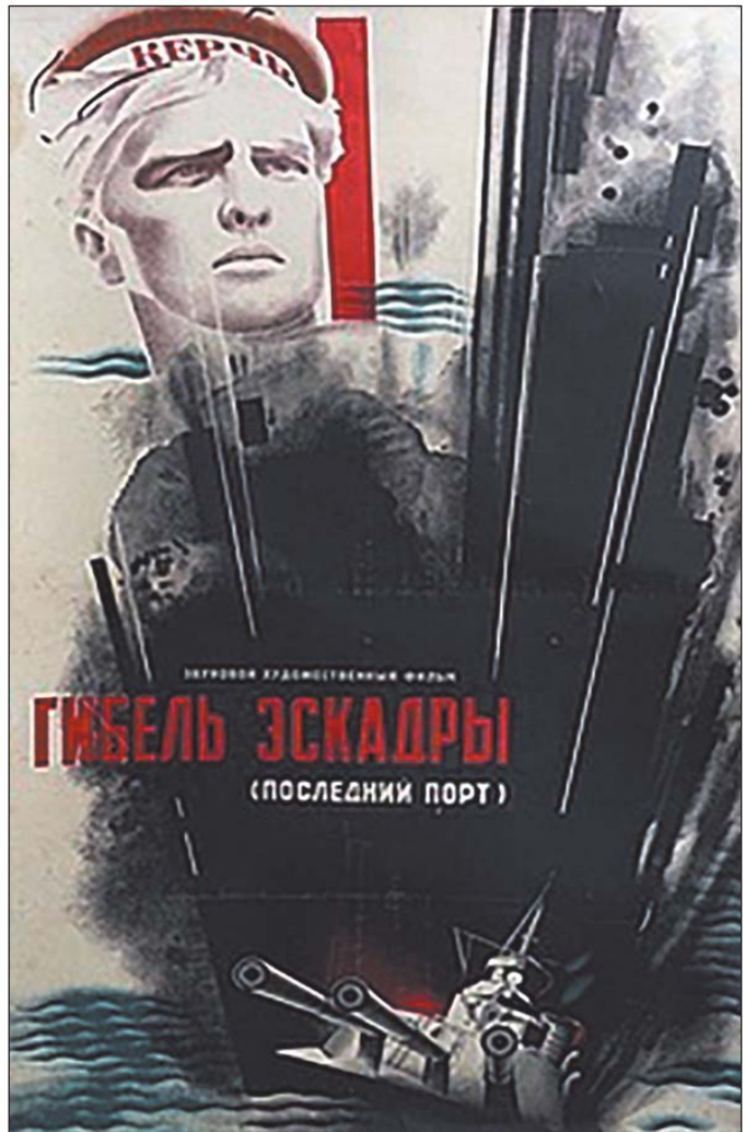
«Останній порт» (1930). Кіноплакат. Художник невідомий

Основою фільму «Останній порт» стали відомі події у Новоросійську. За умовами Брестського миру 1918 р. флот мав бути поверненим до Севастополя, де опинився би в руках Німеччини. Чорноморський флот, вірний революції, прийшов з окупованого Севастополя до Новоросійська. Німецьке командування поставило вимогу повернути флот до Севастополя, але без гарантій, що флот не буде загарбаний окупантами. В. Ленін офіційно надіслав наказ повернути флот і водночас 28 травня 1918 р. шифровану телеграму командуючому Чорноморським флотом про знищення ескадри під Новоросійськом. Тим самим створив трагічне непорозуміння в середовищі чорноморських моряків, яким пропонувалося вірити лише передягнутому балтійському російському матросу з крейсера «Аврора». Чорноморська ескадра стала політичною картою в поза українській грі російського більшовизму й була принесена в жертву намаганням більшовиків втримати владу в Петрограді за будь-яку ціну.