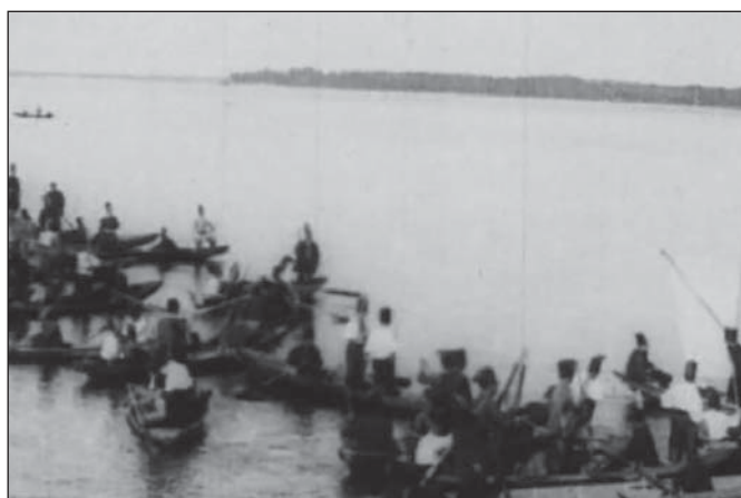
Кадри з фільму «Запорізька Січ»