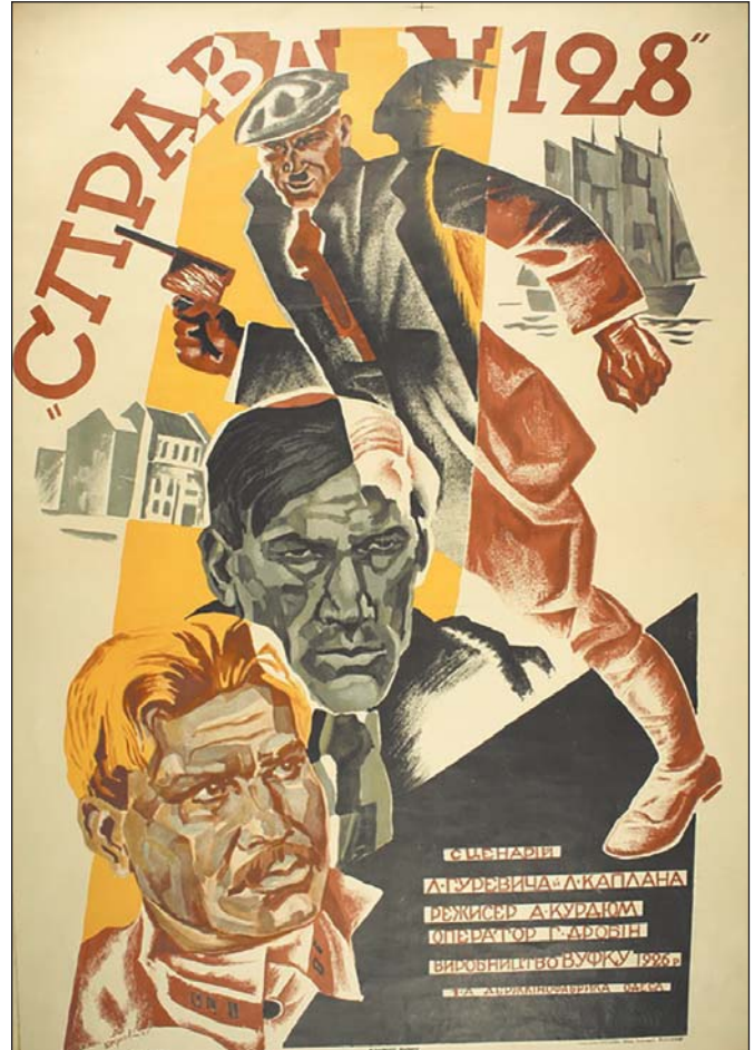
«Справа № 128». Кіноплакат (1927). Художник невідомий