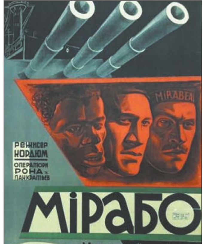
«Мірабо». Кіноплакат (1930). Художник невідомий

Попри всі суперечки фільм «Мірабо» вийшов на екрани кінотеатрів і з успіхом демонструвався в багатьох країнах Заходу під назвою «Заколот на Чорному морі».