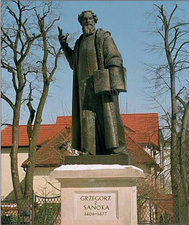
Пам'ятник Саноцькому в місті Санок

які намагаються закони природи підпорядкувати теології. Як «ідеолог міщанства», він стверджував, що релігія потрібна, її не слід нищити, а тільки так реформувати, щоб вона служила інтересам держави і людей; виступав за їх паралельне існування з виконанням кожною своїх функцій. Саноцький був одним із тих гуманістів, які прагнули реабілітувати не тільки зневажану феодалним суспільством фізичну працю, але й усі соціальні верстви, зокрема купців, ремісників, міщан, які « приносять своєю працею користь суспільству ». Натомість критикував феодалів за неробство. Він говорив, що люди, « ступуючи крок за кроком уперед, позбавляються варварського стану завдяки своїй власній праці і самі є творцями власної долі ». Визначаючи рівність людей перед Богом і законом, цінував у кожній особистості більше талант, добродієність, аніж родову шляхетність, титули. [9, с.13].