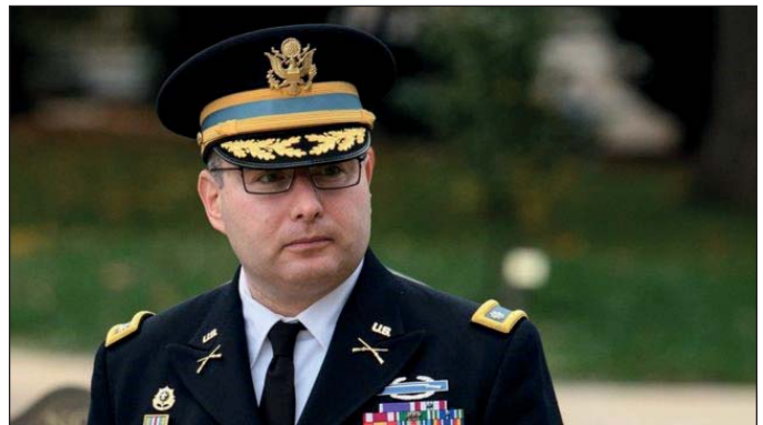
Александр Віндман підполковник армії США у відставці, директор з європейських справ у Раді національної безпеки США (2018—2020), м. Нью-Йорк, США

Зараз війна досягла перелому. Сполучені Штати повинні вирішити, чи допоможуть Україні підійти до столу переговорів із можливо максимальною силою, чи спостерігатимуть, як Росія реорганізує та поповнює свої війська, адаптує свою тактику та планує вести довготривалу війну на виснаження. Якщо українська демократія переможе, то зовнішні політики США повинні нарешті віддати перевагу відносинам з Україною, якою вона є, а не з Росією, якою вони хотіли би її бачити.