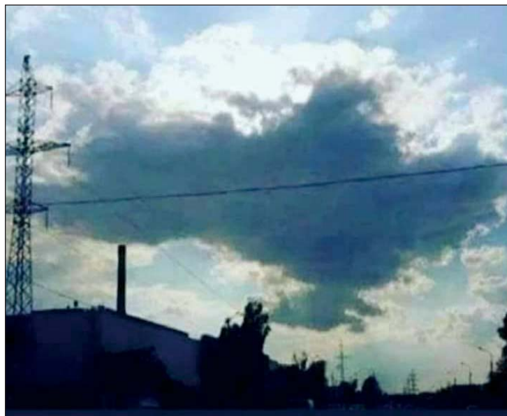
12 березня 2022 року. Мапа України на небі. З Богом сперечатися не треба – все буде Україна!