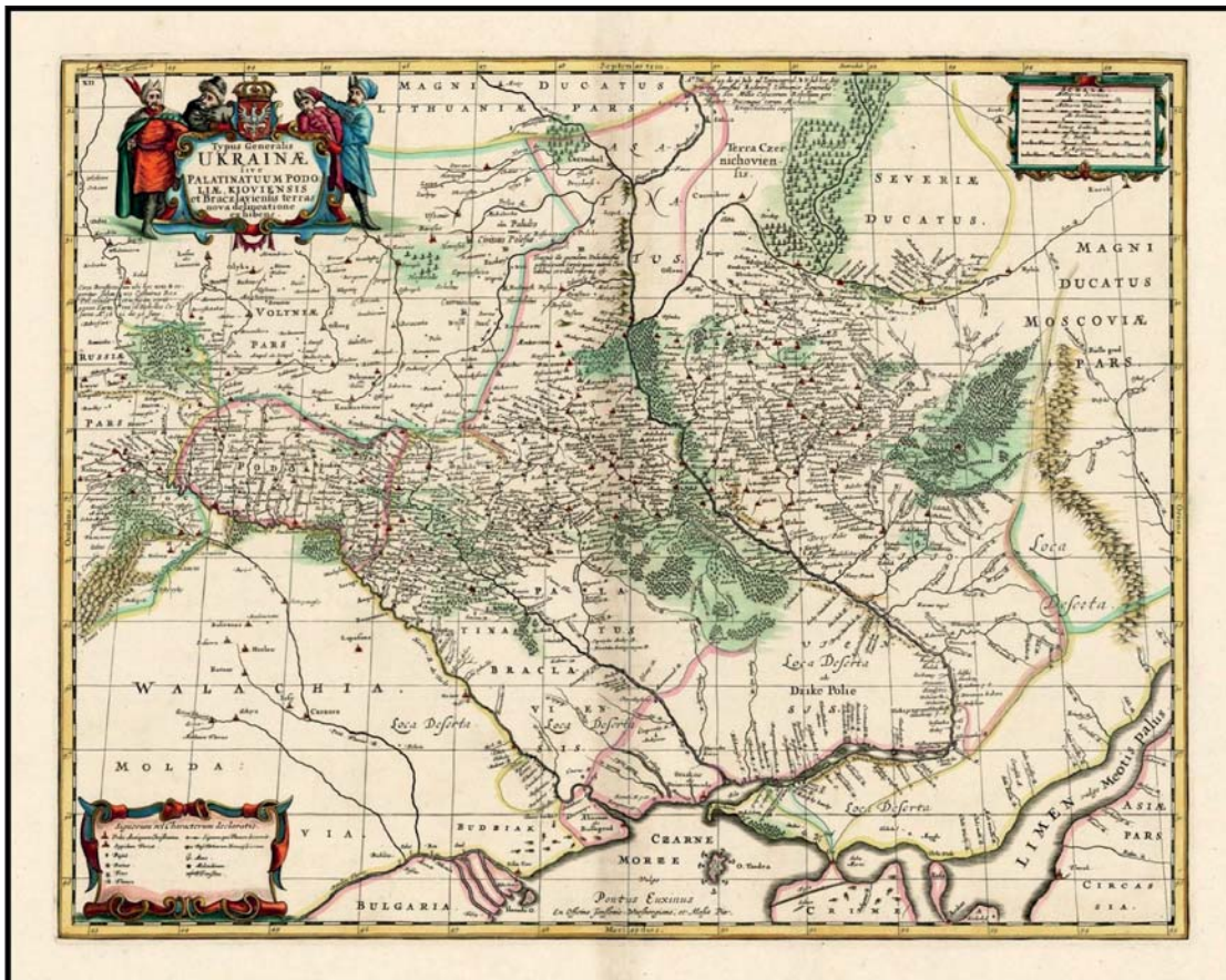
Мапа України французького військового інженера і картографа Гійома Левассера де Боплана 1680 року (на основі генеральної карти 1648 р.). У правому верхньому кутку позначено розташування Московії – Moscovia Pars (Земля Московія)

Культурно-релігійне життя в Росії XVII–XVIII ст. значною мірою перебувало під впливом козацької України. Московські царі, маючи намір хоч якось долучити свою державу до європейської культури, живилися плодами Української церкви та «київської науки». Первоначальниками московського духовно-літературного руху стали українці Єпіфаній Славинецький , Симеон Полоцький , Сильвестр Медведєв .