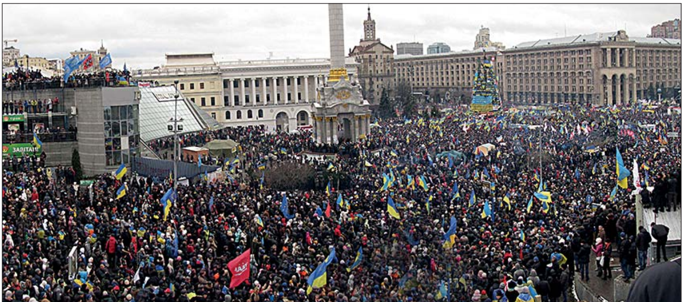
Революція Гідності. Київ, Майдан Незалежності, листопад 2013 р.

містах і селах – 6 %, і ще 9 % населення допомагали мітингувальникам харчами, грошми тощо. Отже, 20 % дорослого населення України – майже 10 мільйонів – так чи інакше активно підтримували Майдан.