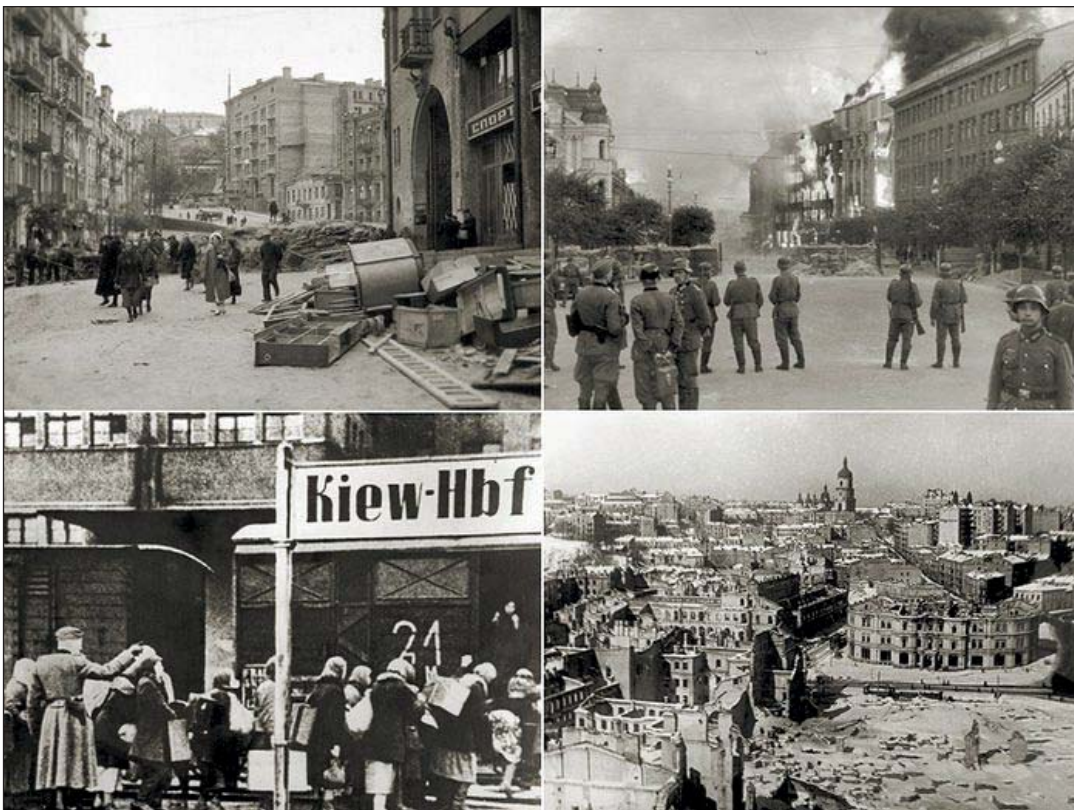
Київ на початку німецької окупації. Вересень 1941 р.

Уже 12 вересня німці взяли в облогу Львів. 17 вересня, порушивши радянсько-польський договір від 1939 року про ненапад, радянська армія вдерлася на територію Польщі. Відповідно до таємного пакту Молотова-Ріббентрона , німецька армія залишила західні терени України. Того ж дня у Бресті-Литовському (нині м. Брест у Білорусі) на честь успішної перемоги над Польщею відбувся спільний парад радянських і німецьких військ, який підтвердив союзництво двох тоталітарних режимів у поневоленні народів Європи.