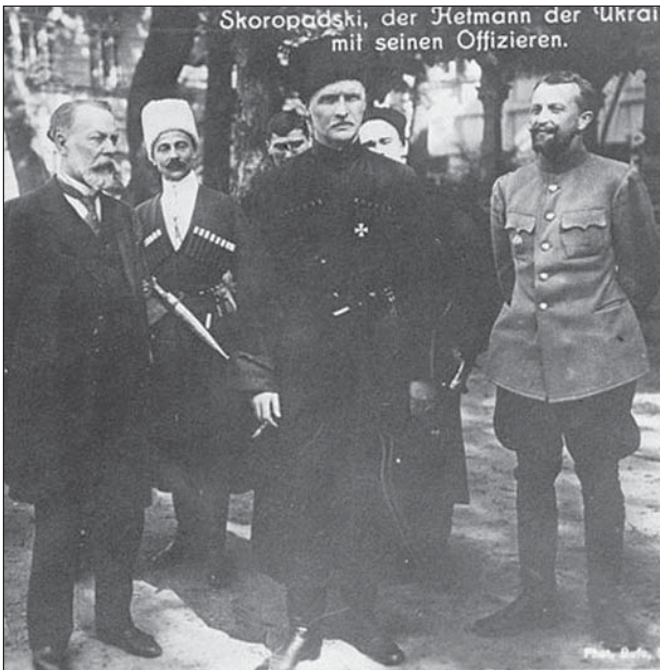
Зліва направо — голова Ради міністрів Української держави Федір Лизогуб і гетьман Павло Скоропадський . Посередині позаду — Микола Сахно-Устимович . Київ, жовтень 1918 р.

Але загравання з проімперськими силами та вкрай суперечлива соціальна політика Гетьмана, спрямована на підтримку великих землевласників, стали причиною падіння його влади й чергової дестабілізації на тлі агресії проти України одразу кількох зовнішніх сил.