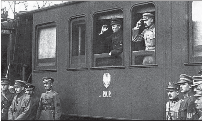
У вагоні потягу Симон Петлюра (ліворуч) і Юзеф Пілсудський. Вінниця, 1920 р.

У вкрай тяжких умовах український уряд на чолі з Симоном Петлюрою змушений був у квітні 1920 р. укласти Варшавський договір з Польщею. УНР в обмін на допомогу Польщі у війні проти більшовиків визнала де-факто встановлені кордони, тобто уряд Петлюри, перебуваючи в безвиході, змушений був змиритися з окупацією ЗУНР. А Польща зобов'язувалася не укладати міжнародних угод, спрямованих проти України, та гарантувати національно-культурні права українського населення в Галичині.