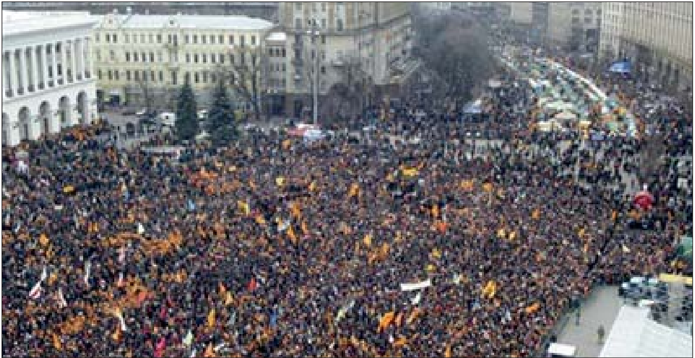
Помаранчева революція. Київ, Майдан Незалежності, жовтень 2004 р.