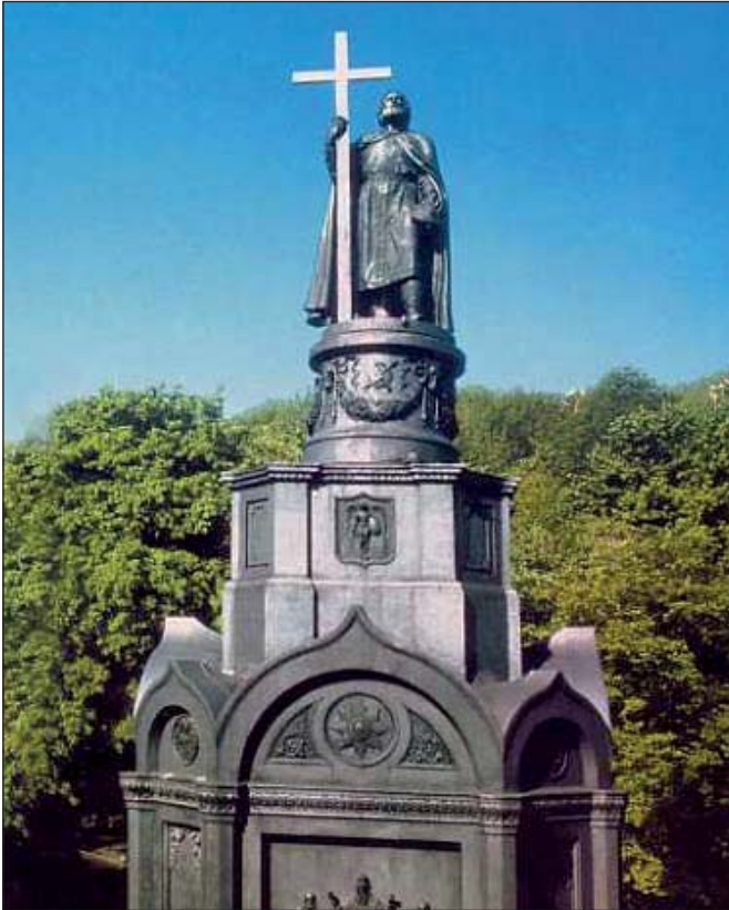
Пам'ятник князю Володимиру. Київ, 1853 р. Скульптори – П. Клодт (пам'ятник), В. Демут-Малиновський (барельєф «Хрещення киян», герб і орден св. Володимира). Архітектор – О. Тон

Після смерті Романа Мстиславовича Галицько-Волинське князівство потерпало від внутрішніх чвар бояр та посягань угорців. Вісім років майбутній король Данило Галицький боровся, щоб об'єднати князівство та зробити його цілком самоврядним. Данило зберіг за собою контроль над київською митрополією. Київська і Чернігівські землі почали відновлюватися. Звісно, що монголи прагнули зберегти своє владарювання над руськими землями, але далеко не завжди їм це вдавалося.