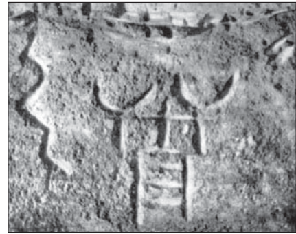
Петрогліф в одному з гротів Кам'яної Могили. Фрагмент з упряжкою биків (?) на панелі №37/4. З книги: Рудинський М.Я. Кам'яна Могила (корпус наскальних рисунків), видавництво АН УРСР, Київ, 1961 р.

Кам'яна Могила. Національний історико-археологічний заповідник поблизу м. Мелітополя (смт Мирне) у Запорізькій області. Від 26 лютого 2022 р. і до часу написання статті перебуває під тимчасовою окупацією РФ