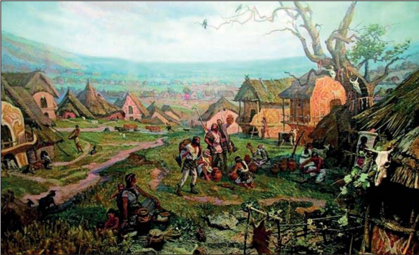
Трипільська культура. Діорама протоміста у Черкаському обласному краєзнавчому музеї. Відтворено на підставі археологічних досліджень

Другий етап традиції державності на теренах України пов'язаний з кіммерійцями, скіфами, сарматами та еллінами, які переважно заселяли степові регіони сучасної України, зокрема причорноморський регіон, тоді як у лісостеповій і поліській частинах України жили землероби: мелахлени, будини, гелони і сколоти. Впродовж тисячоліття античні міста-держави творили історію, тісно взаємодіючи з місцевим населенням – скіфами, кельтами, фракійцями, таврами; торгували з хліборобами лісостепу.