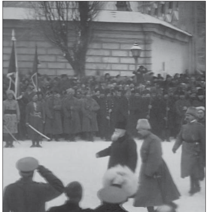
Голова Центральної Ради Української Народної Республіки Михайло Грушевський на військовому параді у Києві взимку 1917 р.

У вигнанні більшовиків з України ключову роль відіграли українські військові частини, які йшли попереду німецьких військ. У багатьох містах, зокрема в Полтаві, більшовики здавали владу після запеклих боїв з українськими частинами, яким допомагали чутки про наближення німецьких військ.