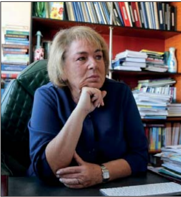
Елла Лібанова докторка екон. наук, професорка, академік НАН України, академік-секретар Відділення економіки НАН України, м. Київ

Світовий досвід переконливо доводить, що успішними стають тільки ті суспільства, які об'єднані навколо спільної ідеї щодо свого майбутнього. Безумовно, самого єднання недостатньо для успіху, крах ідеї може спричинити руйнування раніше згуртованого суспільства (як це сталося, наприклад, із нацистською Німеччиною), але ніколи успіху не досягали країни з роз'єднаним населенням.