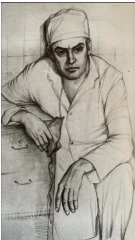
А. Радзіховський. Портрет Лілії – дружини художника. Пастель, 1986 р.