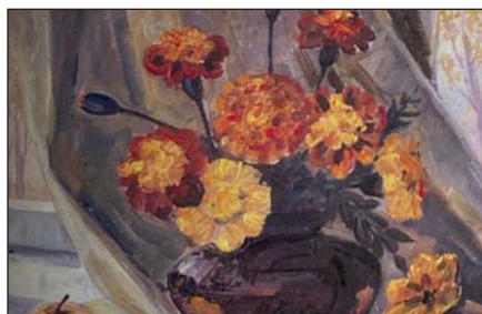
А. Радзіховський. Чорнобривці. Олія, 1986 р.