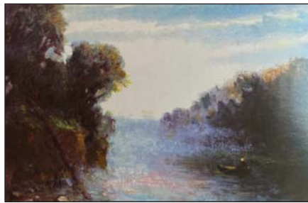
А. Радзіховський. Ранок. Олія, 1967 р.