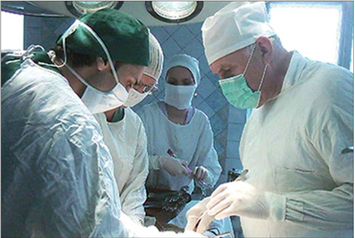
Тихо!! Йде операція!

А ще в основу його життєвої моралі назавжди вплетені такі прості і разом з тим такі важливі принципи добра і справедливості, порядку і законності, святості і пошани та її величності-совісті, які, на думку Анатолія Павловича, так мало притаманні нашому сьогоденному життю.