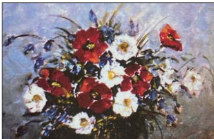
А. Радзіховський. Польові квіти. Олія, 1993 р.