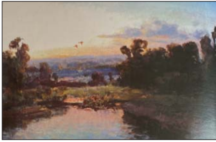
А. Радзіховський. Вечірній пейзаж. Олія, 1966 р.