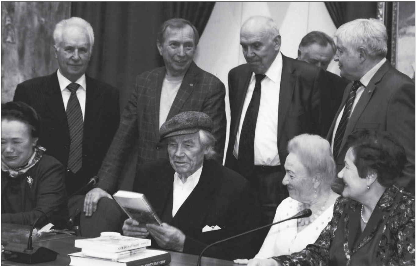
На святкуванні 90-річчя з дня народження Героя України співака Дмитра Гнатюка. Ювіляр розглядає книги А.П. Радзіховського. 2015 р.