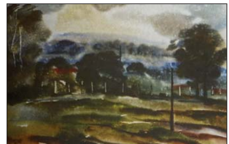
А. Радзіховський. Після дощу. Акварель, 1985 р.