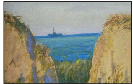
А. Радзіховський. Морський берег. Олія, 1983 р.