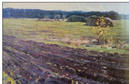
А. Радзіховський. На ріллі (Черкащина). Олія, 1990 р.