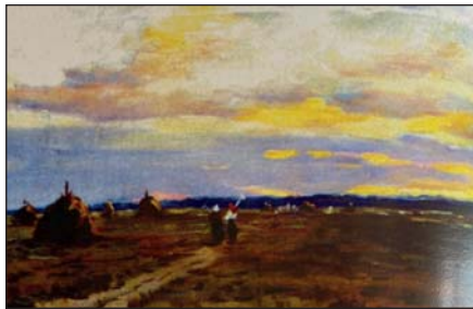
А. Радзіховський. Перший покіс. Олія, 1990 р.