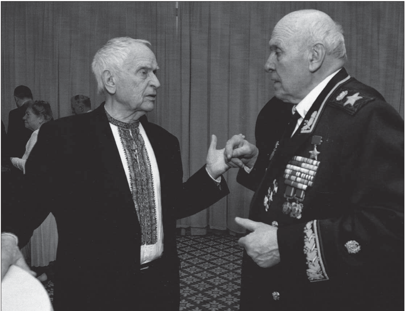
Живий диспут з класиком поезії Дмитром Павличком. Січень, 2019 р.

Анатолій Павлович своїми талантами і працею не тільки засвідчив себе як унікальний хірург, маститий художник, але й піднявся і постав на рівень самобутнього філософа, поета-самородка. Як хірург-медик він глибоко переконаний, що «Мистецтво лікування є вершиною гуманітарної діяльності людини. Воно несе місію творіння добра та захисту життя хворої людини.»