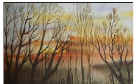
А. Радзіховський. Вечоріє. Акварель, 1989 р.