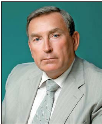
Володимир Мельниченко доктор істор. наук, лауреат Національної премії України імені Тараса Шевченка, м. Київ