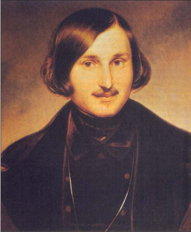
Ф. Моллер. Портрет М. Гоголя