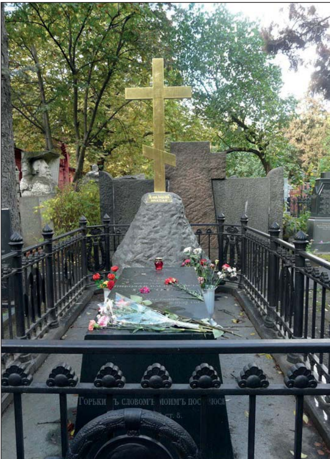
Могила М. Гоголя на Новодівочому кладовищі

Коли Щепкін відвідував Данилів монастир, Максимович тужив по Гоголеві, а Бодяньський виконував прохання Шевченка, над могилою письменника вивищувався невисокий дерновий горбок, увінчаний хрестом (очевидно, дерев'яним). У 1880-х роках біля узголів'я з'явилася кам'яна брила, прислана Іваном Аксаковим із Криму (за іншими даними її привезли з Уралу); вона служила «голгофою» високому мідному хрестові. На строгому масивному надгробку з чорного полірованого граніту було викарбовано тексти із Старого завіту. Огорожа на могилі з'явилася аж 1909 року.