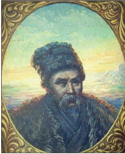
Портрет Шевченка. 1985 р.

віків, до героїки Козацької держави спонукає українців до роздумів і пробуджує патріотичні почуття. Адже становлення і збереження України як незалежної держави та донесення світові знань про нашу минувщину, непересічних осіб, які творили історію, додає надії та оптимізму на тернистому шляху українців.