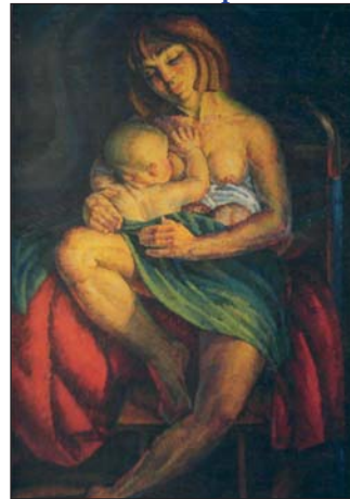
Первісток. 1972 р.