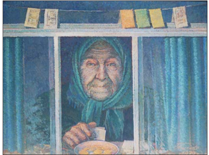
Кюскерка. 1979 р.