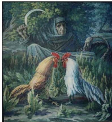
Алегорія. 1990-і роки