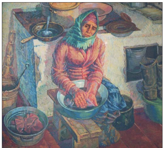
Жіноча доля. 1969 р.