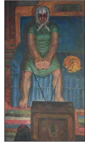
Моя мати. 1970 р.