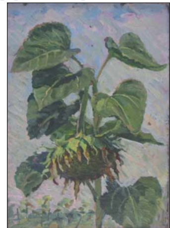
Зажурений сонях. 1995 р.