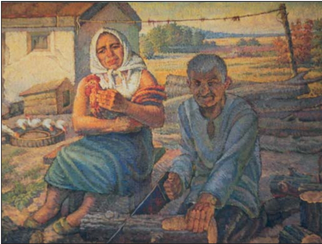
Вечірній мотив. 1970 р.