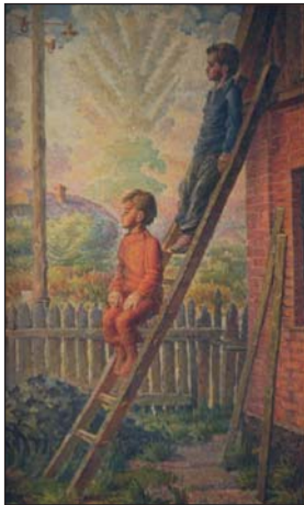
Хлопчачі мрії. 1984 р.