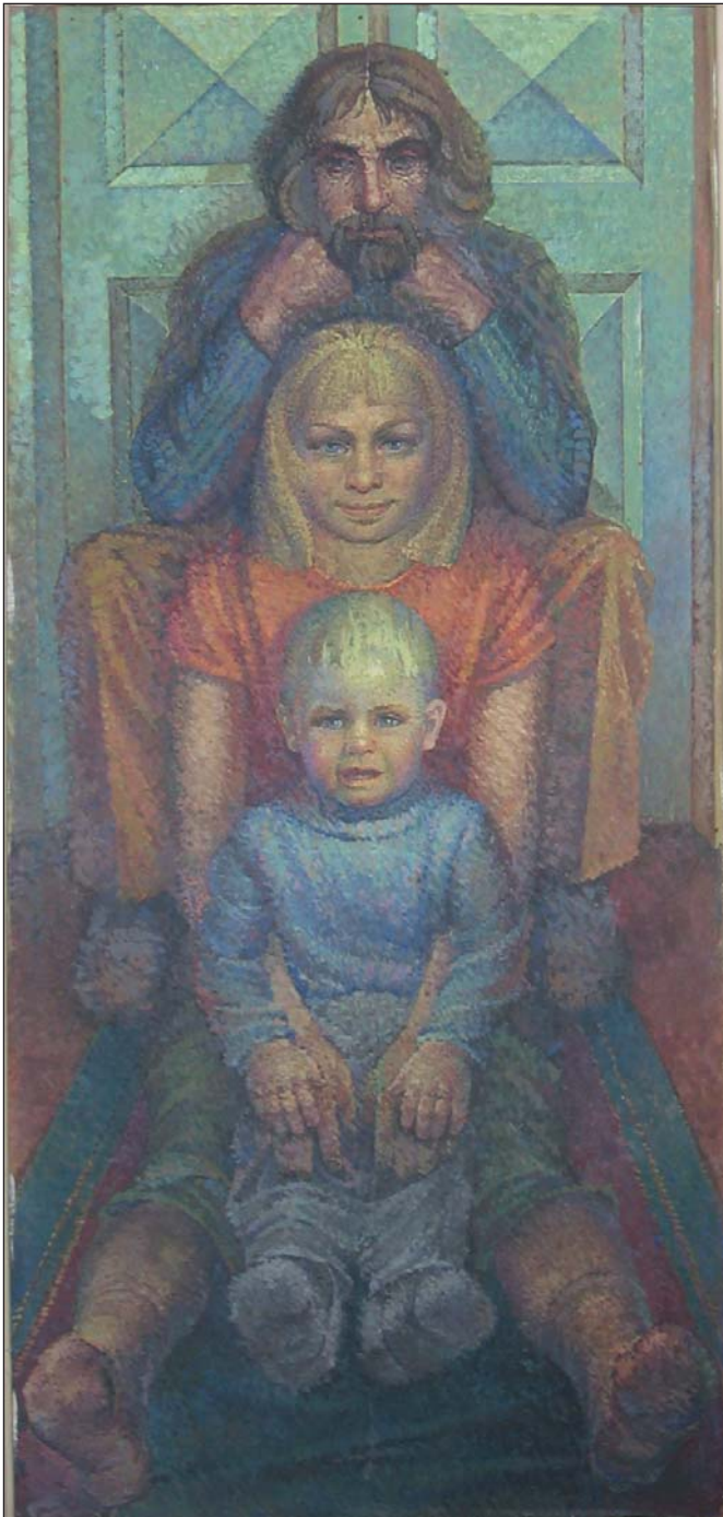
Мама, тато і я. 1977 р.