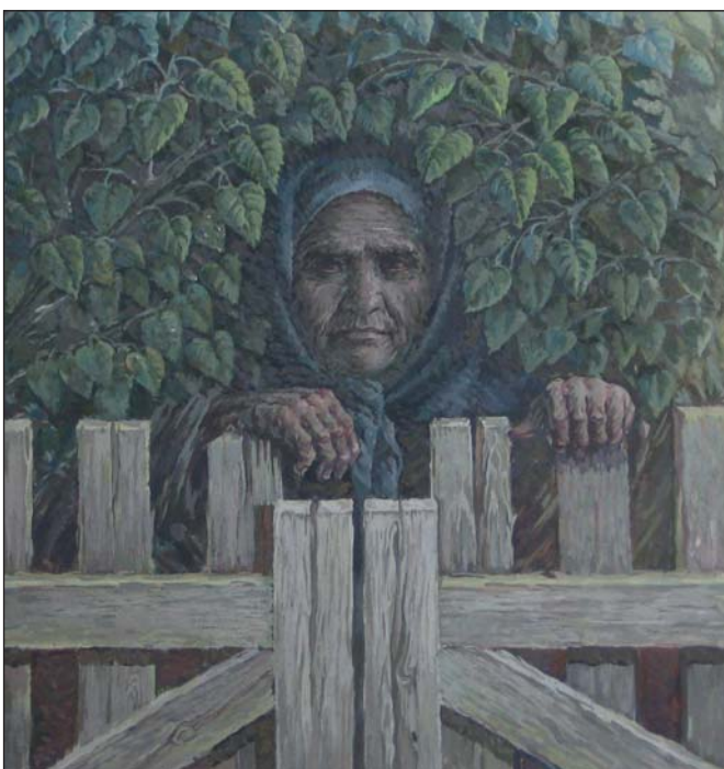
Може хтось пройде. 1990 р.