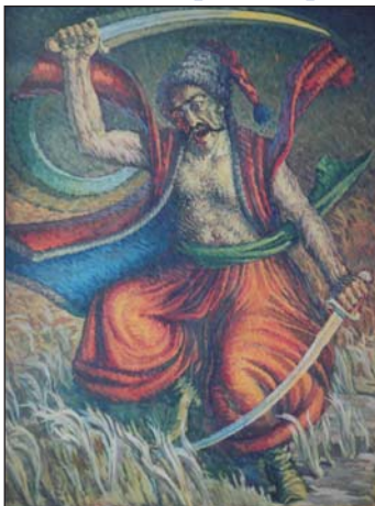
Запорізький козак. 1982 р.