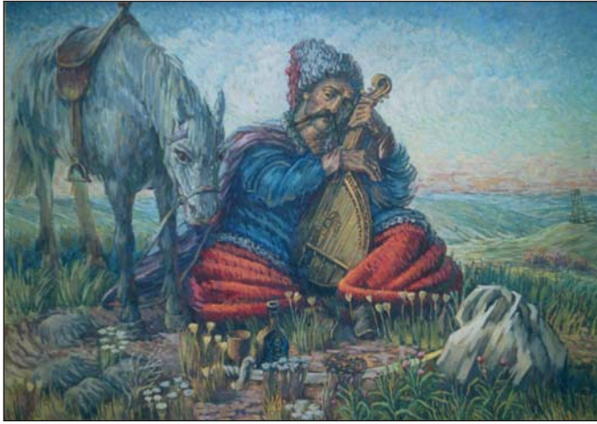
Козак Мамай. 1985 р.