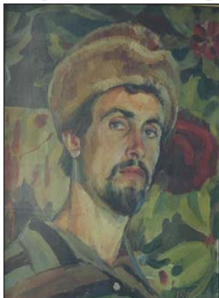
Автопортрет. 1965 р.