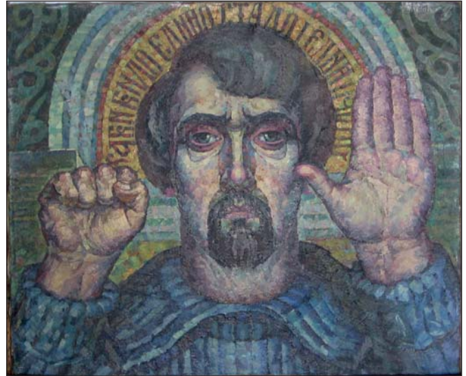
Аби було єдине стадо і єдин пастор. 2012 р.