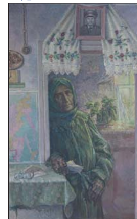
Лист від сина. 1985 р.