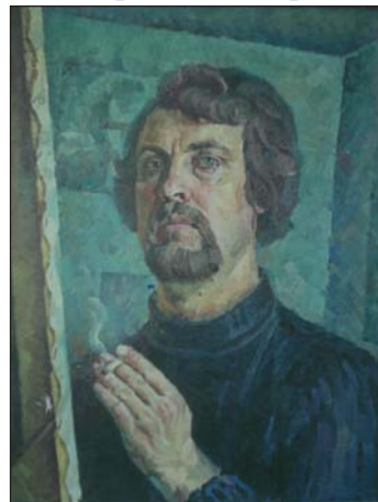
Автопортрет. 1975 р.