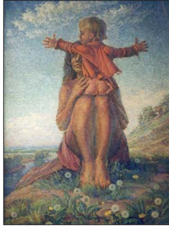
Син. 1974 р.