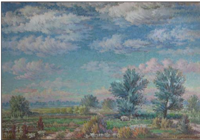
Хмаровий плин. 1988 р.