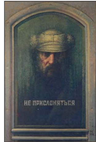
Портрет з віддзеркаленням. 1978 р.