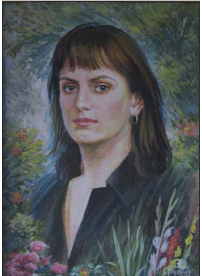
Портрет доньки. 2002 р.