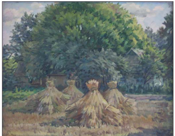
Пора жнив. 1990-ті роки