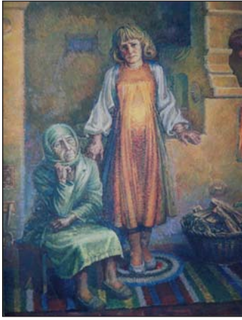
Очікування (вагітна). 1983 р.