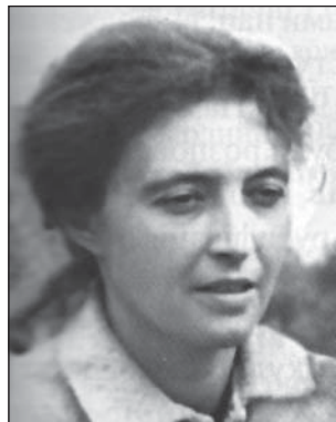
Ірина Георгіївна Заславська (1928–1976)