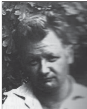
Юрій Васильович Цехмістренко (1929–1990)