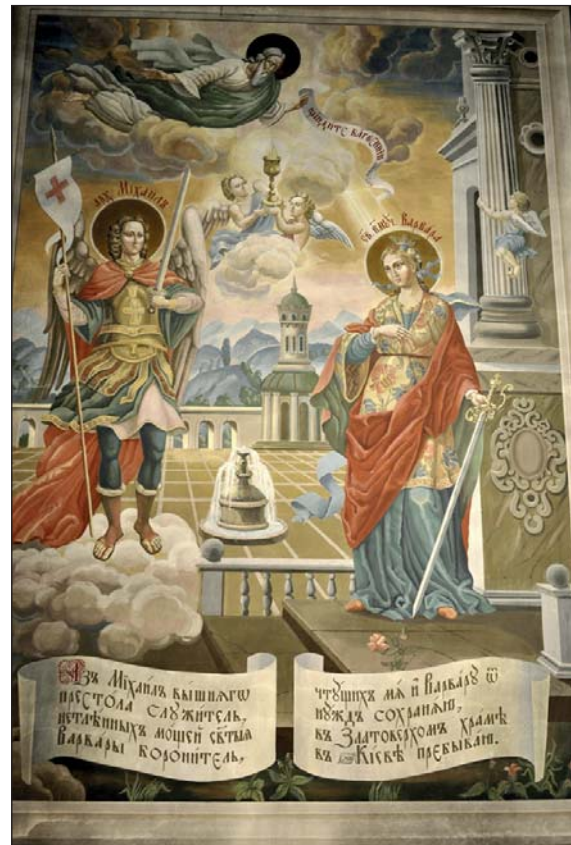
Розпис приділу Св. Варвари

У складі відновленої Михайлівської обителі є відома зі старовинних гравюр та фотографій дзвіниця, яка має оглядовий майданчик на чудовий панорамний краєвид та електронний годинник з карильйоном: його дзвони щогодини виконують мелодії найвідоміших