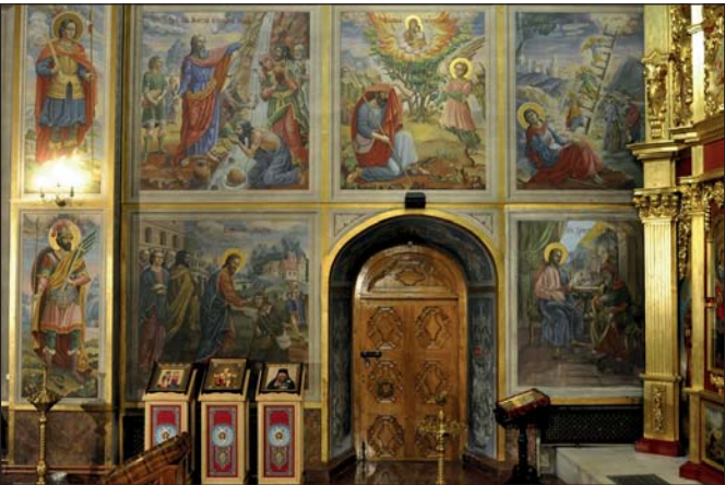
Розпис приділу Св. Варвари

українських музичних творів. На другому ярусі дзвіниці створено церкву на честь трьох святих: Василія Великого, Григорія Богослова та Іоана Золотоустого , яку урочисто відкрили в пам'ять жертв голодомору і комуністичних репресій. Освячення храму звершив у 1999 році священноархимандрит монастиря, Святійший Патріарх Київський і всієї Руси-України Філарет .