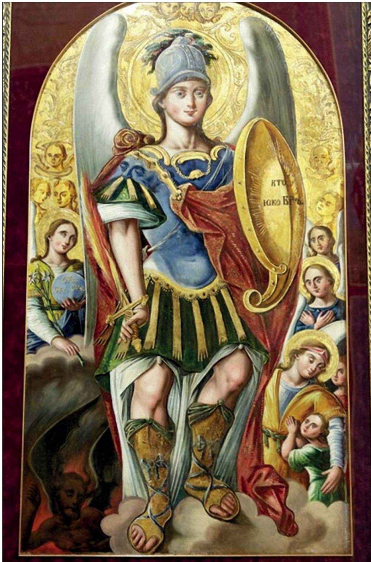
Архангел Михаїл. Храмова ікона Михайлівського Золотоверхого собору. XVII ст.