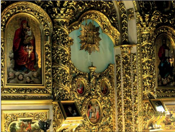
Сучасний іконостас Собору Архістратига Михаїла