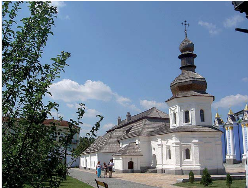
Церква Іоана Богослова на території Михайлівського Золотоверхого собору

Варто додати, що в оновленому приділі Святої Катерини збереглася давня хрещальня XII століття (значно нижче сучасної підлоги храму, адже за століття рівень землі природно піднявся). До хрещальні ведуть сходи, зверху вона вкрита мережаною сінню, а внизу можна побачити складене із природнього каміння місце для хрещення та відновлені мозаїки з іконами Ісуса Христа, Богородиці, Архангела Гавриїла, Іоана Предтечі, Архангела Михаїла. А під гранітом у хрещальні замуровано капсулу з посланням до нащадків: «Закладено місяця травня, 24 дня у літо 1997 від Різдва Христового на відзнаку початку робіт по відтворенню Михайлівського Золотоверхого собору». Найдавніша збережена перлина обителі – світла й затишна трапезна церква Святого Іоана Богослова – за свою довгу історію теж зазнала пошкоджень, проте волею Божою вже триста років залишається цілою. Церква апостола любові євангеліста Іоана дарує спокій та мир усім, хто заходить сюди помолитися: на віконному стеклі в формі медових сот навіть у холодному листопаді можна побачити махаона, який усамітнівся в теплій церкві за товщею старих стін.