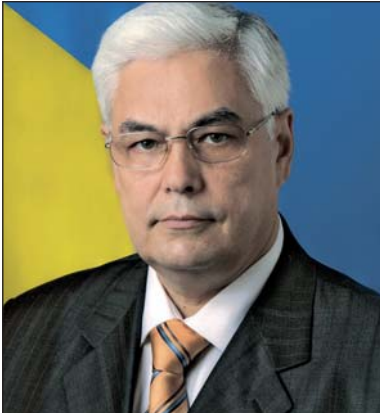
Сергій Пирожков доктор екон. наук, академік НАН України, віце-президент НАН України, м. Київ