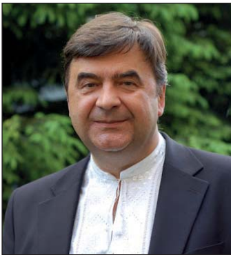
Ігор Мриглод доктор фіз.-мат. наук, академік НАН України, гол. наук. співроб. Інституту фізики конденсованих систем НАН України, м. Львів