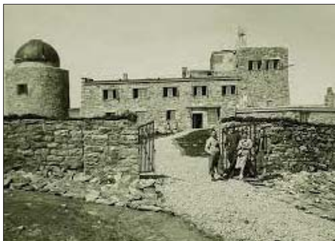
Обсерваторія на горі Піп Іван. Фото 1938 р.

Что нашли там, что видели и как спустились, как Новый год встретил, опишу в другой раз. Целую.