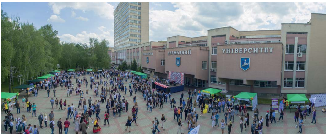
Рис. 9. Головний кампус Сумського державного університету

Закладено передумови для продовження політики, яка виправдала себе, але ще далеко не вичерпана, – політики розвитку та успішності СумДУ як високорейтингового європейського інноваційного ЗВО, що сповідує ідеологію університету дослідницького типу, головним пріоритетом якого є якість в усіх її складових. Розвиток університету триває. ■