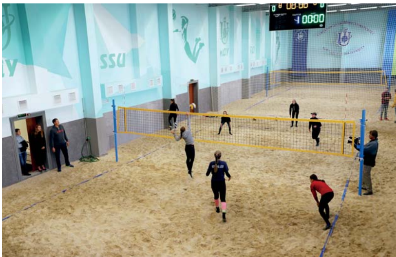
Рис. 7. Центр пляжного волейболу СумДУ

Для забезпечення якісної та безпечної спортивної підготовки на базі СумДУ створено Центр спортивної медицини, центри пляжного волейболу, єдиноборств та ін. (рис. 7). Також на базі університету функціонує Центр військово-патріотичного виховання студентської та шкільної молоді.