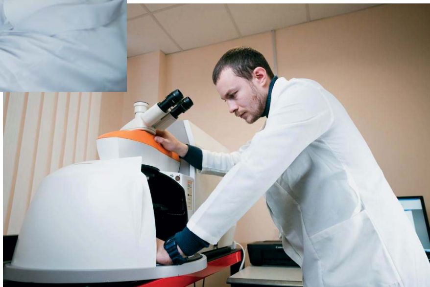
Рис. 6. Центр колективного користування науковим обладнанням СумДУ