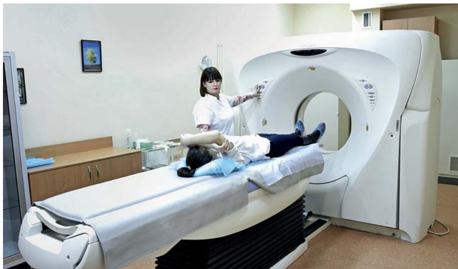
Рис. 8. Комп'ютерний томограф університетської клініки СумДУ

Культурну складову позанавчальної діяльності забезпечує робота культурно-мистецького центру. У 2020 році серед учасників творчих колективів СумДУ налічувалося понад 120 лауреатів мистецьких конкурсів, із яких близько 20 – міжнародного рівня. Шість колективів мають підтвержене звання «Народний аматорський» і ще один колектив пройшов усі етапи для його одержання. Відбувся повномасштабний вихід школи студії КВН на Всеукраїнський телевізійний рівень; серед здобутків – перемога в зимовому кубку «Ліга сміху».