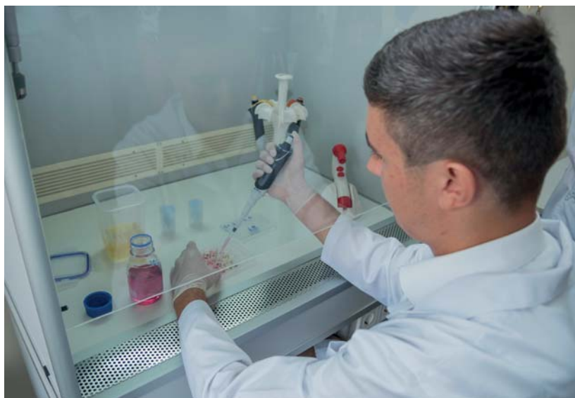
Рис. 5. У лабораторії клітинних культур СумДУ

У 2020 р. центром налагоджено механізми дистанційної роботи в умовах карантинних обмежень, яка передбачає таке: замовник послуги у будь-який спосіб передає оператору зразки досліджень та під час проведення досліджень знаходиться за своїм персональним комп'ютером або мобільним телефоном. Інженер-дослідник, який обслуговує прилад, надає замовнику посилання на відео-зустріч з використанням програмного засобу Google Meet, а після налагодження зв'язку із замовником починає дослідження зразків. Особливістю дистанційної роботи є те, що замовник у реальному часі бачить зображення зразка і має змогу спілкуватись з інженером-дослідником за допомогою голосового зв'язку та, як наслідок, керувати процесом дослідження. Слід відмітити, що резервування приладів для дослідження здійснюється з 2019 р. в on-line режимі через заповнення google-форми на сайті центру.