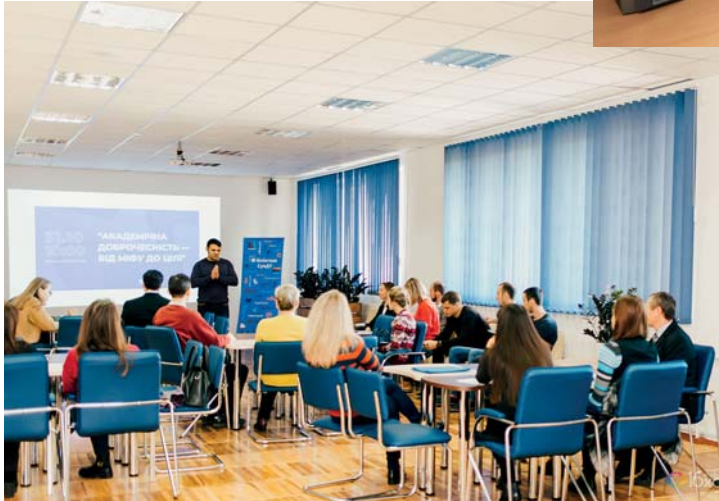
Рис 2. Студентська наука в СумДУ