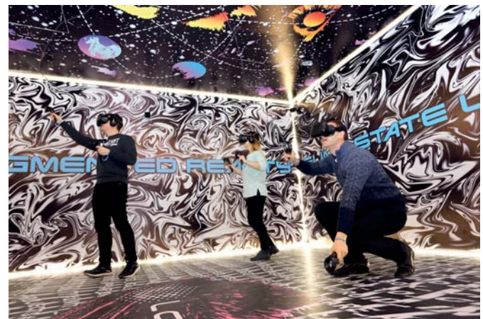
Рис. 3. Лабораторія віртуальної та доповненої реальності «U-lab» та застосування нових освітніх технологій в СумДУ

Функціонує інтегрована інформаційна система університету: «хмарні рішення», мобільні додатки, конструктор контенту, обчислюваний кластер, дистанційний доступ до віртуальних лабораторій і симуляторів провідних університетів світу. Масштабно (більш ніж 13 тис. користувачів) упроваджено електронний особистий кабінет співробітника й студента, що має функцію єдиної точки доступу до будь-яких сервісів та інформаційних ресурсів університету.