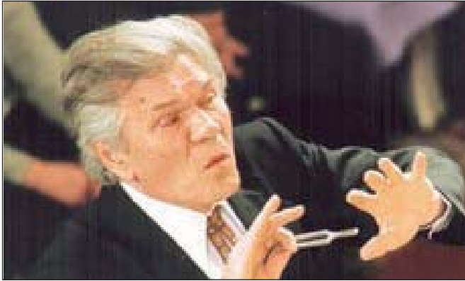
Народний артист України Микола Петрович Гвоздь