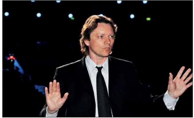
Народний артист України Андрій Миколайович Козачок

Народному артисту України Андрію Миколайовичу Козачку ПРИСВЯЧУЄТЬСЯ