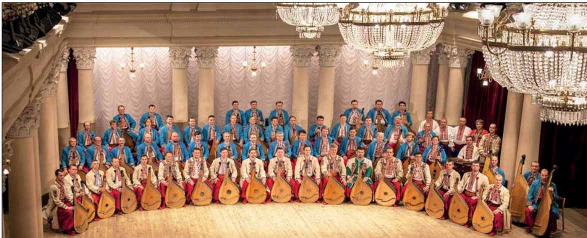
Національна Заслужена капела бандуристів України ім. Г.І. Майбороди. Виступ у Національній філармонії України