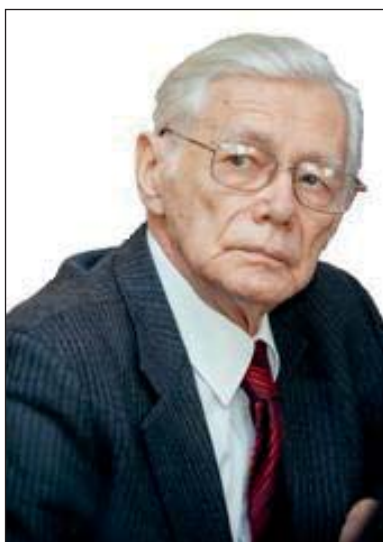
Любомир Пиріг академік НАМН України, член-кореспондент НАН України, м. Київ

Б агатьом людям притаманна властивість збирати, зберігати, накопичувати якісь речі, предмети. Частіше ці люди, ставши таким чином колекціонерами, не діляться своїм захопленням навіть із друзями. Навіть тоді, коли вони збирають речі, які популярні серед колекціонерів. Чи не подібне це до інстинкту деяких (більшості) тварин та птахів, для яких збирання і нагромадження є засобом збереження і захисту життя?