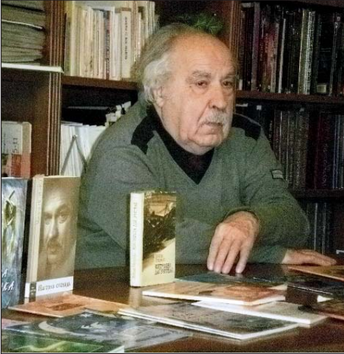
Микола Петренко (1925–2020)