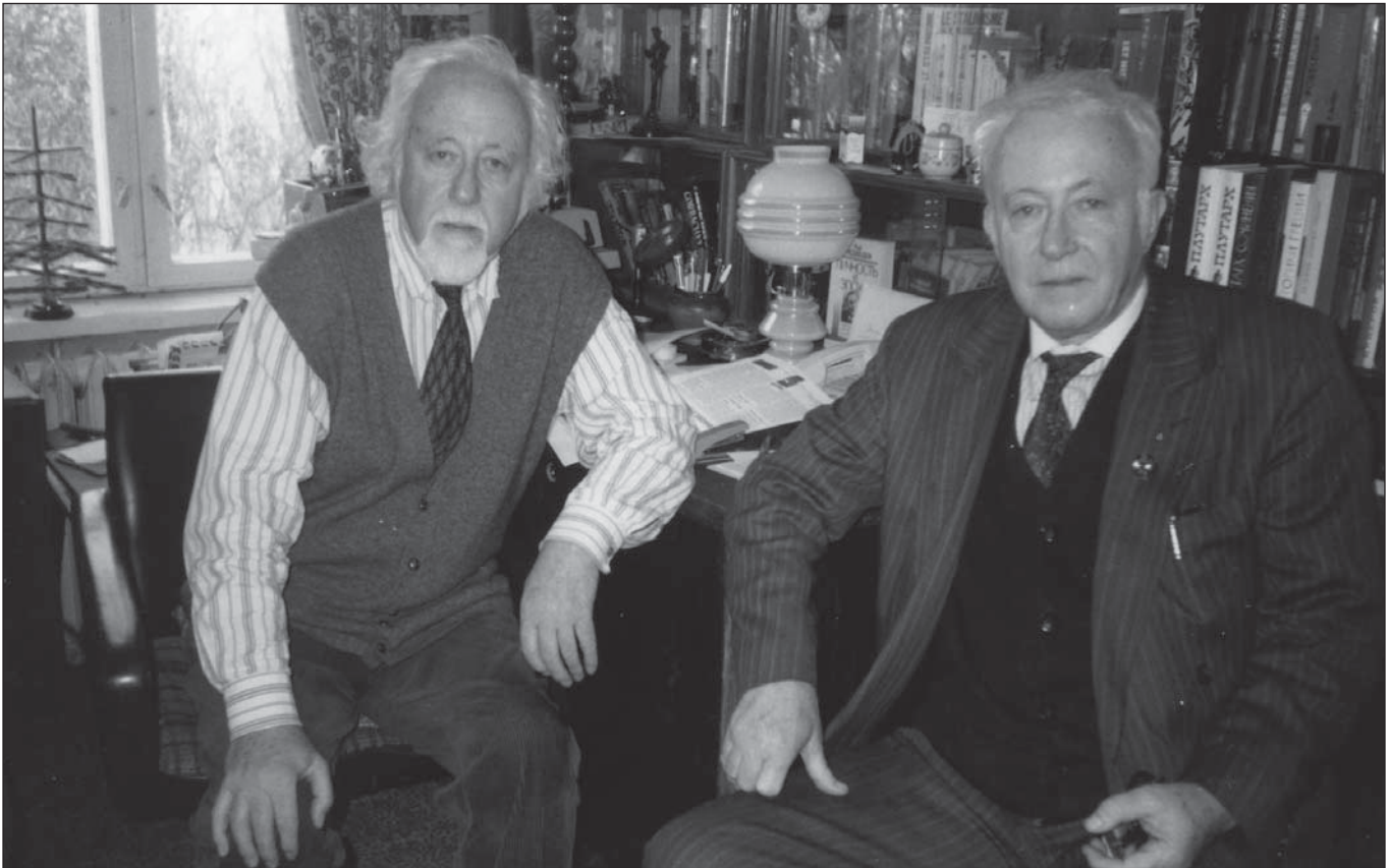
Брати Рой і Жорес Медведєви. 1995 р.

Переслідування не зупинили братів. У 1969-му році Жорес закінчив рукопис «Міжнародне співробітництво вчених і національні кордони» про перешкоди, які чинить влада радянським вченим у їх спілкуванні з зарубіжними колегами. У квітні 1970 року він завершив роботу-дослідження «Таємниця листування охороняється законом». Вчений торкнувся неафішованих методів ідеологічного контролю. Особливо скандально виглядала антиконституційна перлюстрація кореспонденції.