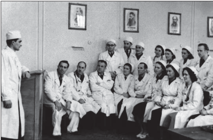
1955 рік. Студенти медичного факультету Ужгородського державного університету на лекції