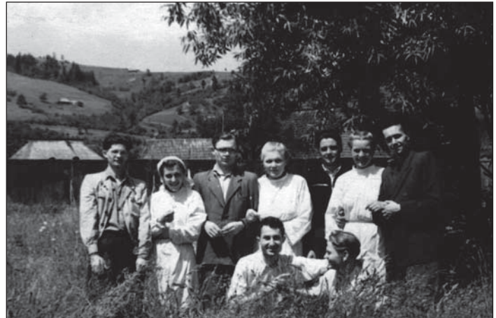
1954 рік. Студенти медичного факультету Ужгородського державного університету разом із викладачами в експедиції по виявленню ендемічного зоба у мешканців Міжгірського району Закарпатської області