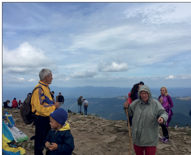
Серпень, сонце вітер...