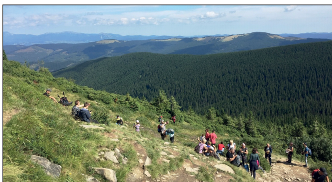
Перепочинок перед вершиною