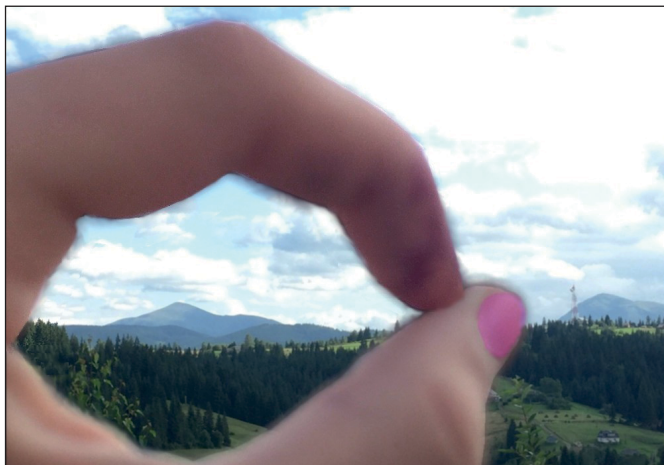
В об'єктиві – Говерла