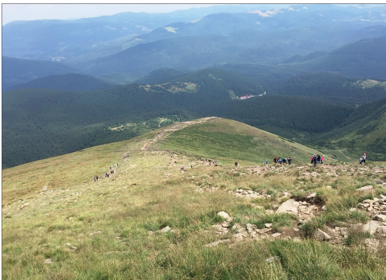
Чарівний світ Карпат