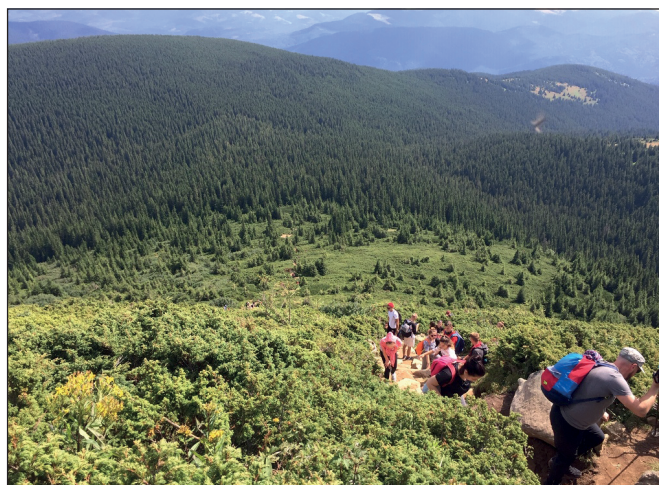
Ще одне невелике зусилля – і вершина!