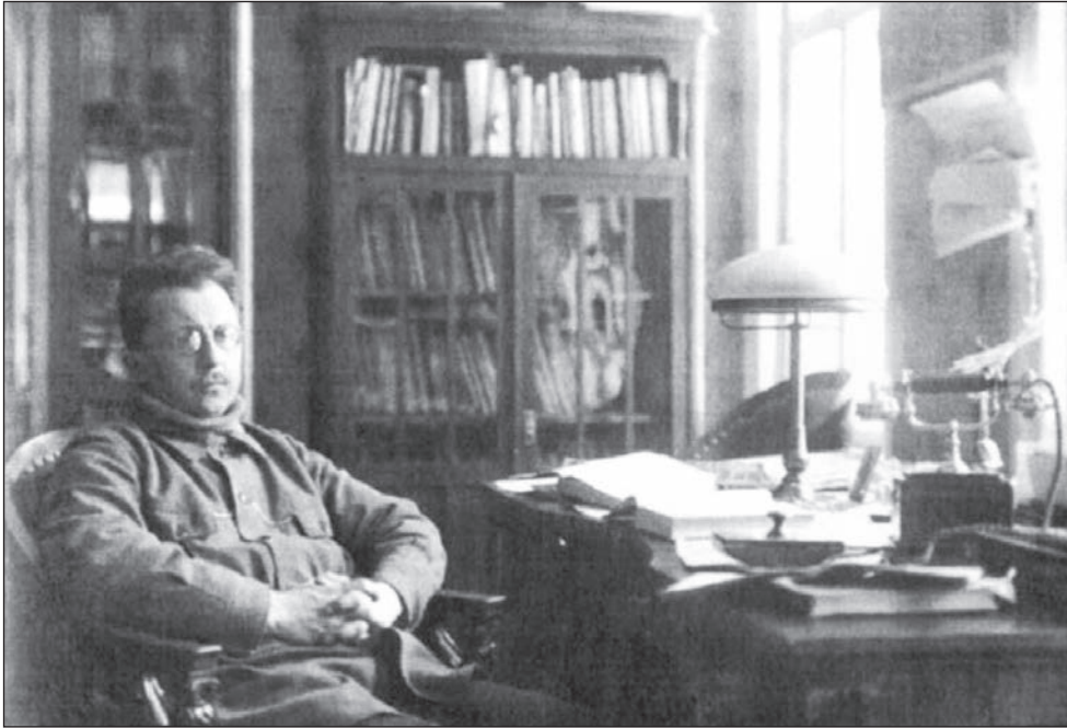
М. В. Птуха у своєму кабінеті (перша половина 1930-х років)

Отже, монографія М.І. Шпиталь та Н.І. Коцур, єдина на сьогодні комплексна праця про академіка М.В. Птуху, є гідним пошануванням ювілярів: і Національної академії наук України, і її першого в світі Демографічного інституту, і 135-річчя від дня народження академіка М.В. Птухи. Ця фундаментальна праця охоплює всю наукову спадщину корифея української економічної думки, видатного статистика-демографа, знаного далеко за українськими рубежами. Найбільшу наукову цінність монографії, її повноту та достовірність забезпечило уведення до наукового обігу величезної кількості унікальних документів, які в попередніх публікаціях навіть не згадувалися. За ознаками наукової новизни ми й будемо цю працю оцінювати.