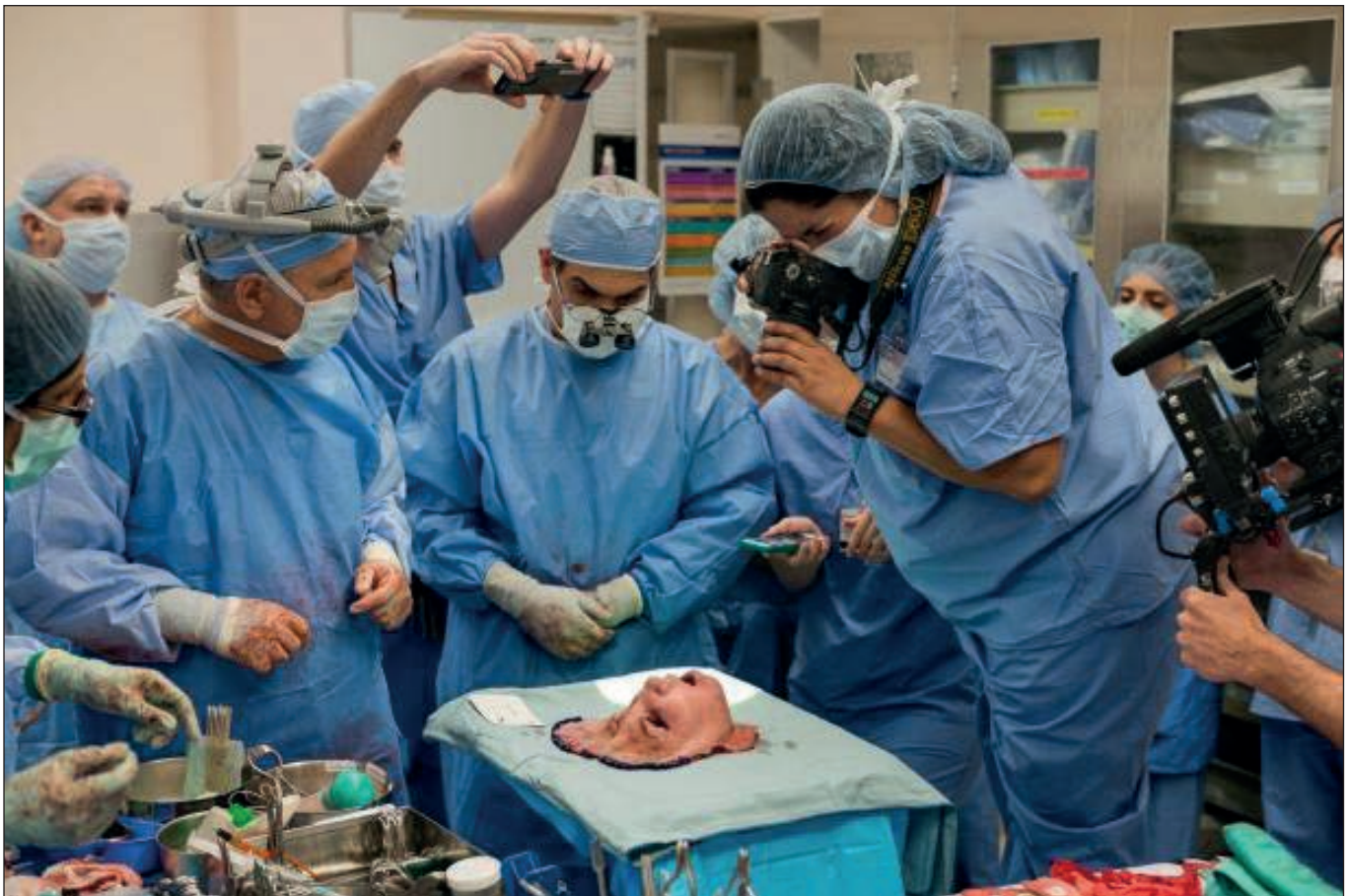
Момент, коли медперсонал зібрався навколо людського обличчя від загиблого донора, призначеного для пересадки

Редакція журналу National Geographic представила топ-5 найкращих фотографій минулого десятиліття. Спочатку було відібрано 15 знімків із мільйонів, зроблених фотографами в різних куточках світу. А потім передплатники журналу в Інстаграмі проголосували і вибрали топ-5 фіналістів, в тому числі: фото останнього самця вимираючого підвиду північного білого носорога, сольного підйому альпініста на скелю, операційної для дівчини без обличчя, ведмедя, який ганяє птахів у найдавнішому національному парку США, та польоту колібрі ■