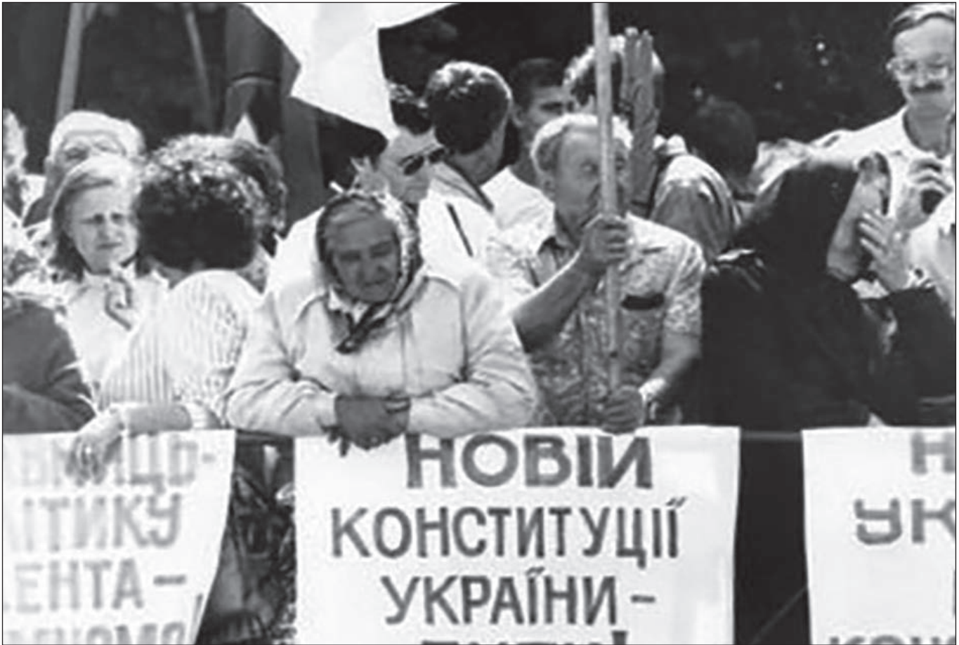
Мітингувальники перед Верховною Радою вимагають прийняття Конституції. Київ, 19 червня 1996 р.