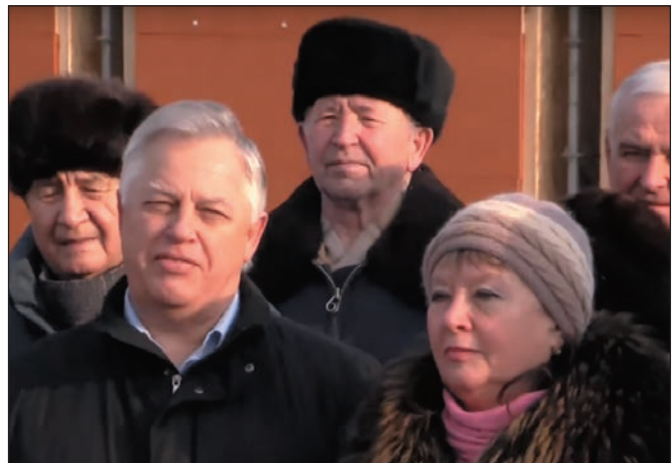
П. Симоненко разом із Н. Вітренко на мітингу 25.01.2016 р.

Однак перипетії суспільно-економічного розвитку України за три останні десятиліття не повинні бути причиною песимізму. Найбільшим завоюванням українського народу, породженим як розпадом СРСР, так і віковими традиціями національно-визвольної боротьби, є демократичний устрій держави. Громадяни України володіють колективним суверенітетом, тобто здатністю на вільних