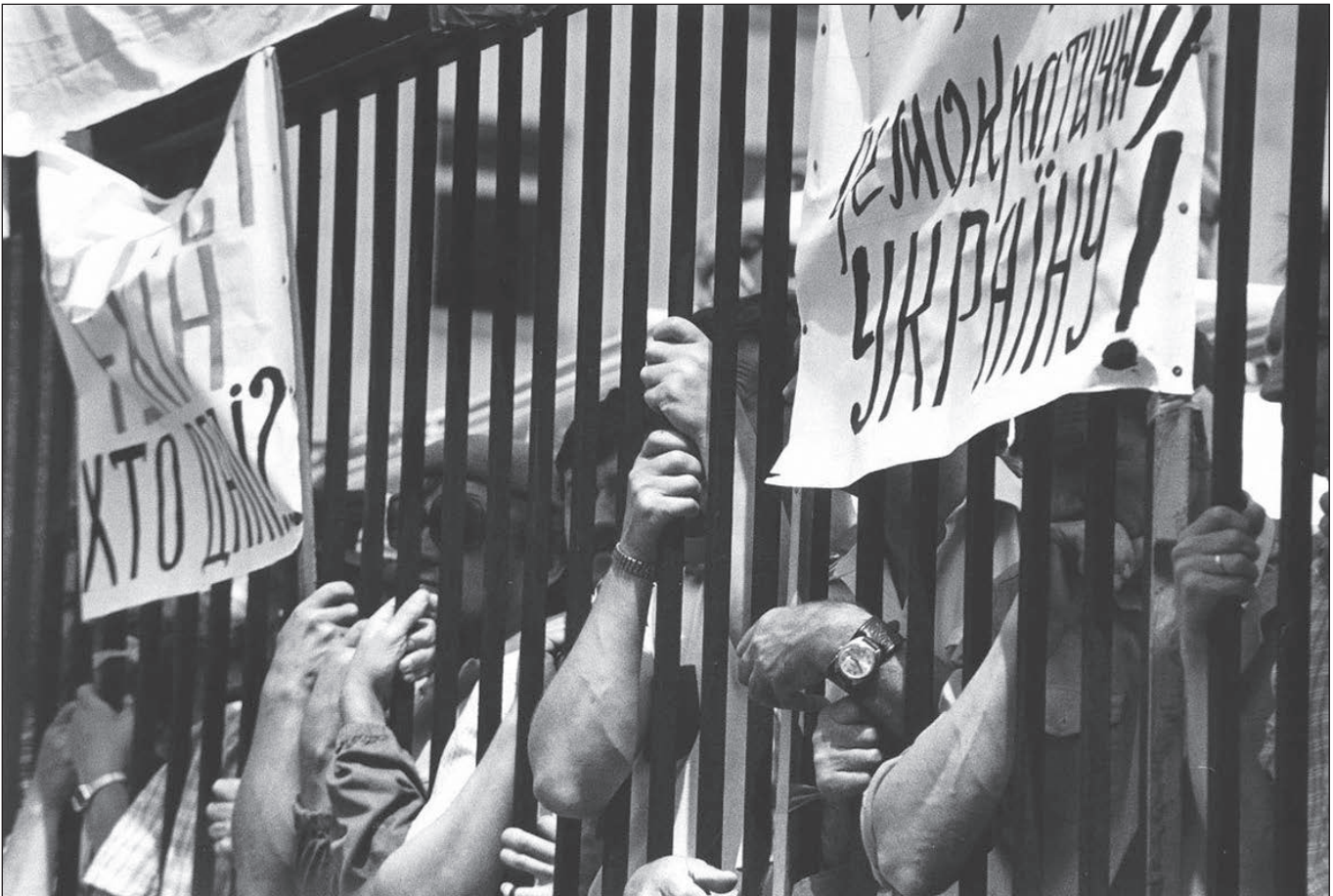
Липень 1990 року. Мітинг за демократичну Україну

Україна надто довго перебувала в полоні нав'язаного їй червоною Росією комунізму. Здавалося, що здобута внаслідок розпаду СРСР незалежність покінчила з її комуністичним минулим. Тим більше, що наші громадяни відіграли вагомий роль у розпаді радянської наддержави. Однак труднощі трансформаційного періоду спровокували загрозу червоного реваншу, яка проявилася у заводінін законодавчого органу держави лівими силами на виборах 1998 р. Президентські вибори 1999 р. і постанови Верховної Ради на початку 2000 р. нейтралізували загрозу червоного реваншу, але комуністи і соціалісти залишилися в політичному житті. Тільки Революція гідності поставила бар'єр поширенню комуністичної пропаганди. Варто згадати прийняті Верховною Радою антикомуністичні закони 2015 р.