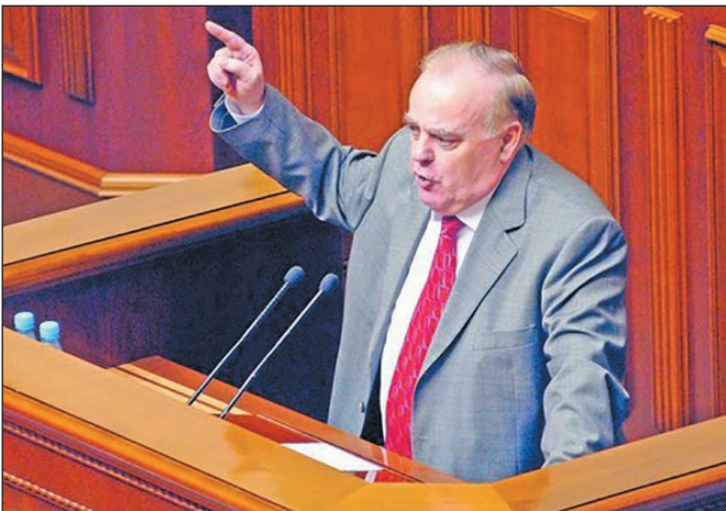
Олександр Ткаченко, голова Верховної Ради України від 7 липня 1998 р. до 1 лютого 2000 р.

Чи не постане знову привид комунізму перед очима багатьох наших співгромадян? Адже цей зловісний привид породжується не давно відмерлою ідеологією, а успадкованою від попередніх поколінь звичкою покладатися на державу у розв'язанні власних життєвих проблем.