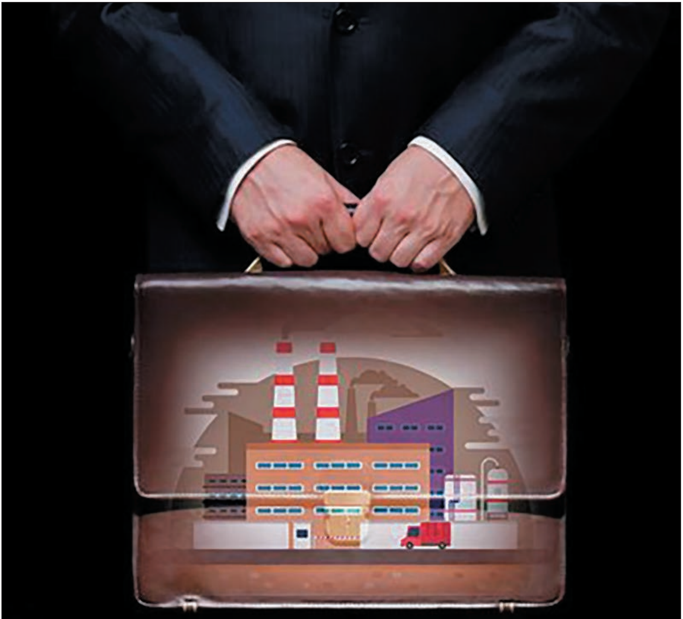
"Приватизація". Колаж РБК-Україна

Однак пульсуючі Майдани в країні, проти якої путінська Росія веде «гібридну війну», загрожують втратою державності. Важливо, щоб це усвідомлювали обидві сторони: «партія влади», яка звузилася до постаті однієї людини, та суспільство, яке володіє суверенними правами на владу і не збирається відмовлятися від них. ■