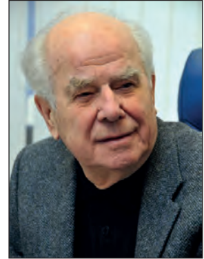
Академік НАН України Юрій Ілліч Кундієв (1927 – 2017)

О.С. Пушкін «Євгеній Онегін», переклад М. Рильського