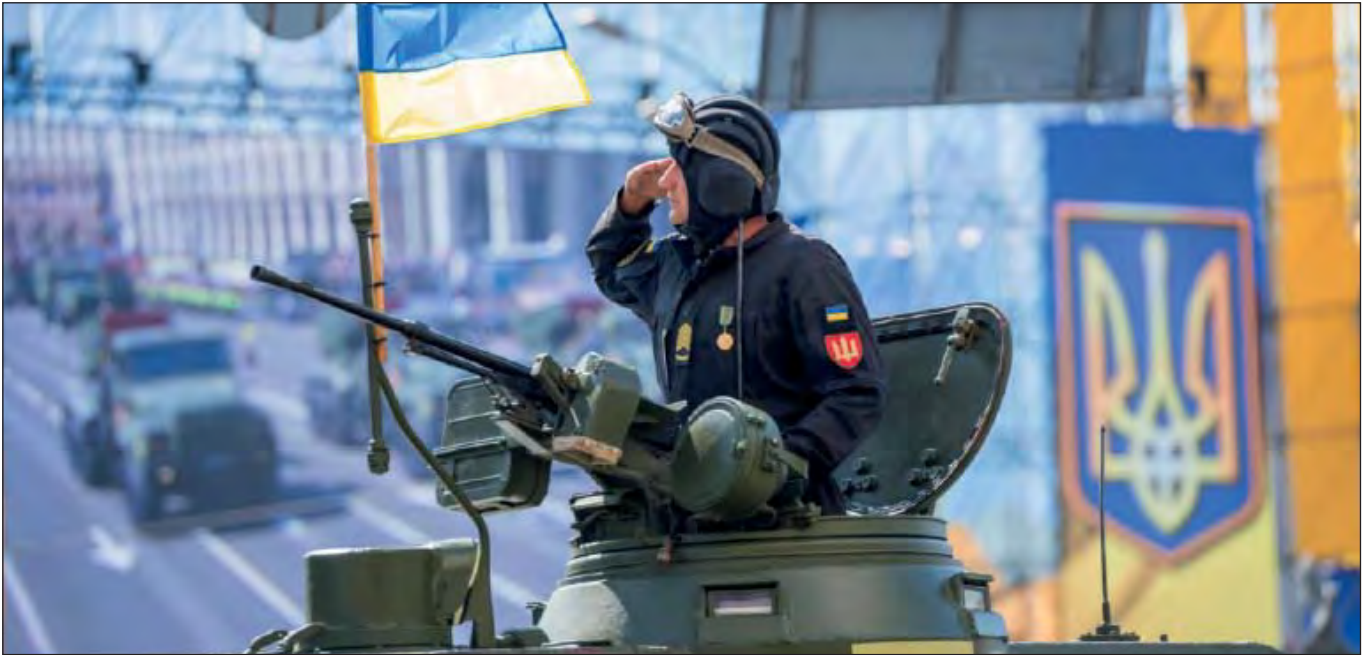
Військовий парад до Дня Незалежності України. 24 серпня 2018 р.

Цей термін підтверджується і вже прийнятими стратегічними документами. Стратегічною перспективою у сфері національної безпеки вважається строк понад п'ять років.