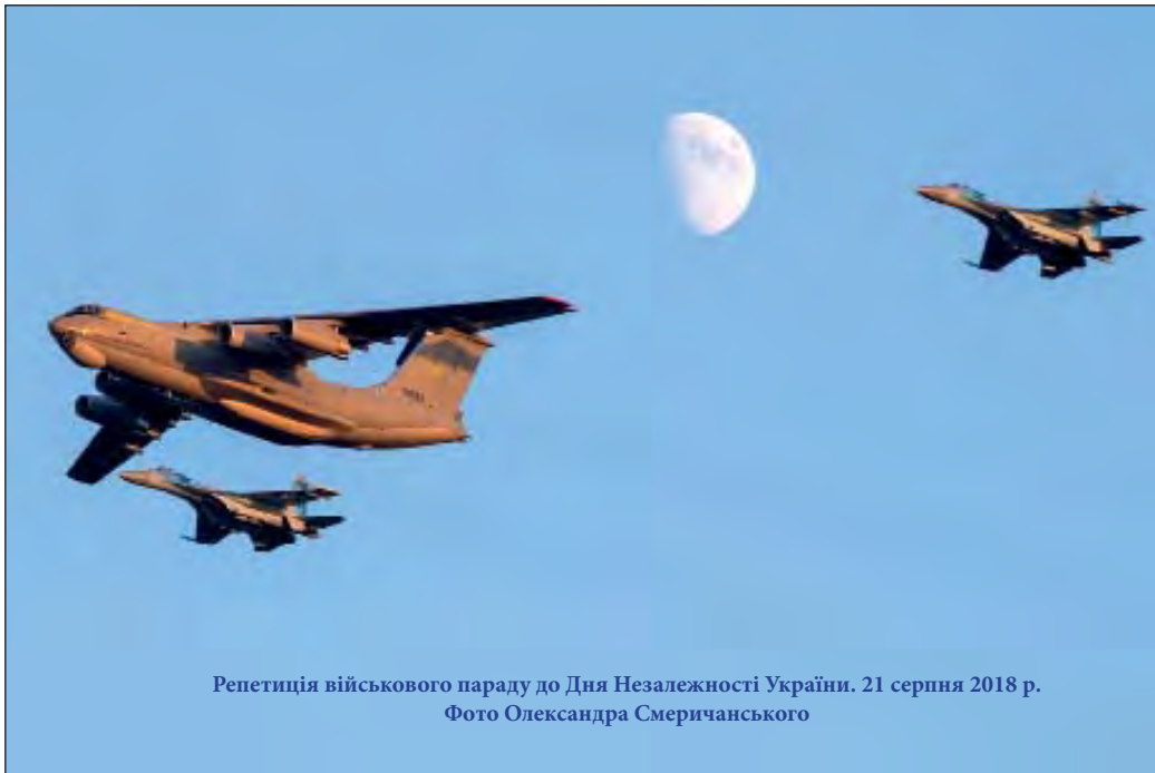
Репетиція військового параду до Дня Незалежності України. 21 серпня 2018 р.

У результаті виборці розчарувалися у більшості партій та голосують на виборах за іншими принципами (за геополітичними вподобаннями (Схід–Захід), особистими симпатіями (подобається/не подобається кандидат) тощо.