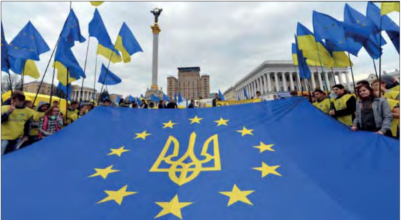
Молодь тримає прапор Євросоюзу з гербом України на Майдані Незалежності в Києві. 30 жовтня 2013 р.

За ініціативи Петра Порошенка Верховна Рада прийняла конституційні зміни, якими був закріплений курс на повноцінне членство України в НАТО і ЄС. За активної участі президента почали створювати Православну церкву України, а УПЦ МП почала втрачати свою силу. За підтримки Порошенка Київ відмовився від «Великого договору» з Російською Федерацією.