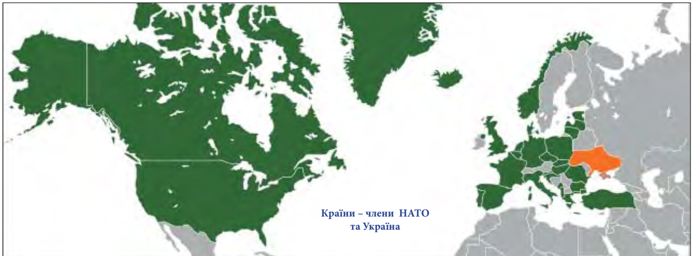
Країни – члени НАТО та Україна