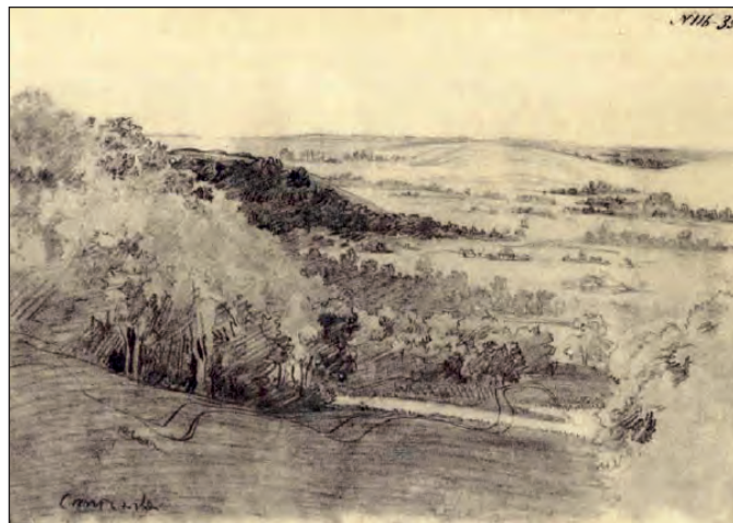
Т.Г. Шевченко. Урочище Стінка. Папір. Олівець (17x24,2 см). Травень-жовтень 1845 р. Ймовірне написання під час перебування Великого Кобзаря на Полтавщині і Київщині

В історико-біографічній праці О.О. Васильчикова «Семейство Розумовских» (Санкт-Петербург: Типографія М.М. Стасюлевича, 1880–1894 рр.) наводиться такий факт: імператриця Єлизавета Петрівна 1742 року подарувала Олексію Розумовському (1709–1771) разом з іншими маєтностями в Лубенському полку село Андріївку 1 , яке в ті часи входило до складу Лохвицької сотні. Коли Варвара Олексіївна Розумовська вийшла заміж за молодого князя М.Г. Рєпніна , то батько нареченої подарував молодятим із-поміж інших маєтностей і село Андріївку. В сорокових роках XIX ст. в Андріївці князю Рєпніну належали вісім тисяч десятин землі та 652 кріпаки чоловічої статі. На той час тут працювали гуральня, кінний і селітряний заводи.