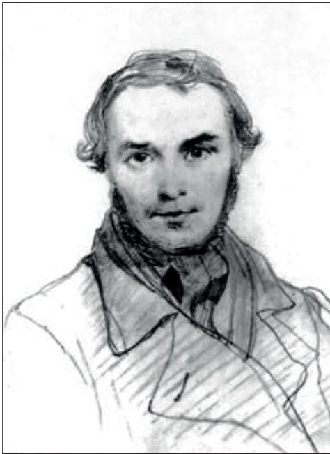
Т.Г.Шевченко. Автопортрет. Кінець серпня 1845 р., с. Потоки

го письменника В.В. Капніста (1757–1823), приятель Репніних, притягнувся до слідства у справі декабристів. Т.Шевченко познайомився з ним у 1843 р., бував у його маєтку в с. Яблуневому на Полтавщині. – В.Б. ), який поселився у нас на частину літа заради свого хворого сина, попросив дозволу провести свого знайомого, художника, в гостюву, щоб показати йому картини; дозвіл, звичайно, було дано, і тієї хвилини я дізналася лише, що це художник-живописець і поет, причому навіть більше поет, аніж живописець, і що зветь його Шевченкой. Запам'ятайте це ім'я, дорогий вчителю, воно належить моєму зоряному небу ». (Виділено мною. – В.Б. )