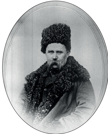
Т. Шевченко. Автопортрет у шапці та кожусі. СПБ, олівець. офорт)*