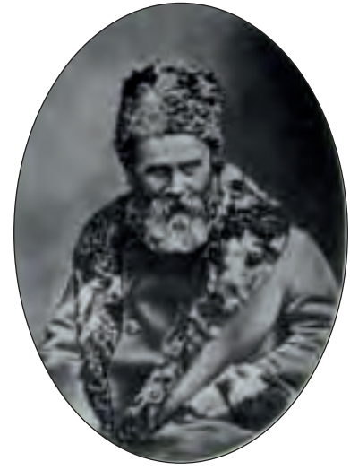
Т.Г. Шевченко. Фото від 30 березня 1858 р.

Постійно берегла пам'ять про Тараса Шевченка, розповідала про нього своїм знайомим, жваво цікавилася тим, що писали про нього журнали. Взимку 1883 року вона писала М. Чалому, біографу Т. Шевченка: «Я почула з великим задоволенням, що Полтавське земство на останньому своєму зібранні вирішило дати 500 крб. на покладження могили Шевченка». За кілька місяців вона передала до Полтави через свого племінника 180 крб. із своїх заощаджень «на пам'ятник або могилу Шевченка»