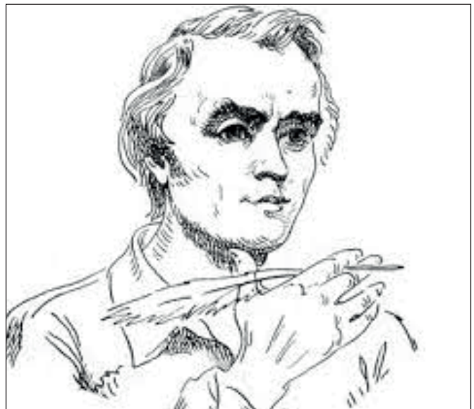
Тарас Шевченко у натхненні. (назва у версії В.Б.). Національний музей Т.Г. Шевченка ( www.museumshevchenko.org.ua )

Головні герої «Повісті» – Він і Вона. Він – поет Березовський (зумовлений Березовою Рудкою – місцем зустрічі товариства). Це – Тарас Шевченко. За головним героєм княжна сховала любий їй образ Шевченка. Вона – дочка поміщика Віра Радімова (образ героїні змальований із самої себе). Письменниця дає таку характеристику Березовському: «Его нельзя было не любить; для тех, кто истинно любил, он был источником забот, непрерывных переходов от восторга к негодованию, от сочувствия к охлаждению» . І далі: «Читая дивные свои произведения, он делался обворожительным; музыкальный голос его переливал в слушателей все глубокие чувства, которые тогда владычествовали над ним. Он одарен был больше, чем талантом, ему дан был гений...» . Письменниця із притаманною їй глибокою спостережливостю вгадала талант Шевченка. У повісті звучить невідомий голос її гарячих почуттів, безкомпромісних влучних суджень. Складовою частиною її «Повісті» є оповідання «Девочка». Сама авторка писала, що це – майже точна історія її серця, поділена на 4 етапи: 12, 18, 25 і 35 років, а в результаті – самотня могила.