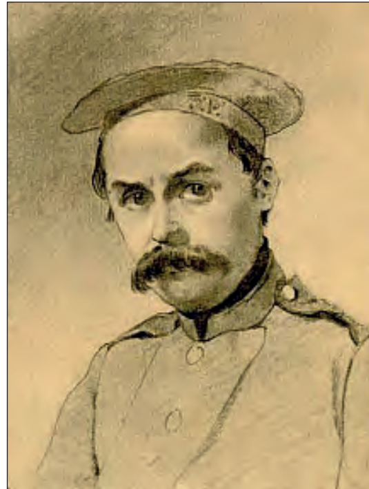
Т. Шевченко. У солдатах. Автопортрет. Червень-грудень 1847 р. Орськ. Папір, олівець

моралістом Ш. Ейнаром. Адже їхнє листування дає чимало фактів для того, щоб в'яснити обставини (окрім усього іншого) перебування Тараса Шевченка в селі Андріївці на Роменщині. (Зазначимо, що у XIX столітті це село входило до складу Гадяцького повіту Полтавської губернії). Саме у листі від 27 січня – 19 березня 1844 року Варвара Миколаївна писала про від'їзд Тараса Григоровича до Андріївки: «Він поїхав з моїм братом в Андріївку, і напередодні його від'їзду я дала йому молитву, в якій були висловлені мої побажання йому. Він повернувся через десять днів, упродовж яких я багато думала про нього.»