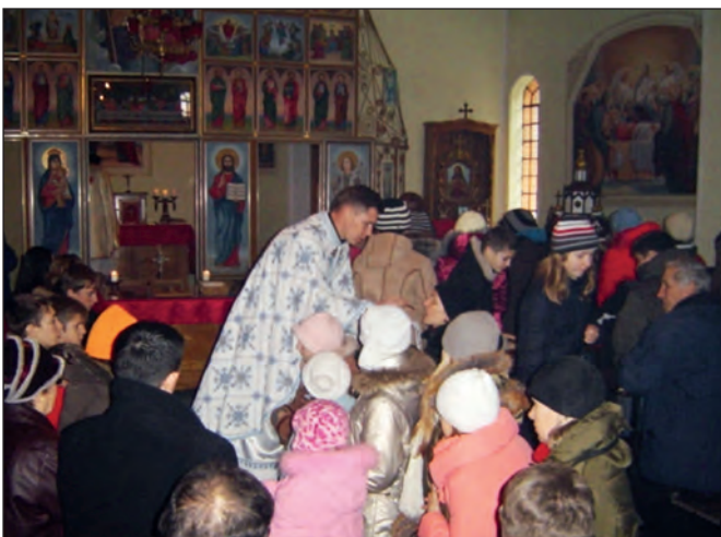
Греко-католицька церква у с. Лішня, Боснія і Херцеговина