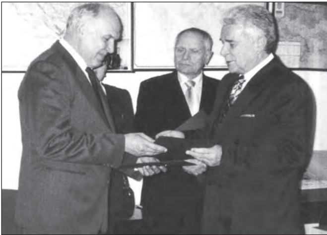
А.П. Радзіховський, Д.В. Павличко і видатний югославський історик і політичний діяч Маріо Миколич