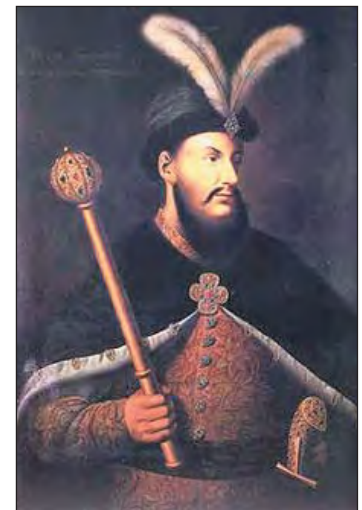
Петро Дорошенко (1627–1698)