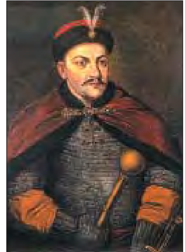
Юрась Хмельниченко (1641–1685)

Та спокою душа не матиме хитка: В Сарматівські князі – і нескінченні війни... Чекав лихий кінець – з мотузкою на шії. І тіло бідака поглинула ріка.