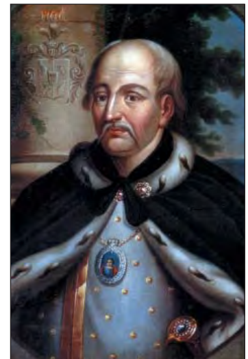
Іван Скоропадський (1646–1722)