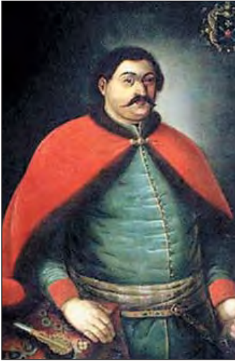
Павло Полуботок (1660–1724)

Залишив Скоропадський наказним. Лише Петро свою тримав стратегію – Малоросійську ухвалив колегію, А Вельямінова – наглядачем над ним.