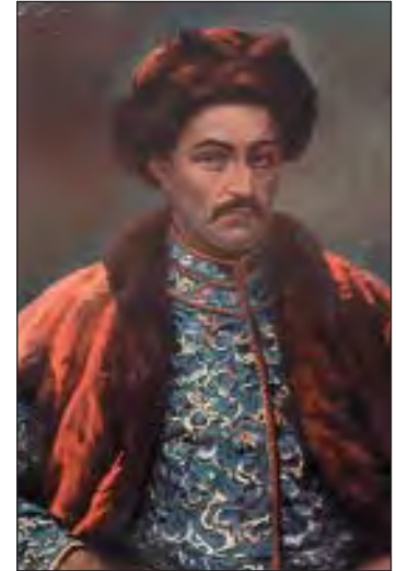
Іван Мазепа (1639–1709)

В Німеччині, у Франції, Салоніках, Шукає згуки в міжнародних хроніках І справами вміває українськими.