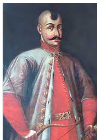
Дмитро Вишневецький (1516–1563)

Литовський князь із роду Гедемінів Старостував в Черкасах і у Каневі. Відвідав вдало терени султанові. На Хортиці фортечні вивів стіни.