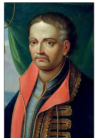
Пилип Орлик (1672–1742)