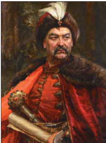
Богдан Хмельницький (1595–1657)

Є рада козаків і є козацьке коло, Є писарі, хорунжий, штаб гетьманів. Бажають успіхів їм шляхта і міщани... Майно заповідав дружині й братським школам.