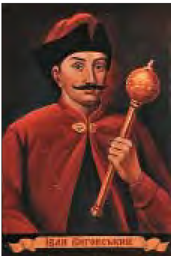
Іван Виговський (1608–1664)

Але...але... й але... Сумне яке життя! Чи, може, шведів хист вквітчає майбуття? Чи Юрій вбереже від розбрату і скрут?