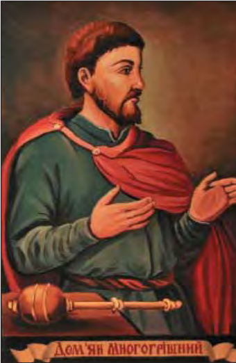
Дем'ян Многогрішний (1631–1703)

По-різному здобуті визнання – Полковників заперти у дворі, Заприсягти у вірності Москві І Дорошенка від Рогинець відігнать.