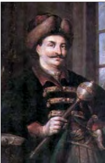
Михайло Ханенко (1620–1680)

А вдача запальна і невгамовна Потуги перемир'я переломить. І довікує у Сибіру в засланні.