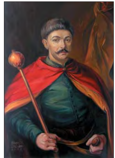
Іван Брюховецький (1623–1668)