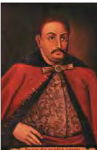
Іван Самойлович (1620–1690)

Війна на кілька літ за булаву Влаштувала Польщу і Москву. Коли три гетьмани – яка ще Україна!