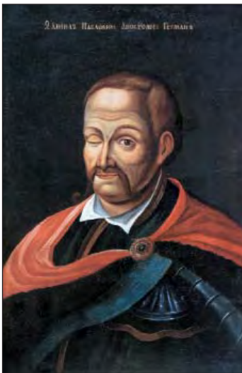
Данило Апостол (1654–1734)