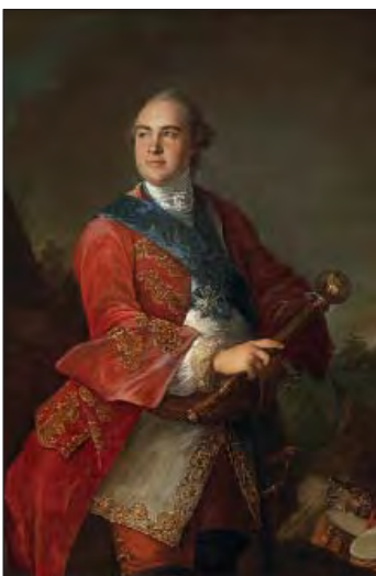
Кирило Розумовський (1728–1803)

Коли в вісімдесят він став зовсім безсилий, В імператриці, зляканій розкриллям, Гетьманство скасувати – стало в планах.