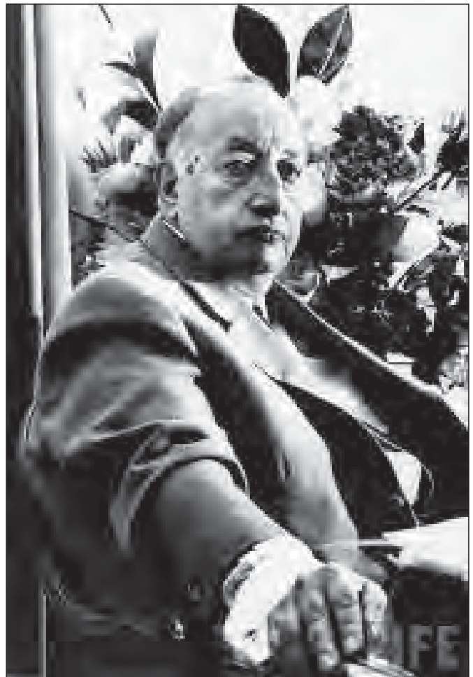
Мігель Анхель Астуриас

Документів, що засвідчували б знайомство та листування О. Прицака з П. Тичиною, в архіві вченого не виявлено. З листа І. Драча до вченого від 1 лютого 1967 р. відомо, що вони разом з Д. Павличком після повернення зі США до України надіслали О. Прицакові деякі матеріали про П. Тичину. Ставлення І. Драча до висунення О. Прицаком трьох поетів на премію та реакцію влади і суспільства в Україні щодо цього, містить лист поета від 23 лютого 1967 р.: «...мені здається, що з висуненням на Нобелівську премію було не все до ладу – два поети молодших були там зайві з усіх мотивів. Крім всяких інших аспектів,