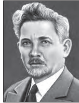
Степан Тимошенко (23.12.1878 – 29.05.1972)

Наприкінці 1920-х років вченому прикріпили ярлик " націоналіста ", викликали на допити. 3 червня 1930 року Павло Аполлонович Тутковський помер. Похований на Лук'янівському цвинтарі у Києві. Сина, Сергія Тутковського , професора історії Київського університету, заарештували і знищили.