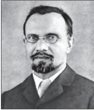
Агатангел Кримський (15.01.1871 – 25.01.1942)

неодмінний секретар УАН, член історико-філологічного відділу (I відділ)