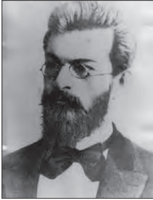
Павло Тутковський (1.03.1858 – 3.06.1930)