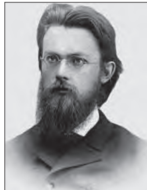
Володимир Вернадський (12.03.1863 – 6.01.1945) перший президент УАН,

Мета цієї розвідки – подати бодай стисло інформацію про долю вчених, науковими доробками яких закладався фундамент Української академії наук.