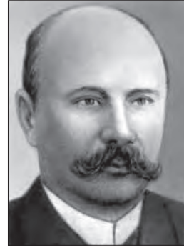
Степан Смаль-Стоцький (9.01.1859 – 17.08.1938)

У 1971 році Володимир-Волинському педагогічному училищу було присвоєно ім'я А.Ю. Кримського, у 1992 році засновано Волинську обласну премію імені Агатангела Кримського. Інститут сходознавства НАН України носить ім'я А. Кримського – одного з найвидатніших орієнталістів в історії світової філологічної науки.