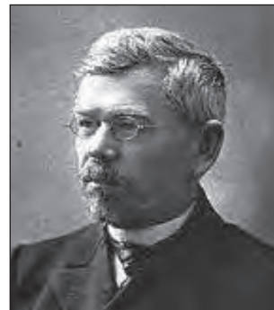
Дмитро Багалій (7.11.1857 – 9.02.1932)