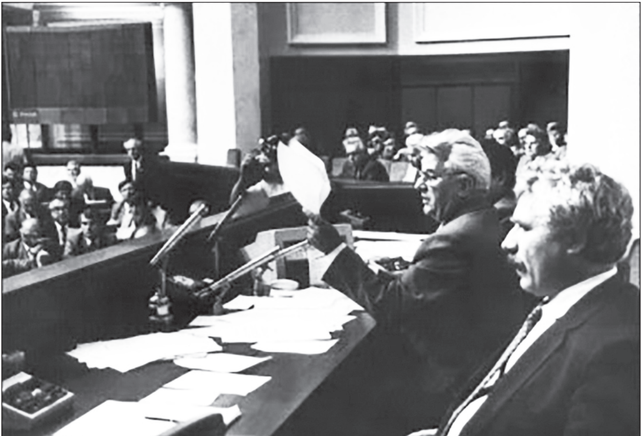
Голова Верховної Ради України Леонід Кравчук зачитує Акт проголошення незалежності України. Київ, 24 серпня 1991 р.

Проблема КПУ як невід'ємної частини КПРС була розв'язана в ці дні не пакетним голосуванням, яке загрожувало неприйняттям Акту проголошення незалежності, але все-таки розв'язана. Причому рішення приймав не весь склад парламенту з прокомуністичною більшістю, а тільки його Президія, хоча вона теж складалася переважно з комуністів. 26 серпня Президія Верховної Ради видала Указ про тимчасове припинення діяльності Компартії України, а також про опечатування і взяття під охорону службових приміщень компартійних комітетів для того, щоб забезпечити збереження майна і документів від розкрадання, руйнування і знищення. 30 серпня, коли створена Президією Верховної Ради комісія довела участь партпарату в підготовці та здійсненні путчу, Л. Кравчук підписав указ про заборону діяльності Компартії України. ■