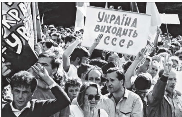
Мітинг на площі біля Верховної Ради України. Київ, 24 серпня 1991 р..

яка панувала на цих обговореннях, що передували відкриттю позачергової сесії парламенту [2, С. 15]: