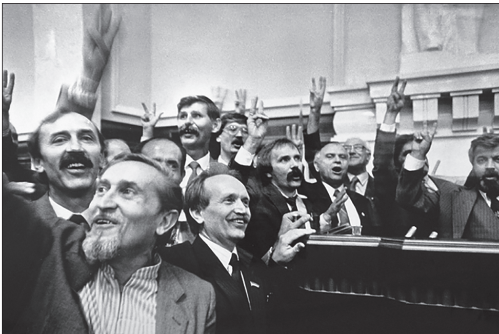
Верховна Рада України схвалила Акт проголошення незалежності України. 24 серпня 1991 р.

Поставлений на голосування, Акт проголошення незалежності України був прийнятий конституційною більшістю голосів: 346 народних депутатів “за”, 4 – “проти” при незначній групі тих, хто утримався. Референдум на підтвердження Акта призначався на 1 грудня 1991 р.