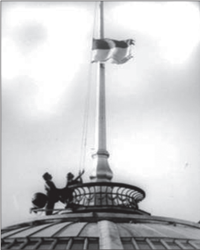
Підняття національного жовто-блакитного прапора над куполом будівлі Верховної Ради України. Київ, 24 серпня 1991 р.

На розвиток положень, проголошених в Акті, парламент прийняв того дня кілька постанов. Визнавалося необхідним створити Раду оборони, Збройні сили України, Національну гвардію. Урядові доручалося перевести у власність України підприємства союзного підпорядкування, ввести в обіг власну грошову одиницю і забезпечити її конвертування. Верховна Рада припинила діяльність осередків політичних партій в усіх органах влади та управління, в правоохоронних органах, установах радіо і телебачення та в інших державних установах, органах і організаціях.