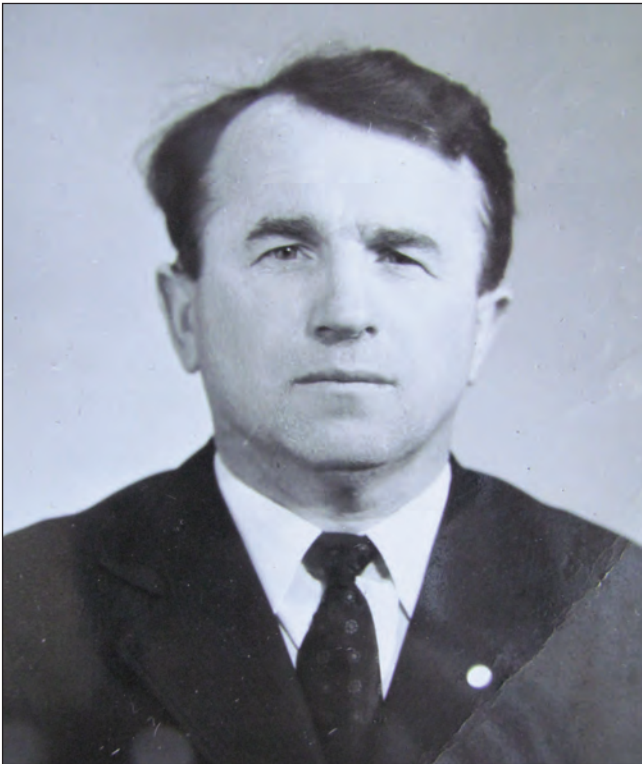
Портрет І. Кочанського, 1974